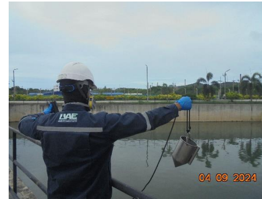
รูปที่ 2-18 บ่อพักน้ำ Retention Pond