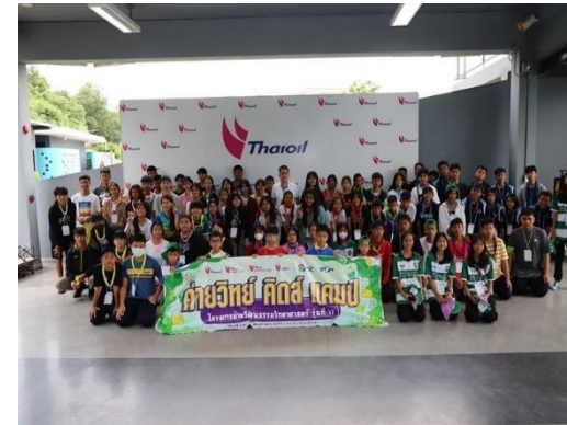
รูปที่ 2-45 (ต่อ) การให้การสนับสนุนกิจกรรมด้านการศึกษาของสถาบันการศึกษา