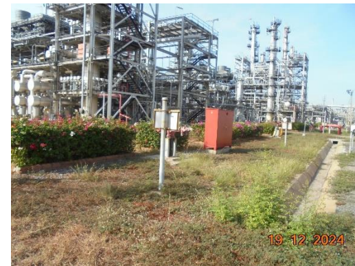
รูปที่ 2-46 (ต่อ) พื้นที่สีเขียวของโครงการ