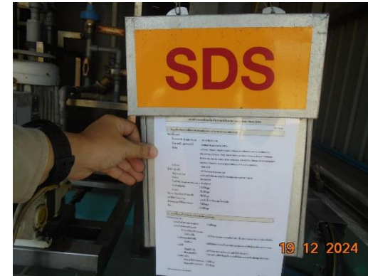
รูปที่ 2-25 บ้ายรายละเอียดเกี่ยวกับข้อมูลความปลอดภัยของสารเคมี ในบริเวณที่มีการดำเนินงานเกี่ยวกับสารเคมีอันตราย