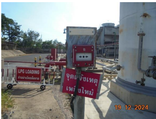
รูปที่ 2-34 จุดแจ้งเหตุเพลิงไหม้