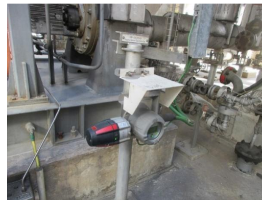
รูปที่ 2-29 ระบบตรวจจับก๊าซพิษในพื้นที่กระบวนการผลิต