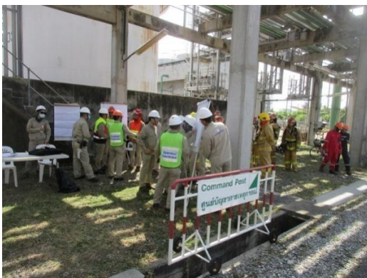
รูปที่ 2-33 การฝึกซ้อมดับเพลิง