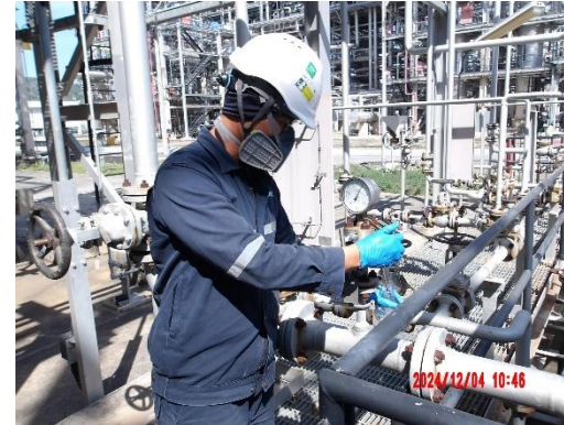
รูปที่ 2-16 บ่อเก็บรวบรวม Process Oily Water Drum