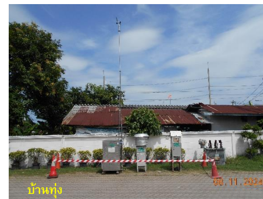
รูปที่ 2-1 (ต่อ) กิจกรรมที่เกิดขึ้นโดยรอบจุดตรวจวัดคุณภาพอากาศ