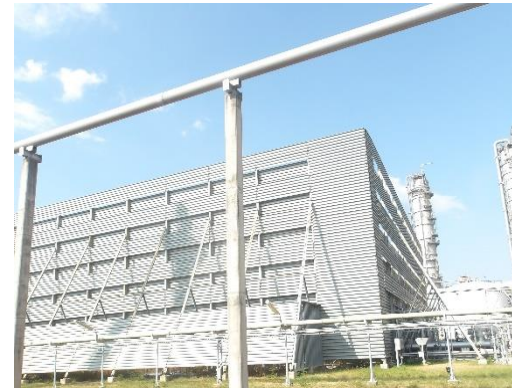
รูปที่ 2-6 ระบบหอเผาของ บริษัท ไทยพาราไซลีน จำกัด