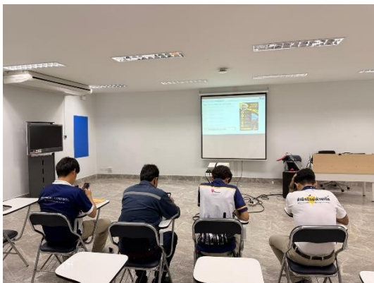
รูปที่ 2-48 (ต่อ) การตรวจวัดแอลกอฮอล์ของผู้ขับและ การอบรมความปลอดภัยในการขนส่ง