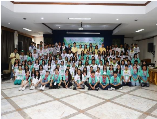
รูปที่ 2-45 การให้การสนับสนุนกิจกรรมด้านการศึกษาของสถาบันการศึกษา