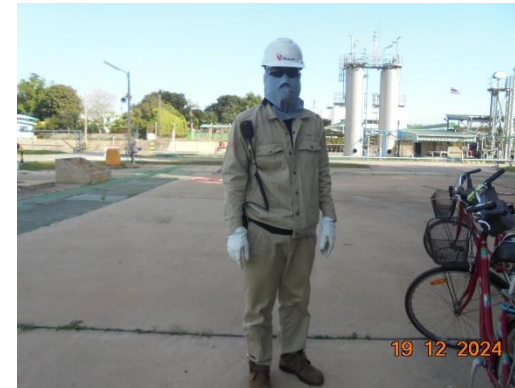
รูปที่ 2-10 คนงานสวมใส่อุปกรณ์คุ้มครองความปลอดภัยส่วนบุคคล