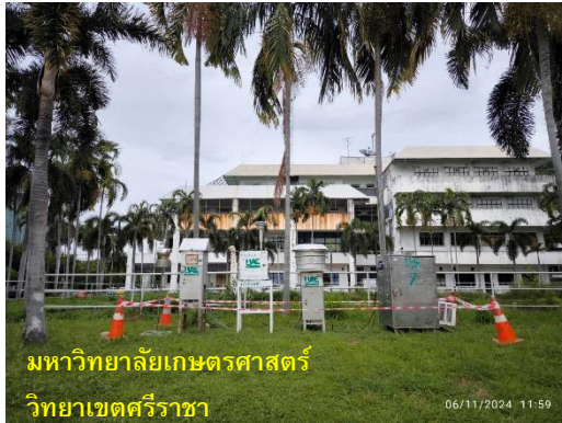
รูปที่ 2-1 กิจกรรมที่เกิดขึ้นโดยรอบจุดตรวจวัดคุณภาพอากาศ