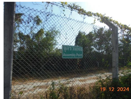
รูปที่ 2-31 จุดรวมพล