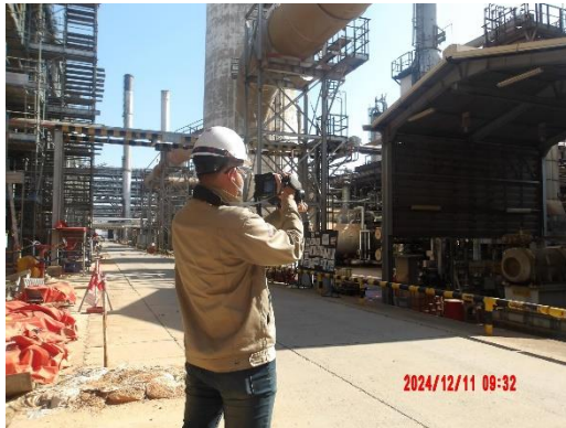
รูปที่ 2-5 การตรวจสอบแหล่งกำเนิดชนิดฟุ้งกระจาย (Fugitive Sources) ในพื้นที่กระบวนการผลิต