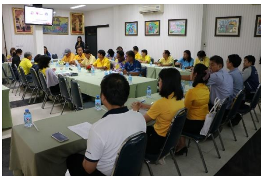
รูปที่ 2-36 การประชาสัมพันธ์ข้อมูลข่าวสารของโครงการ