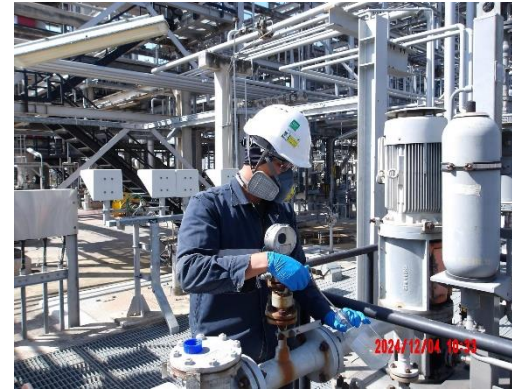
รูปที่ 2-14 ระบบบำบัด Sour Water Stripper-4