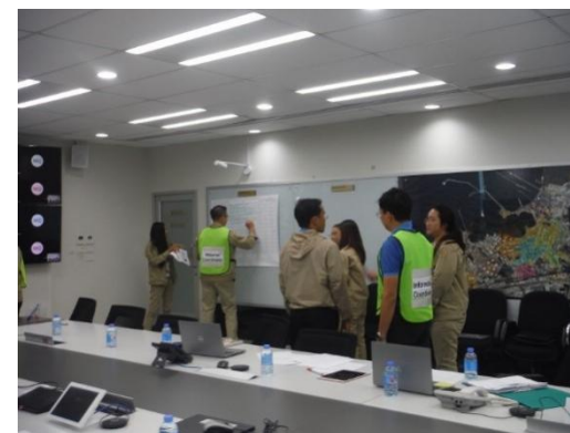
รูปที่ 2-35 ศูนย์สื่อสารเหตุฉุกเฉิน (Information Center)