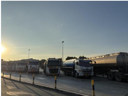
รูปที่ 2-24 ลานจอดรถขนถ่ายผลิตภัณฑ์