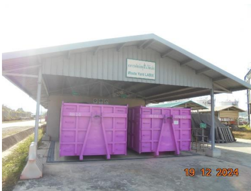
รูปที่ 2-21 อาคารเก็บกากของเสียที่มีหลังคาปกคลุม