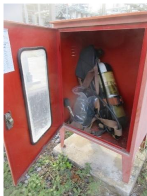
รูปที่ 2-30 อุปกรณ์ป้องกันระบบทางเดินหายใจ (SCBA)