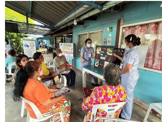
รูปที่ 2-42 การออกหน่วยสาธารณสุขเคลื่อนที่ในชุมชนที่ใกล้เคียงกับโครงการ