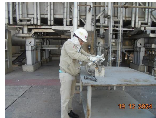
รูปที่ 2-12 พนักงานเดินตรวจสอบภายในพื้นที่กระบวนการผลิต