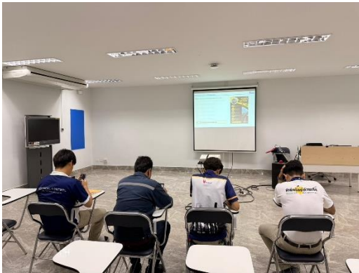
รูปที่ 2-13 การอบรมให้ความรู้ด้านกฎระเบียบความปลอดภัยในการทำงาน