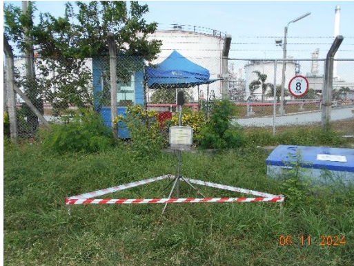
รูปที่ 2-7 การติดตามตรวจสอบระดับเสียงรบกวนโครงการด้านทิศตะวันตก