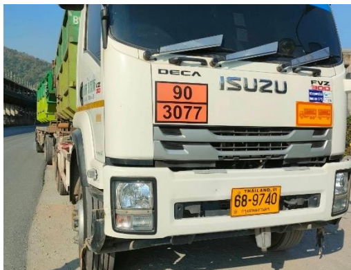
รูปที่ 2-23 รถขนส่งกากของเสียอุตสาหกรรมของโครงการ