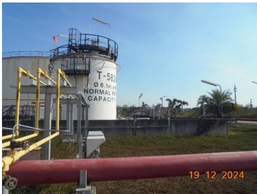
รูปที่ 2-40 Dike Area บริเวณถังเก็บกัก