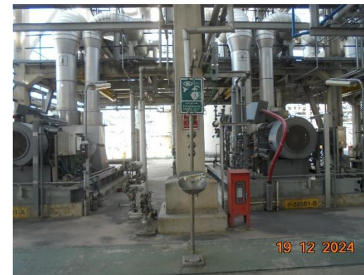
รูปที่ 2-27 ฝักบัวอาบน้ำ ล้างตา จุกเงิน