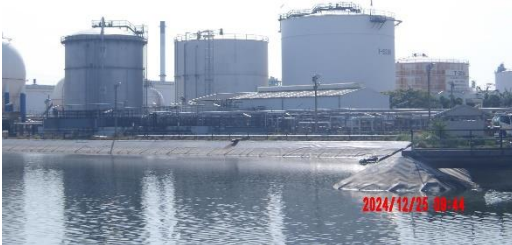
รูปที่ 2-15 โรงงานปรับปรุงคุณภาพน้ำเสียรวม ของบริษัท ไทยออยล์ จำกัด (มหาชน)