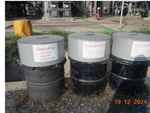
รูปที่ 2-20 ถังขยะที่มีฝาปิดมิดชิด