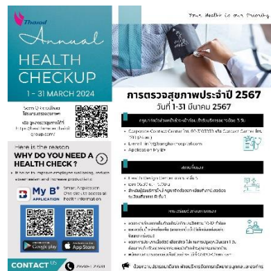
รูปที่ 2-3 การประชาสัมพันธ์เตรียมความพร้อมก่อนการตรวจสุขภาพ