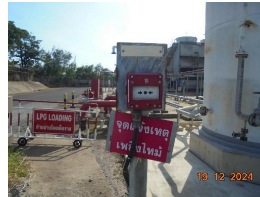
รูปที่ 2-32 (ต่อ) ระบบป้องกันและระงับอัคคีภัย