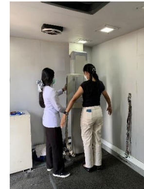
รูปที่ 2-2 การตรวจสอบภาพประจำปี