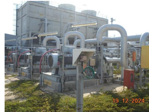
รูปที่ 2-39 Flow Meter