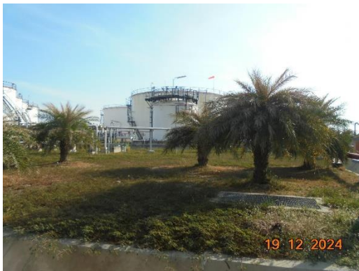
รูปที่ 2-46 พื้นที่สีเขียวของโครงการ