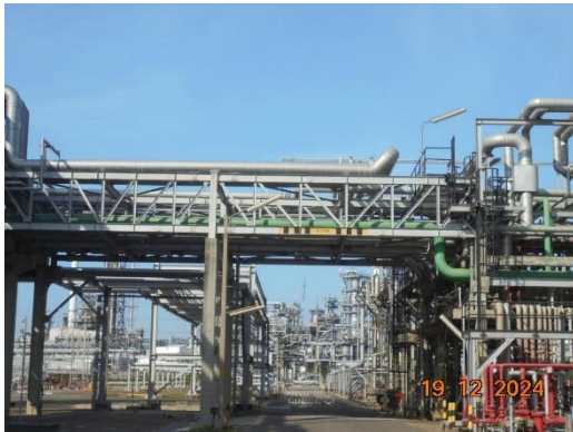
รูปที่ 2-38 การวางท่อบน Pipe Rack หรือ Pipe Bridge ในลักษณะที่ปลอดภัย