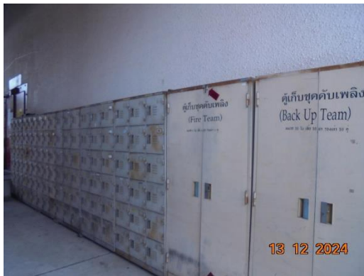
รูปที่ 2-11 อุปกรณ์คุ้มครองความปลอดภัยส่วนบุคคล