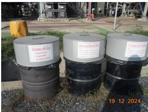
รูปที่ 2-47 ถังขยะภายในบริเวณโครงการ