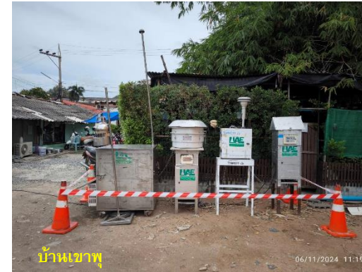
รูปที่ 2-1 (ต่อ) กิจกรรมที่เกิดขึ้นโดยรอบจุดตรวจวัดคุณภาพอากาศ