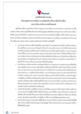
รูปที่ 2-26 นโยบายด้านคุณภาพ ความปลอดภัย และอาชีวอนามัย