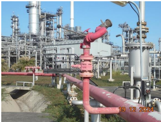
รูปที่ 2-32 (ต่อ) ระบบป้องกันและระงับอัคคีภัย