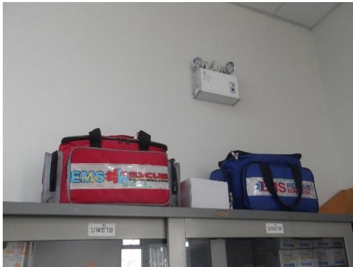
รูปที่ 2-41 (ต่อ) ห้องพยาบาลและอุปกรณ์ปฐมพยาบาลเบื้องต้น