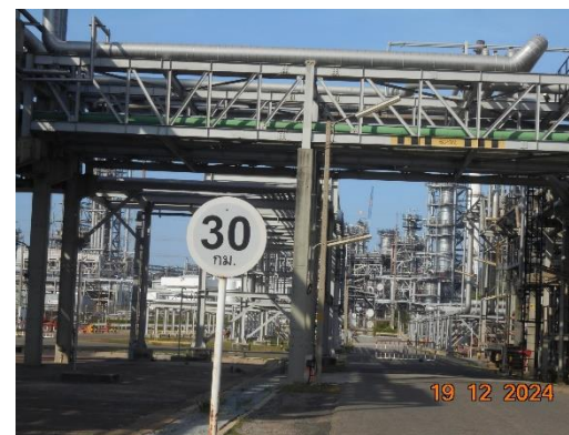
รูปที่ 2-22 ป้ายเตือนให้ควบคุมความเร็วในเขตพื้นที่โรงงาน