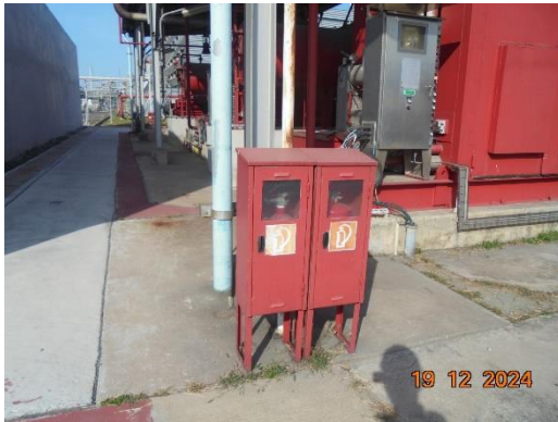
รูปที่ 2-32 ระบบป้องกันและระงับอัคคีภัย