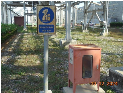
รูปที่ 2-9 ป้ายเตือนให้คนงานสวมใส่อุปกรณ์คุ้มครองความปลอดภัยส่วนบุคคล