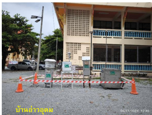
รูปที่ 2-1 (ต่อ) กิจกรรมที่เกิดขึ้นโดยรอบจุดตรวจวัดคุณภาพอากาศ