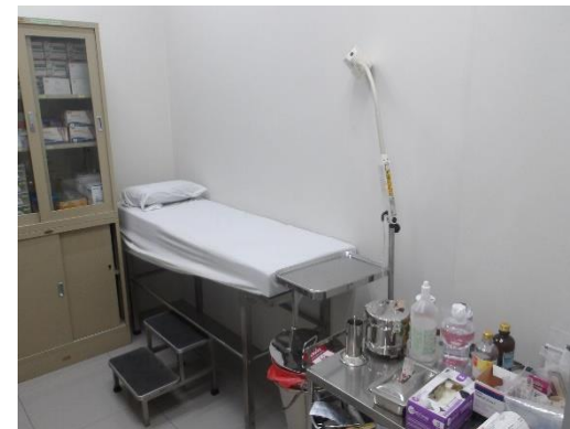
รูปที่ 2-41 ห้องพยาบาลและอุปกรณ์ปฐมพยาบาลเบื้องต้น