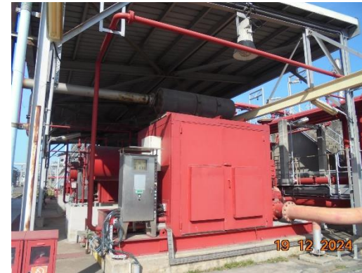
รูปที่ 2-32 (ต่อ) ระบบป้องกันและระงับอัคคีภัย