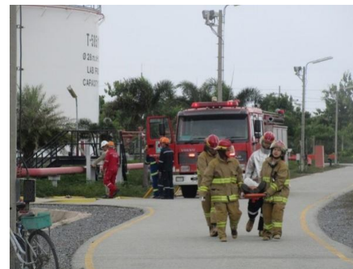
รูปที่ 2-33 (ต่อ) การฝึกซ้อมดับเพลิง