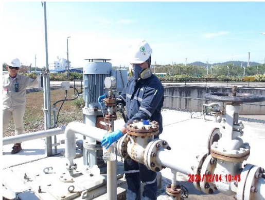
รูปที่ 2-17 บ่อพักน้ำ Oil Separator Pond