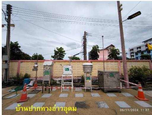
รูปที่ 2-1 (ต่อ) กิจกรรมที่เกิดขึ้นโดยรอบจุดตรวจวัดคุณภาพอากาศ