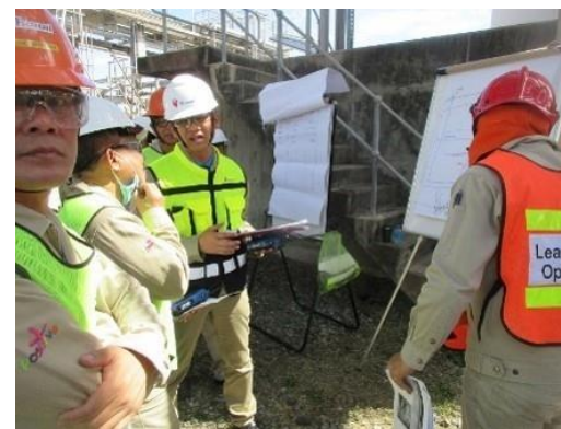
รูปที่ 2-33 (ต่อ) การฝึกซ้อมดับเพลิง