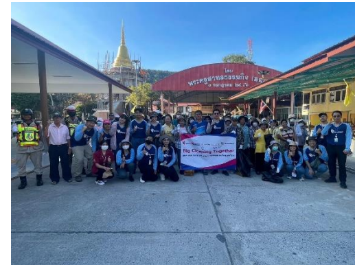
รูปที่ 2-44 การเข้าร่วมกิจกรรมทางศาสนากับชุมชนในพื้นที่