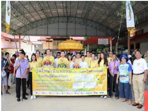
รูปที่ 2-43 การเข้าร่วมกิจกรรมกับทางชุมชนในการปรับปรุงสิ่งแวดล้อม