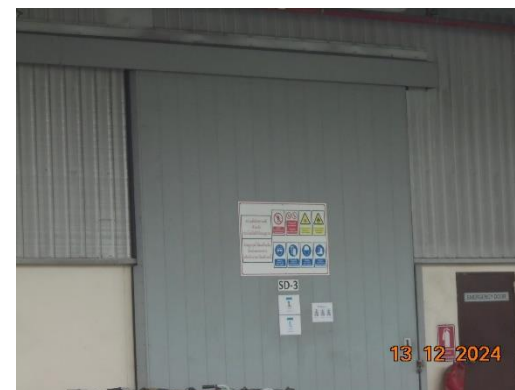
รูปที่ 2-37 เขตพื้นที่หวงห้าม เขตพื้นที่ควบคุม