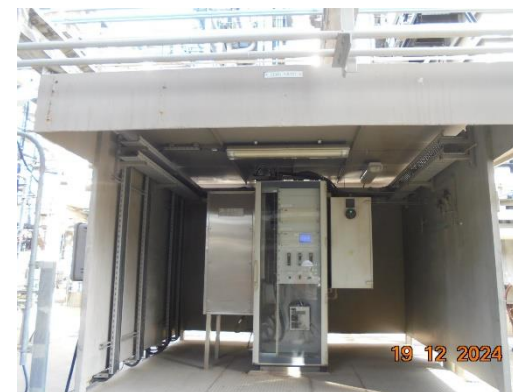
รูปที่ 2-4 การติดตั้งระบบตรวจวัดคุณภาพอากาศแบบต่อเนื่อง (CEMS)