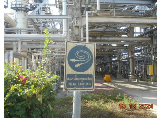
รูปที่ 2-8 ป้ายแจ้งเตือนเขตระดับเสียง