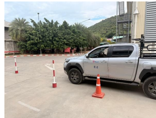
รูปที่ 2-48 (ต่อ) การตรวจวัดแอลกอฮอล์ของผู้ขับและ การอบรมความปลอดภัยในการขนส่ง