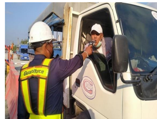
รูปที่ 2-48 การตรวจวัดแอลกอฮอล์ของผู้ขับและ การอบรมความปลอดภัยในการขนส่ง