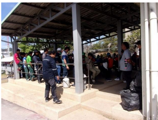
รูปที่ 2-33 (ต่อ) การฝึกซ้อมดับเพลิง