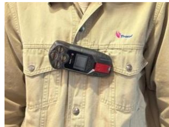
รูปที่ 2-11 การติดเครื่องเฝ้าระวังสารประกอบไฮโดรคาร์บอนส่วนบุคคล เวลาเข้าปฏิบัติงานหน้าท่าเทียบเรือ