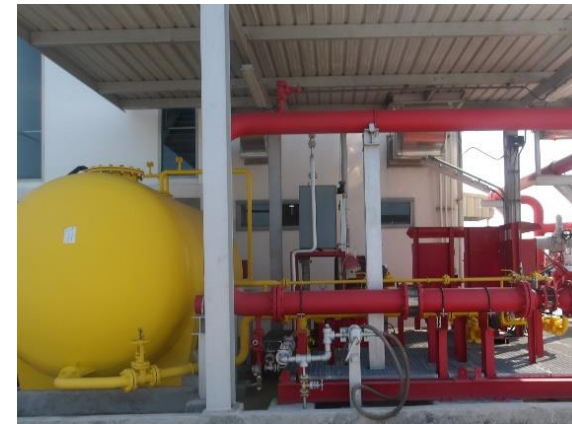
รูปที่ 2-14 การติดตั้งเครื่องฉีดน้ำและโฟมดับเพลิง บริเวณท่าเทียบเรือ