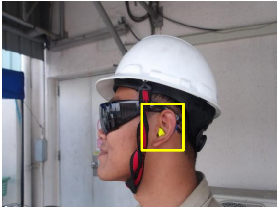
รูปที่ 2-1 จัดเตรียมปลั๊กอุดหู (Ear Plugs) สำหรับพนักงาน