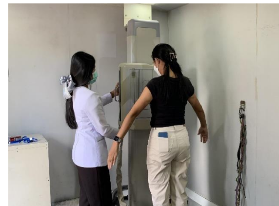
รูปที่ 2-20 การตรวจสอบคุณภาพพนักงาน