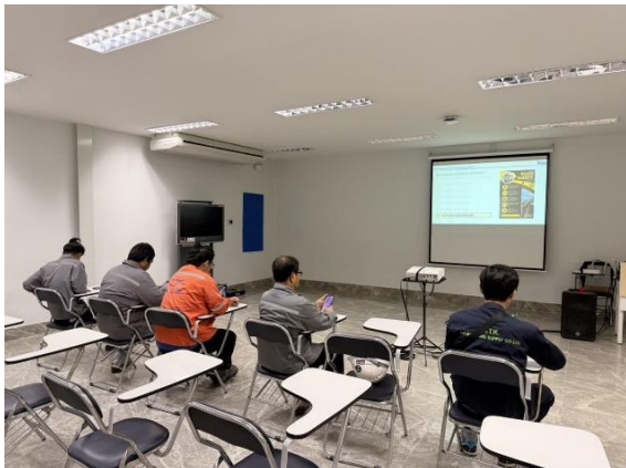
รูปที่ 2-3 การจัดอบรมเกี่ยวกับความปลอดภัยในการทำงาน บริเวณที่มีเสียงดังให้แก่พนักงาน