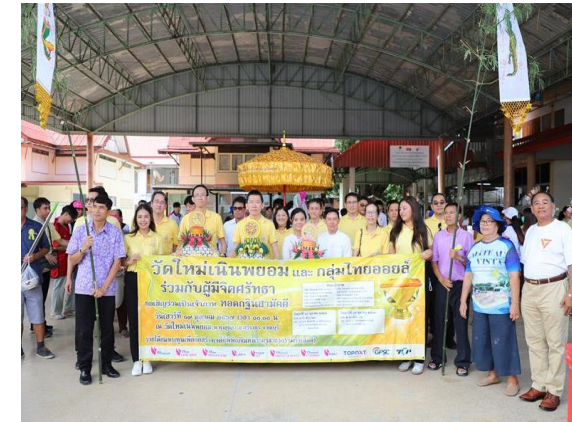
รูปที่ 2-9 กิจกรรมส่งเสริม/สนับสนุนกิจกรรมสาธารณประโยชน์ของชุมชน