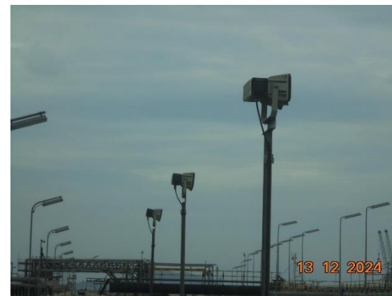
รูปที่ 2-6 ติดตั้งระบบไฟฟ้าแสงสว่างและไฟจราจรบนสะพานท่าเรือ