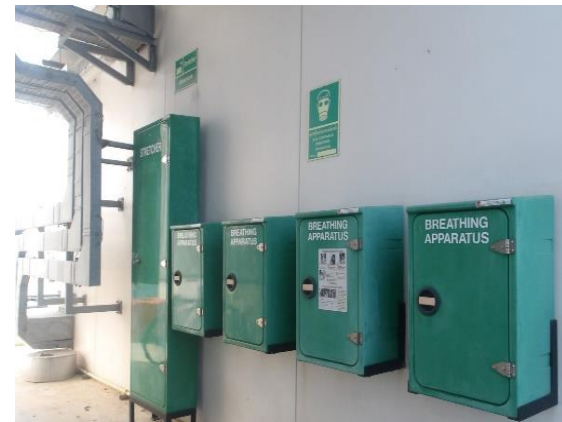
รูปที่ 2-13 อุปกรณ์ป้องกันอันตรายส่วนบุคคลแก่พนักงาน เมื่อต้องมีการสัมผัสกับผลิตภัณฑ์น้ำมันสำเร็จรูปและปิโตรเคมี