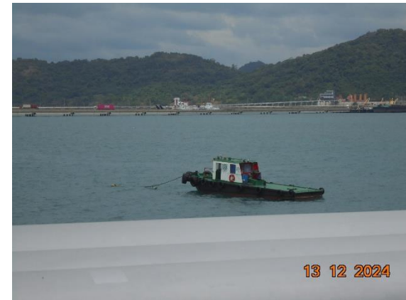
รูปที่ 2-18 เรือประจำท่า