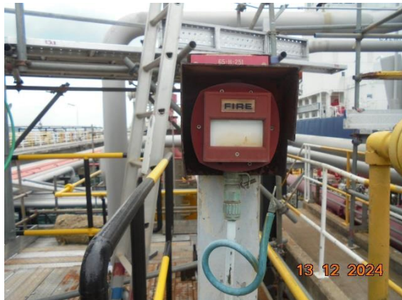
รูปที่ 2-17 ติดตั้งระบบป้องกันภัยและสัญญาณเตือนภัยตามจุด หรือพื้นที่ที่คาดว่าจะมีความเสี่ยง