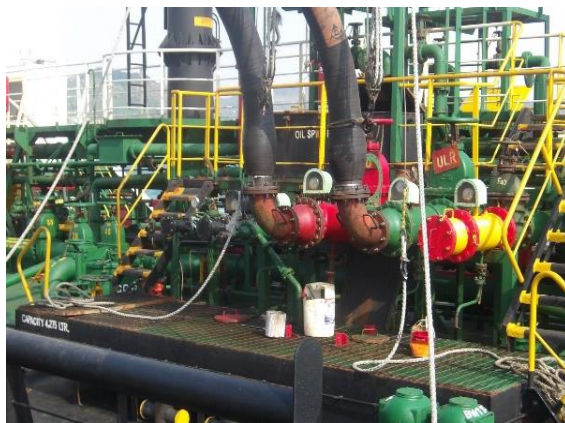
รูปที่ 2-19 ถาดรองรับน้ำมันที่อาจรั่วจากการต่อเชื่อมท่อสูบน้ำ