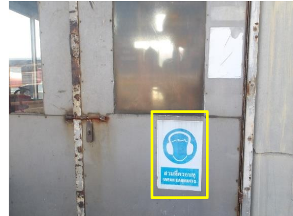
รูปที่ 2-2 ป้ายแสดงสำหรับพื้นที่ที่เป็นอันตรายต่อการได้ยิน