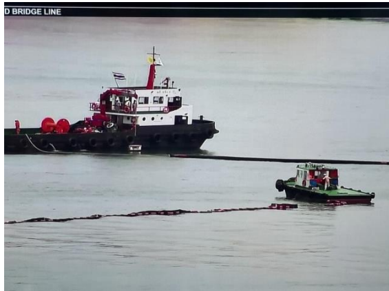
รูปที่ 2-15 เรือติดตั้งเครื่องฉีดน้ำและโฟมดับเพลิง เพื่อช่วยดับเพลิงเมื่อเกิดเหตุเพลิงไหม้บนเรือและทุ่นรับน้ำมัน และท่าเรือ