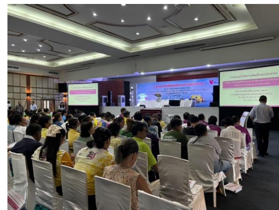
รูปที่ 2-8 การประชาสัมพันธ์ข้อมูลข่าวสารของโครงการ