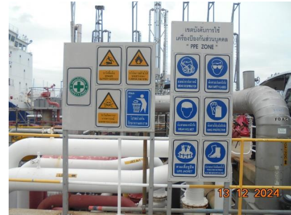
รูปที่ 2-16 ป้ายเตือนบริเวณพื้นที่ปฏิบัติงานที่อาจก่อให้เกิดอันตราย