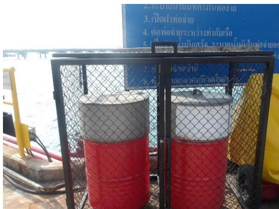
รูปที่ 2-7 ถังขยะแยกประเภทภายในพื้นที่โครงการ