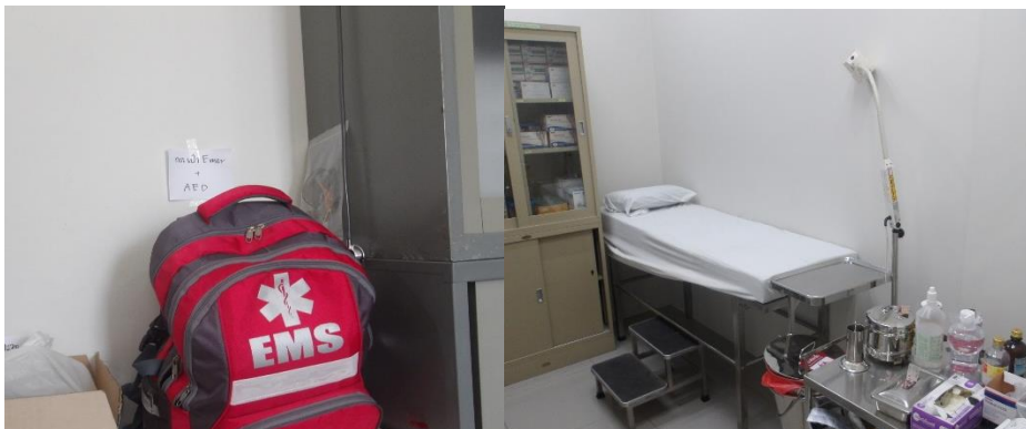
รูปที่ 2-10 อุปกรณ์ปฐมพยาบาลเบื้องต้นในพื้นที่โครงการ