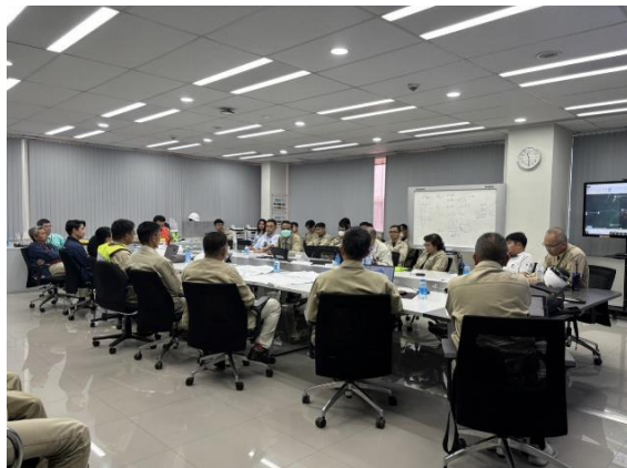
รูปที่ 2-12 การซ้อมแผนฉุกเฉิน