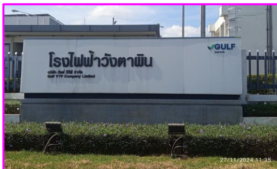
สถานีควบคุมความดันและวัดปริมาณก๊าซ (MRS)