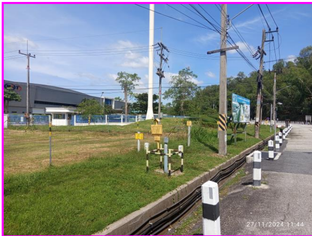
ป้ายเตือนแนวท่อส่งก๊าซฯ บริเวณโรงงาน