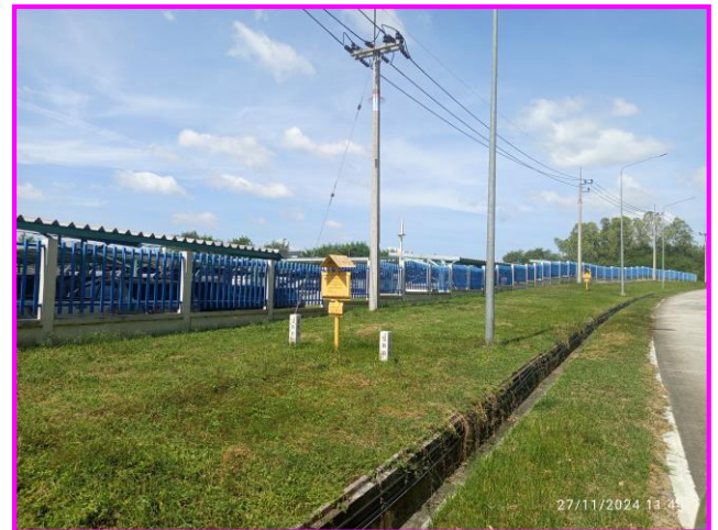
ป้ายเตือนแนวท่อส่งก๊าซฯ บริเวณโรงงาน