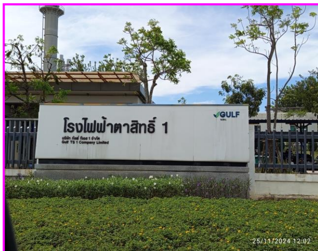
บริเวณด้านหน้าโรงงาน