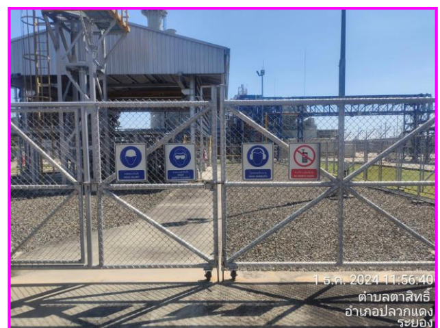
ป้ายเตือนต่าง ๆ บริเวณสถานีควบคุมความดันก๊าซ (MRS)

ภาพที่ 3.2-16 ภาพถ่ายระบบรักษาความปลอดภัยตามแนวท่อส่งก๊าซฯ และบริเวณสถานีก๊าซฯ ของโครงการท่อส่งก๊าซธรรมชาติไปยังโรงไฟฟ้าตาสีห์ 2 โรงไฟฟ้าตาสีห์ 1 และโรงไฟฟ้าวังตาปิน