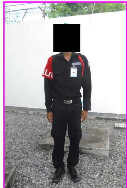
เจ้าหน้าที่รักษาความปลอดภัย