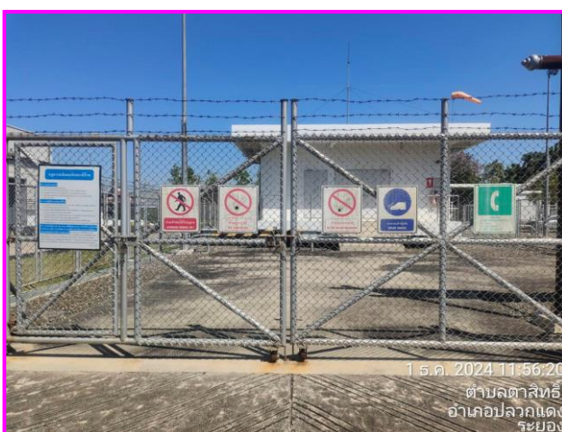
ป้ายเตือนต่าง ๆ บริเวณสถานีควบคุมความดันก๊าซ (MRS)