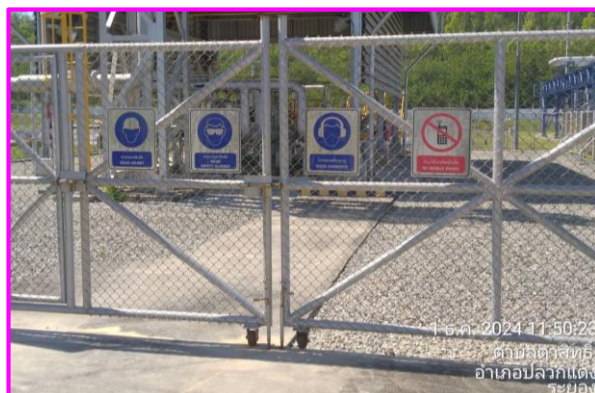
ป้ายเตือนต่าง ๆ บริเวณ (MRS)

ภาพที่ 2.1-16 สภาพปัจจุบันตามแนวท่อส่งก๊าซฯ ของโครงการท่อส่งก๊าซธรรมชาติ ไปยังโรงไฟฟ้าตาสีทรี 2 โรงไฟฟ้าตาสีทรี 1 และโรงไฟฟ้าวังตาปิน