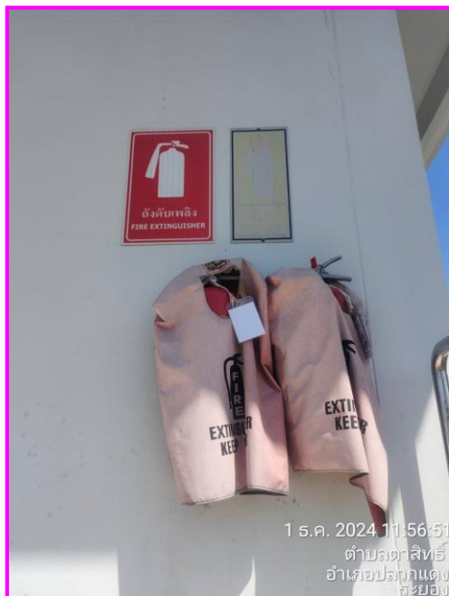
ถังดับเพลิงบริเวณท่อส่งก๊าซฯ