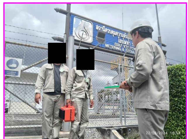
พนักงานสวมใส่ชุด PPE