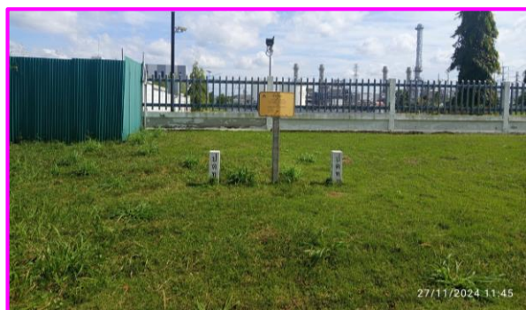
ป้ายเตือนแนวท่อส่งก๊าซฯ บริเวณท่อส่งก๊าซธรรมชาติ