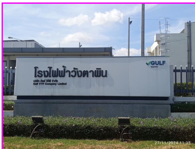
บริเวณด้านหน้าโรงงาน