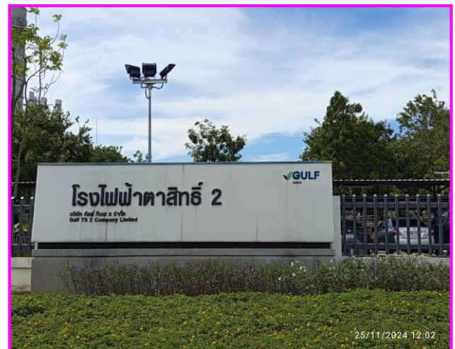
บริเวณด้านหน้าโรงงาน