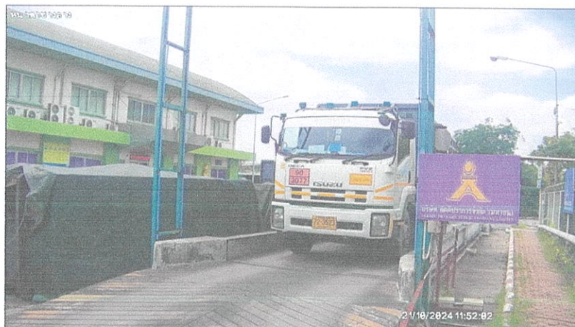
เตาเผาขยะอุตสาหกรรม บริษัท อัครีปราการ จำกัด (มหาชน)