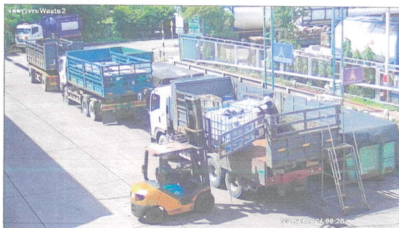
เตาเผาขยะอุตสาหกรรม บริษัท อัครีปราการ จำกัด (มหาชน)