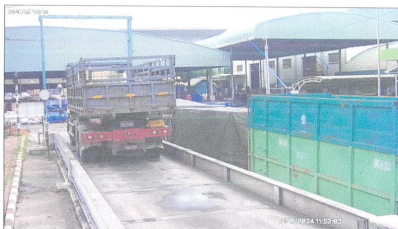
เตาเผาขยะอุตสาหกรรม บริษัท อัครีปราการ จำกัด (มหาชน)