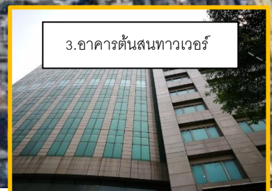
3. อาคารต้นสนทาวเวอร์