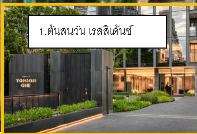
1. ต้นสนวัน เรสซิเดนซ์