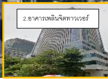
2. อาคารเพลินจิตทาวเวอร์