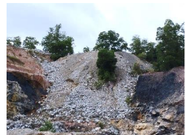
กองเปลือกหิน/ดิน