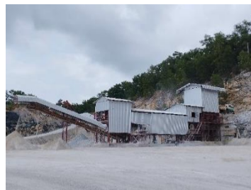
โรงแต่งแร่ของโครงการ