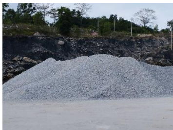
ลานเก็บกองแร่