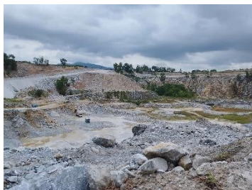
พื้นที่หน้าเหมือง