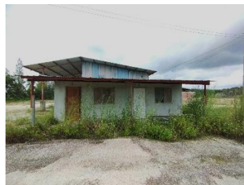
บ้านพักพนักงาน