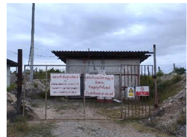
อาคารเก็บวัตถุระเบิด