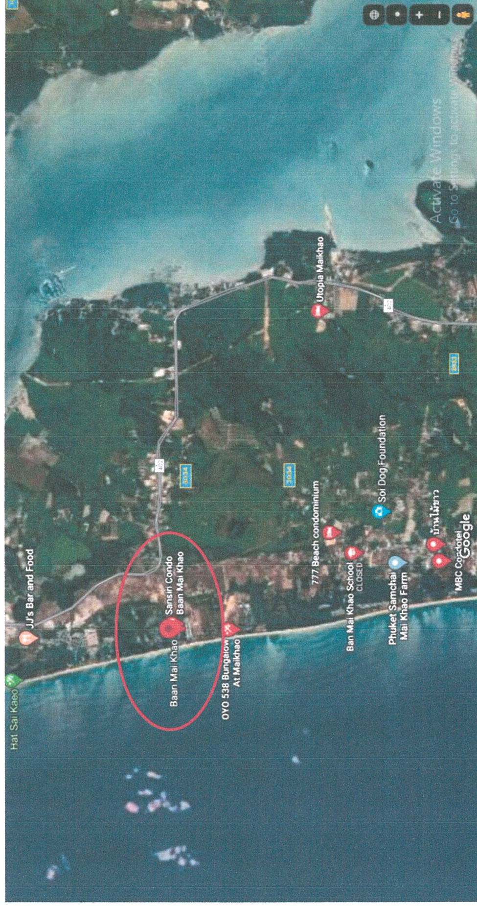
รูปแผนที่ 1.1 แผนที่ตั้งของโครงการ บ้านไม้ขาว-ภูเก็ต (BAAN MAI KHAO PHUKET) (Top view)

รายงานผลการปฏิบัติงานมาตรการป้องกันและแก้ไขผลกระทบสิ่งแวดล้อมและมาตรการติดตามตรวจสอบคุณภาพสิ่งแวดล้อม โครงการ บ้านไม้ขาว-ภูเก็ต (BAAN MAI KHAO PHUKET) ระยะดำเนินการ ระหว่างเดือนมกราคม – มิถุนายน 2567