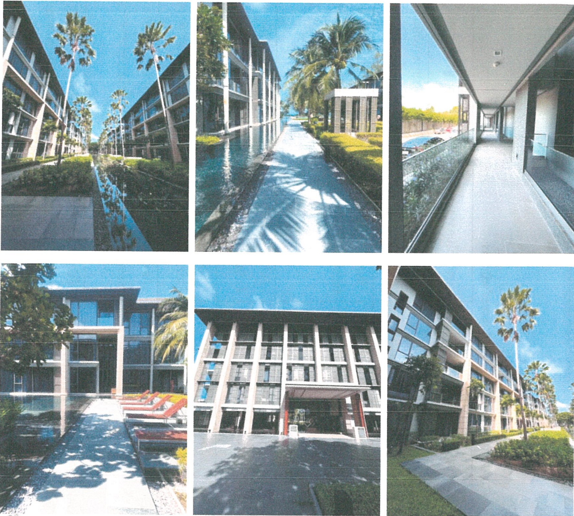
รูปภาพที่ 1.5 การใช้ประโยชน์พื้นที่อาคาร