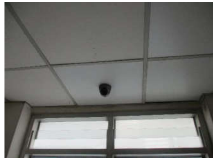
รูปที่ 15 กล้องวงจรปิด