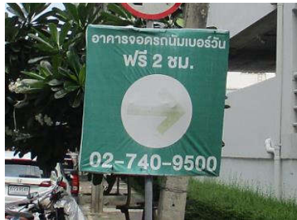
รูปที่ 9 ป้ายที่จอดรถ