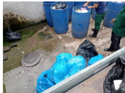
รูปที่ 30 การรวบรวมมูลฝอย