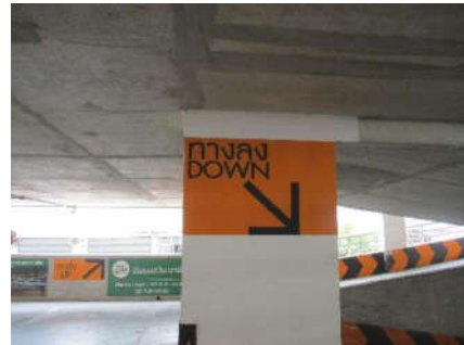
รูปที่ 8 ป้ายแสดงทิศทาง (ต่อ)