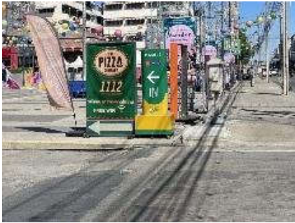
รูปที่ 18 ป้ายทางเข้า