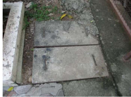
รูปที่ 1 บ่อพักน้ำและระบบบำบัดน้ำเสีย