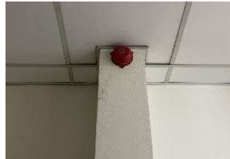
รูปที่ 20 อุปกรณ์แจ้งสัญญาณเหตุเพลิงไหม้