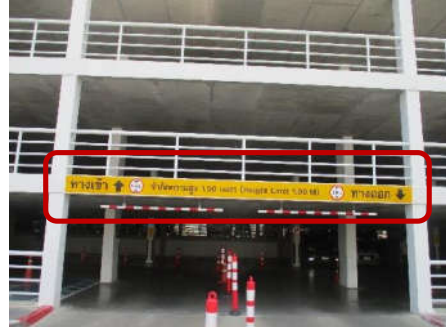
รูปที่ 12 ป้ายจำกัดความสูง 1.90 เมตร