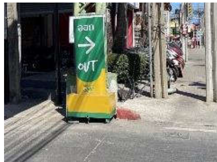
รูปที่ 17 ทางออก