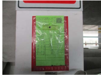
รูปที่ 19 ตรวจสอบสภาพการใช้งานของอุปกรณ์ดับเพลิง