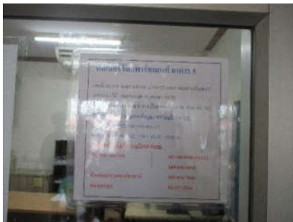
รูปที่ 29 หมายเลขโทรศัพท์ฉุกเฉิน