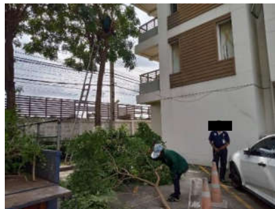
รูปที่ 28 เจ้าหน้าที่คอยตกแต่งดูแลพื้นที่สีเขียว