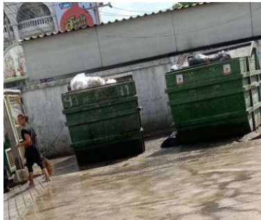
รูปที่ 6 จุดรวบรวม