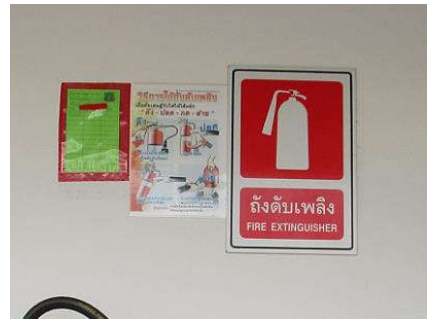
รูปที่ 22 ป้ายแนะนำการใช้อุปกรณ์ดับเพลิง