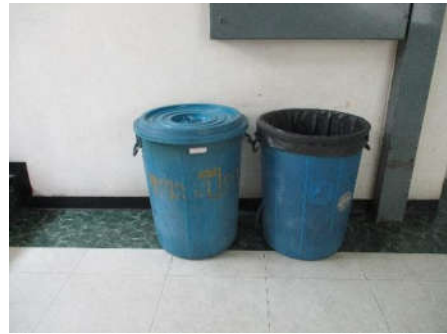
รูปที่ 5 จุดทิ้งมูลฝอย