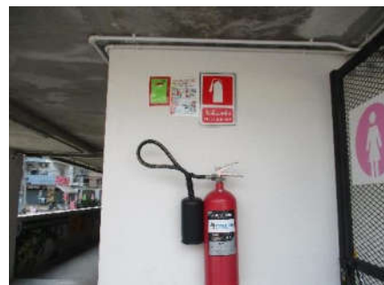
รูปที่ 21 อุปกรณ์ดับเพลิง