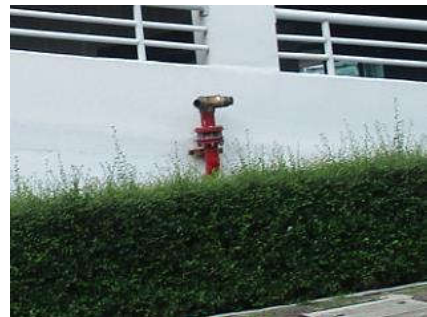
รูปที่ 24 หัวจ่ายน้ำดับเพลิง