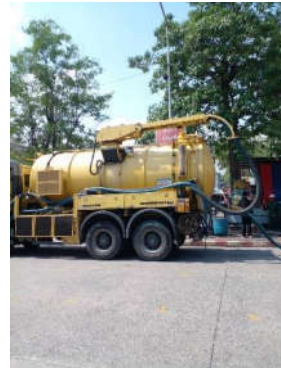
รูปที่ 31 จัดเก็บตะกอนส่วนเกินจากระบบบำบัดน้ำเสีย