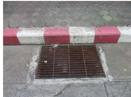
รูปที่ 7 ตะแกรงดักขยะ