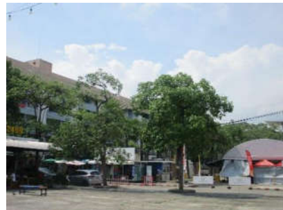
รูปที่ 27 พื้นที่สีเขียว