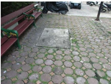
รูปที่ 3 บ่อพักน้ำ