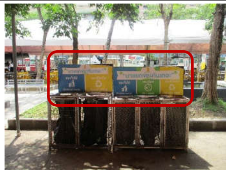
รูปที่ 4 ป้ายรณรงค์คัดแยกมูลฝอย