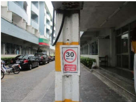
รูปที่ 11 ป้ายควบคุมความเร็ว