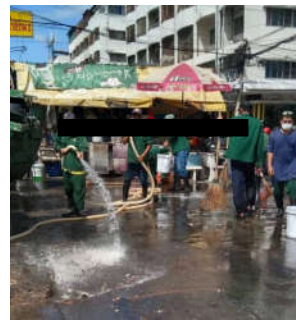
รูปที่ 32 ทำความสะอาดจุดจุดพักมูลฝอย