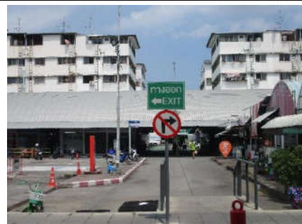
รูปที่ 8 ป้ายแสดงทิศทาง