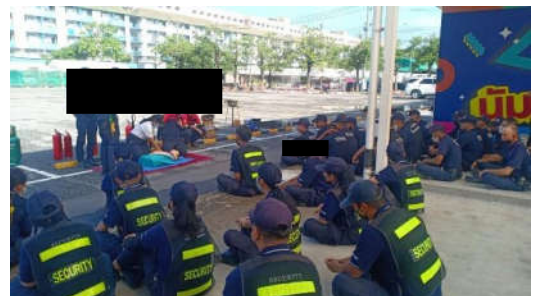
รูปที่ 26 การซ้อมป้องกันอัคคีภัย การดับเพลิง และการหนีไฟ