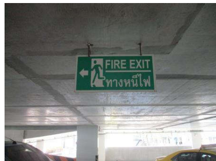
รูปที่ 33 ป้ายบอกทางหนีไฟ