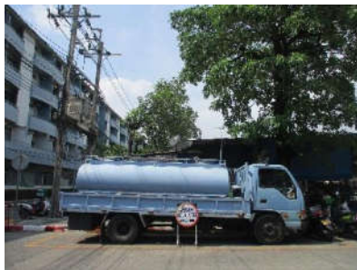
รูปที่ 23 รถน้ำประจำโครงการ