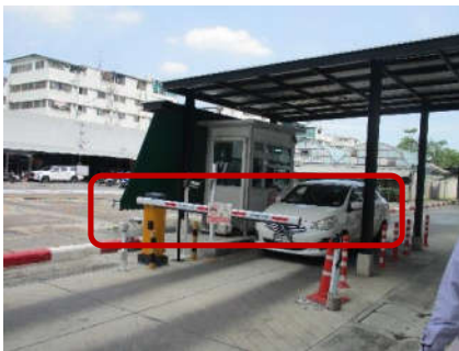
รูปที่ 16 แชนกันรถยนต์