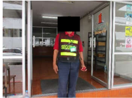
รูปที่ 14 เจ้าหน้าที่รักษาความปลอดภัย (รปภ.)