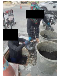
รูปที่ 2 ขุดลอกทางระบายน้ำ