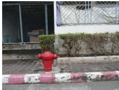
รูปที่ 25 ท่อจ่ายน้ำดับเพลิง