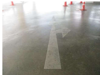
รูปที่ 13 เครื่องหมายพื้นทางบนผิวถนน