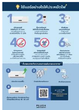
รูปที่ 34 มาตรการอนุรักษ์พลังงาน