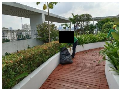
รูปที่ 44 เจ้าหน้าที่ดูแลพื้นที่สีเขียวภายในโครงการ