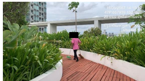
รูปที่ 21 แม่บ้านทำความสะอาด