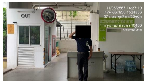
รูปที่ 37 เจ้าหน้าที่รักษาความปลอดภัยบริเวณพื้นที่จอดรถ