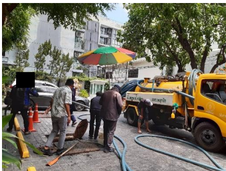
รูปที่ 22 ประสานงานให้รถสูบล้างปฏิทินของ สำนักงานเขตฯ