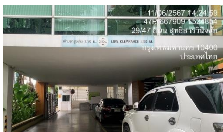
รูปที่ 30 ป้ายแสดงทางเข้า-ออก