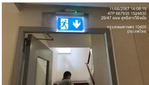
รูปที่ 24 ป้ายทางหนีไฟ