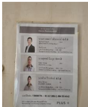
รูปที่ 42 เจ้าหน้าที่ที่มีความชำนาญเพื่อควบคุมดูแล การทำงานของระบบบำบัดน้ำเสีย