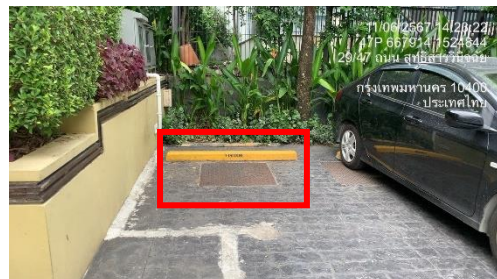
รูปที่ 23 ป่อท่อน้ำ