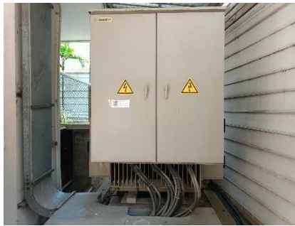
รูปที่ 26 เครื่องกำเนิดไฟฟ้า