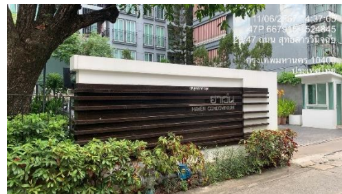
รูปที่ 29 ป้ายแสดงที่ตั้งโครงการ