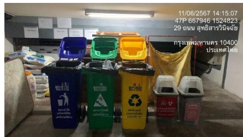
รูปที่ 19 ภาชนะรองรับมูลฝอย