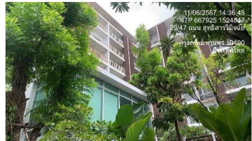
รูปที่ 5 การออกแบบอาคารของโครงการให้เป็นไปตามกฎหมายและข้อกำหนดที่เกี่ยวข้อง