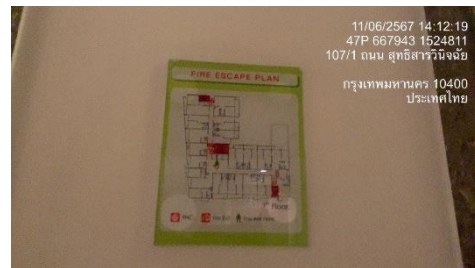
รูปที่ 41 แผนฉุกเฉินหรือแผนอพยพผู้คน กรณีเกิดเพลิง