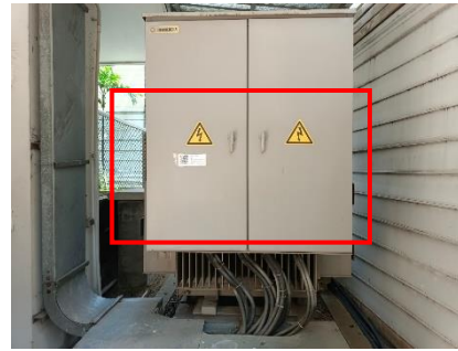
รูปที่ 27 ป้ายเตือนระวางอันตรายจากไฟฟ้าบริเวณ พื้นที่เครื่องกำเนิดไฟฟ้า