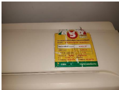
รูปที่ 18 เครื่องใช้ไฟฟ้าแบบประหยัดพลังงาน