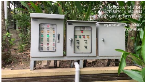
รูปที่ 38 ตู้ควบคุมที่ระบบบำบัดน้ำเสีย