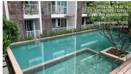
รูปที่ 39 สระว่ายน้ำ