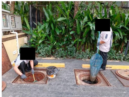
รูปที่ 36 ระบบบำบัดน้ำเสีย