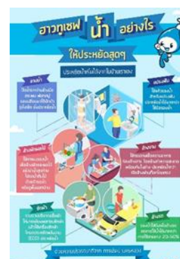
รูปที่ 31 การประชาสัมพันธ์ประหยัดน้ำ