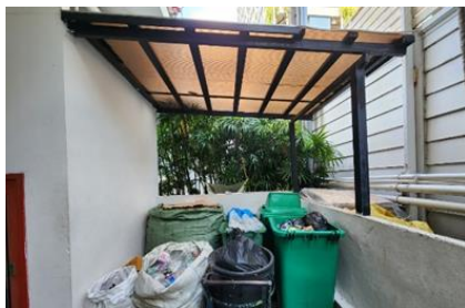
รูปที่ 20 พื้นที่พักมูลฝอยรวม