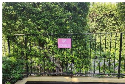
รูปที่ 25 จุดรวมพล