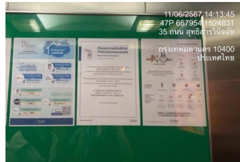
รูปที่ 33 ประชาสัมพันธ์มาตรการประหยัดไฟฟ้า