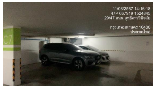
รูปที่ 43 ระบบการจราจรภายในโครงการที่ เหมาะสม