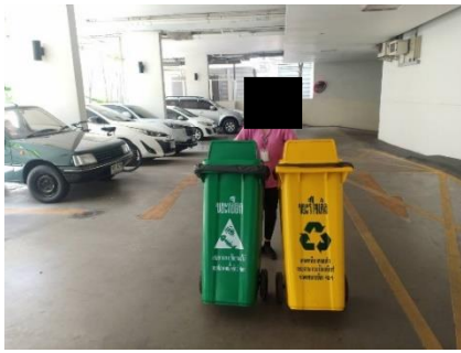
รูปที่ 32 พนักงานจัดเก็บมูลฝอย