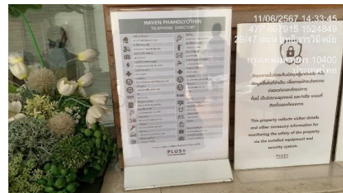
รูปที่ 35 ป้ายเบอร์โทรศัพท์ต่อรถสาธารณะ