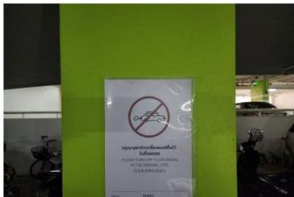
รูปที่ 28 ป้ายเตือน “ห้ามติดตั้งเครื่องขณะจอดรถ”