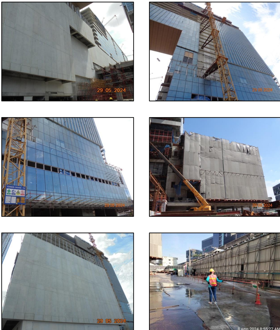
รูปที่ 1.3-1 สภาพปัจจุบันของโครงการ

ในช่วงก่อสร้าง โครงการได้ใบรับแจ้งการก่อสร้าง คัดแปลง รื้อถอนอาคาร ตามมาตรา 39 ตริ (แบบ ขพ.4) ดังแสดงในภาคผนวก ก และภาคผนวก ข รูปที่ 1 เรียบร้อยแล้ว ซึ่งปัจจุบันโครงการ ได้ดำเนินการก่อสร้างไปแล้ว 67.89 % ดังแสดงในรูปที่ 1.3-1