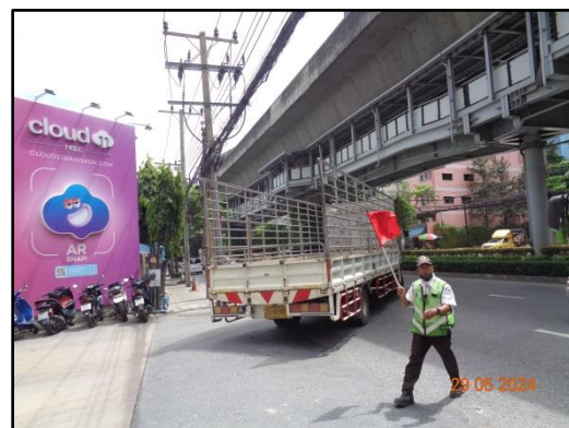
รูปที่ 1.3-1 สภาพปัจจุบันของโครงการ