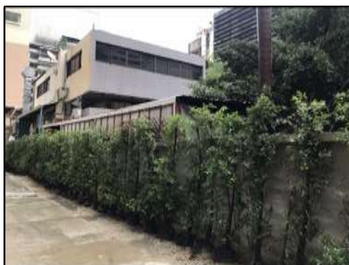
ภาพที่ 1.6-1 สถานภาพการก่อสร้างโครงการในปัจจุบัน