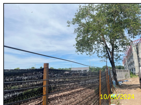
ทิศตะวันตก