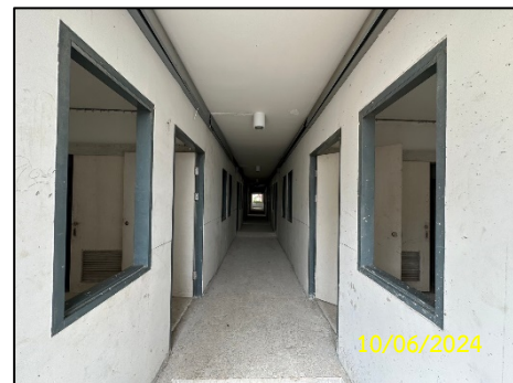
ภาพที่ 1-2 สภาพปัจจุบันของโครงการ