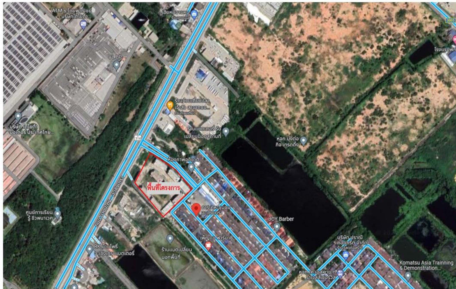
รูปที่ 1-1 แผนที่ตั้งโครงการโดยสังเขปและเส้นทางเดินทางเข้า-ออกพื้นที่โครงการ