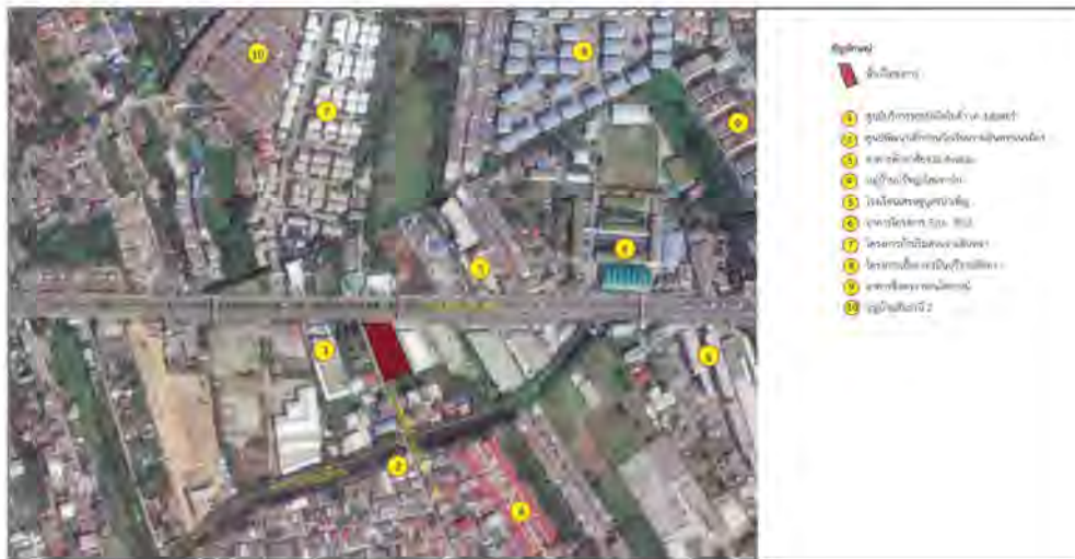
ภาพที่ 1-1 ที่ตั้งของโครงการ