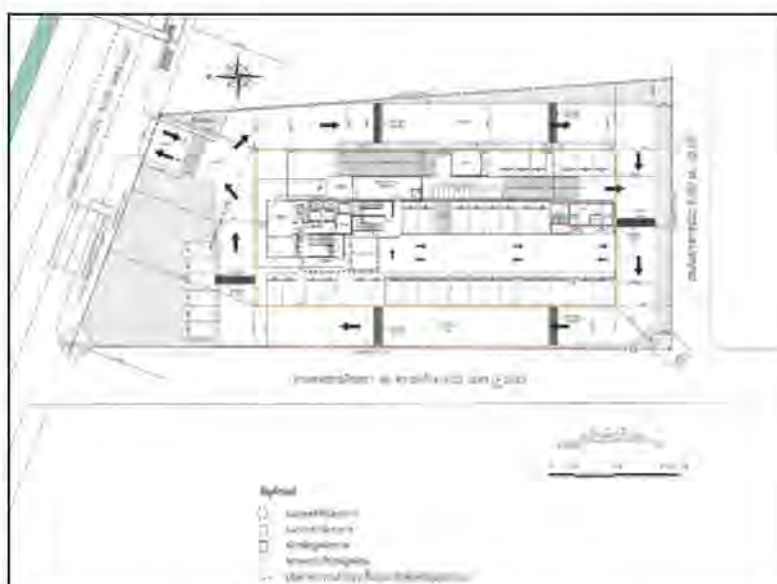
ภาพที่ 1-4 การจัดเก็บมูลฝอยในโครงการ

(4) มูลฝอยอันตราย (เช่น หลอดไฟ ถ่านไฟฉาย แบตเตอรี่ ขวดยา กระป๋องยาฆ่าแมลง เป็นต้น) ให้พนักงานนำมูลฝอยอันตรายที่บรรจุในถุงสีส้มมารวมไว้ในห้องพักมูลฝอยอันตราย ซึ่งโครงการจะประสานให้รถเก็บขนมูลฝอยของสำนักงานเขตมีนบุรีมารับไปกำจัดทุก 15 วัน