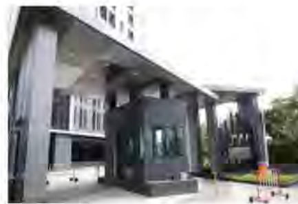
ภาพที่ 1-2 สภาพโครงการในปัจจุบัน