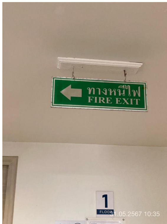
ภาพที่ 2 แสดงป้ายทางหนีไฟ