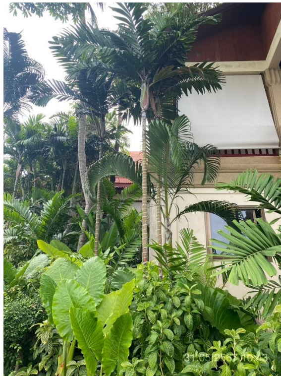
ภาพที่ 24 แสดงต้นไม้ทางทิศตะวันตก (บริเวณอาคาร Lobby)