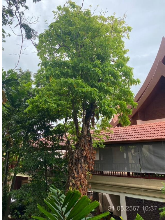
ภาพที่ 19 แสดงต้นไม้ทางทิศตะวันตก (บริเวณรอบกัศดาการ)