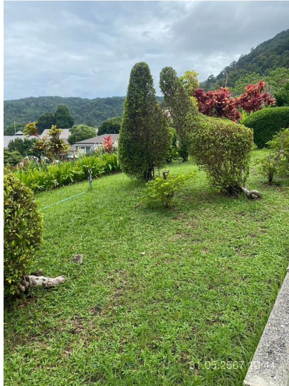
ภาพที่ 29 แสดงไม้เลื้อยคลุมประดับ