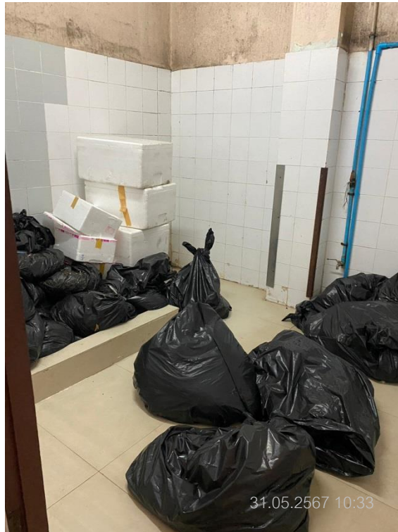
ภาพที่ 9 แสดงภายในห้องพักขยะเปียก