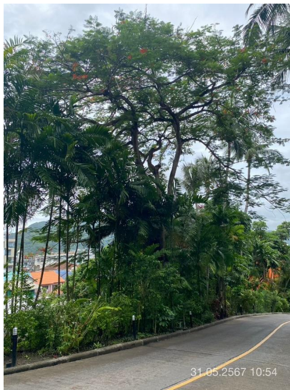
ภาพที่ 10 แสดงต้นไม้ทางทิศใต้