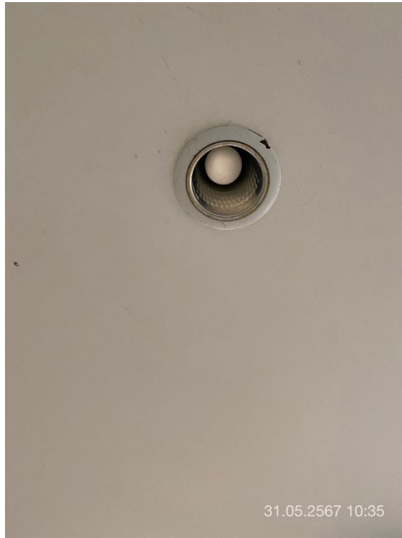
ภาพที่ 35 แสดงหลอดไฟชนิดประหยัดพลังงาน LED