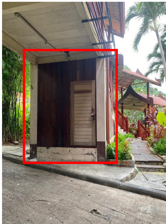
ภาพที่ 36 แสดงห้องพักพวกใบไม้เศษใบไม้