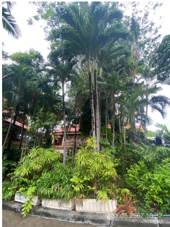
ภาพที่ 20 แสดงต้นไม้ทางทิศตะวันตก (บริเวณรอบกัศดาการ)