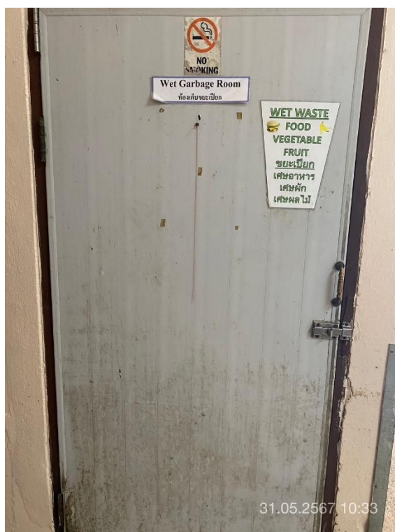
ภาพที่ 8 แสดงห้องพักขยะเปียก