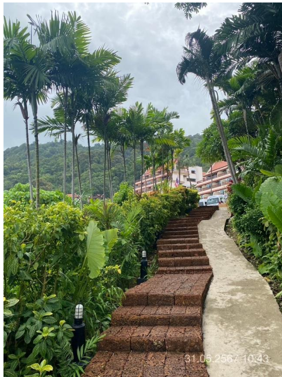
ภาพที่ 26 แสดงต้นไม้ทางทิศตะวันตก (บริเวณอาคาร Lobby)