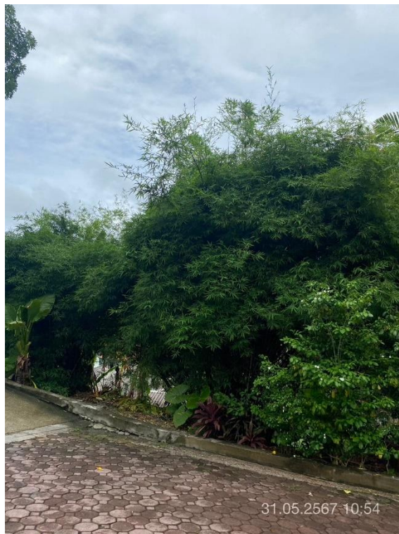
ภาพที่ 12 แสดงต้นไม้ทางทิศตะวันออก