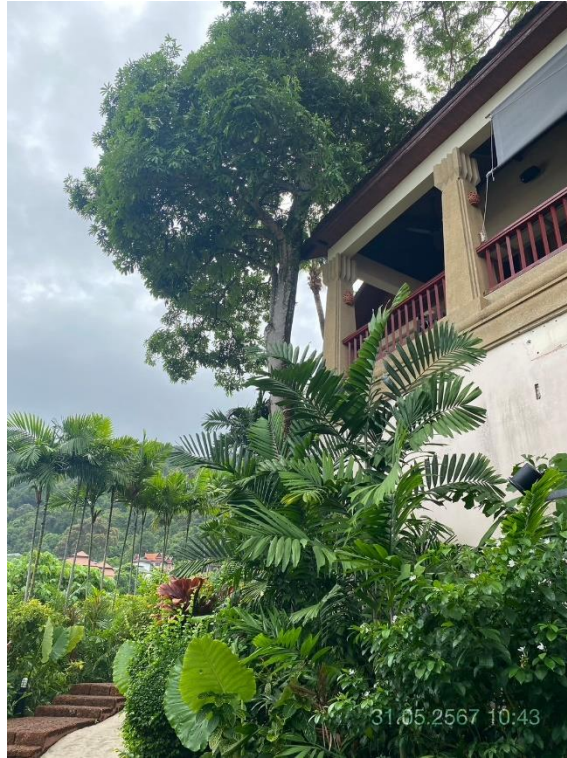
ภาพที่ 25 แสดงต้นไม้ทางทิศตะวันตก (บริเวณอาคาร Lobby)