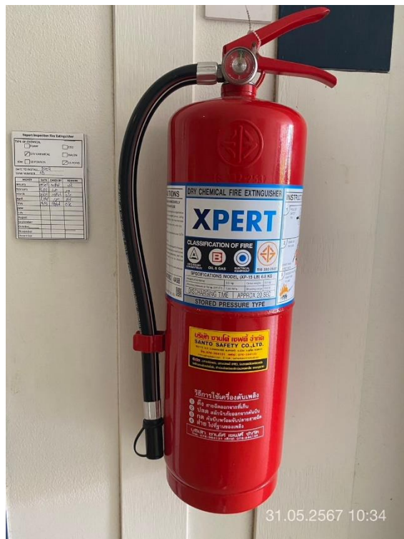
ภาพที่ 3 แสดงถังดับเพลิง