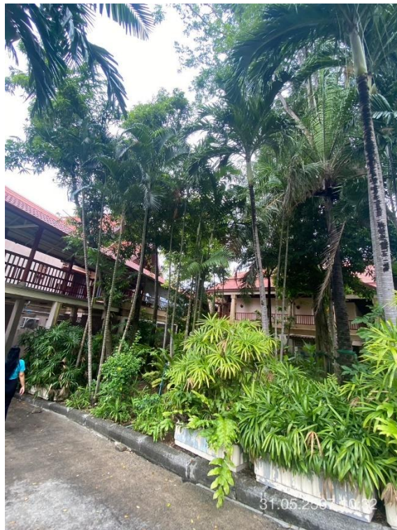
ภาพที่ 21 แสดงต้นไม้ทางทิศตะวันตก (บริเวณรอบภัตตาคาร)