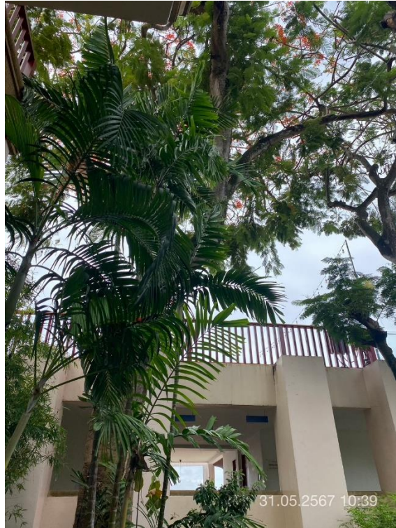
ภาพที่ 13 แสดงต้นไม้ทางทิศตะวันตก (บริเวณอาคาร A และ B)