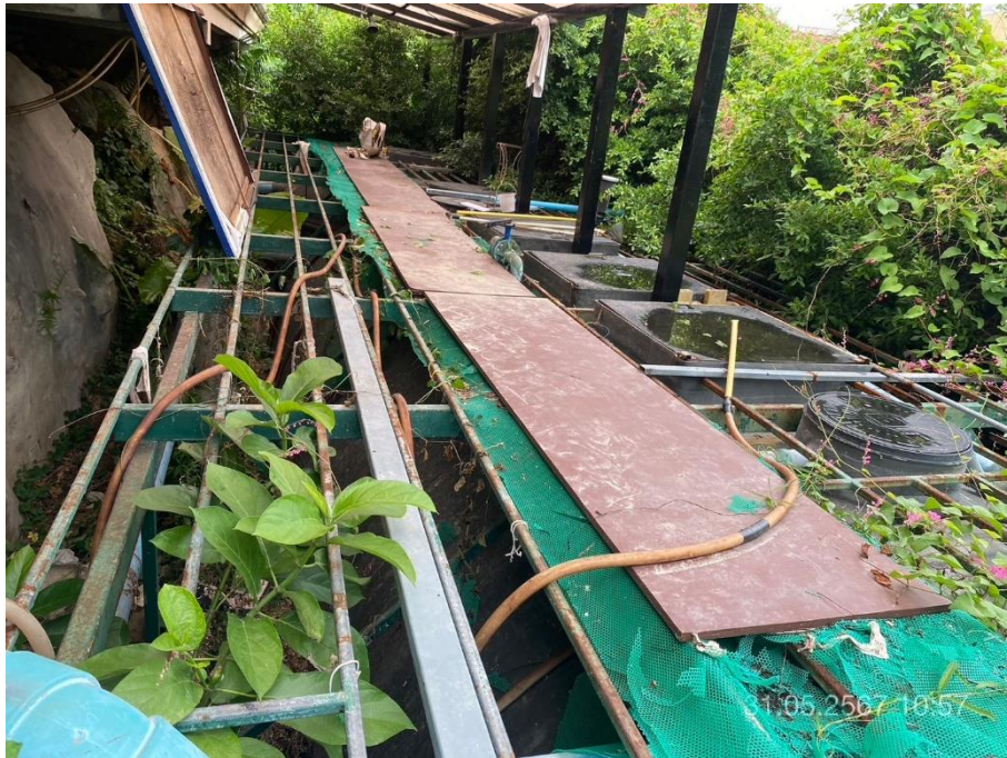
ภาพที่ 31 แสดงระบบบำบัดน้ำเสียของโครงการ 80 ลบ.ม.