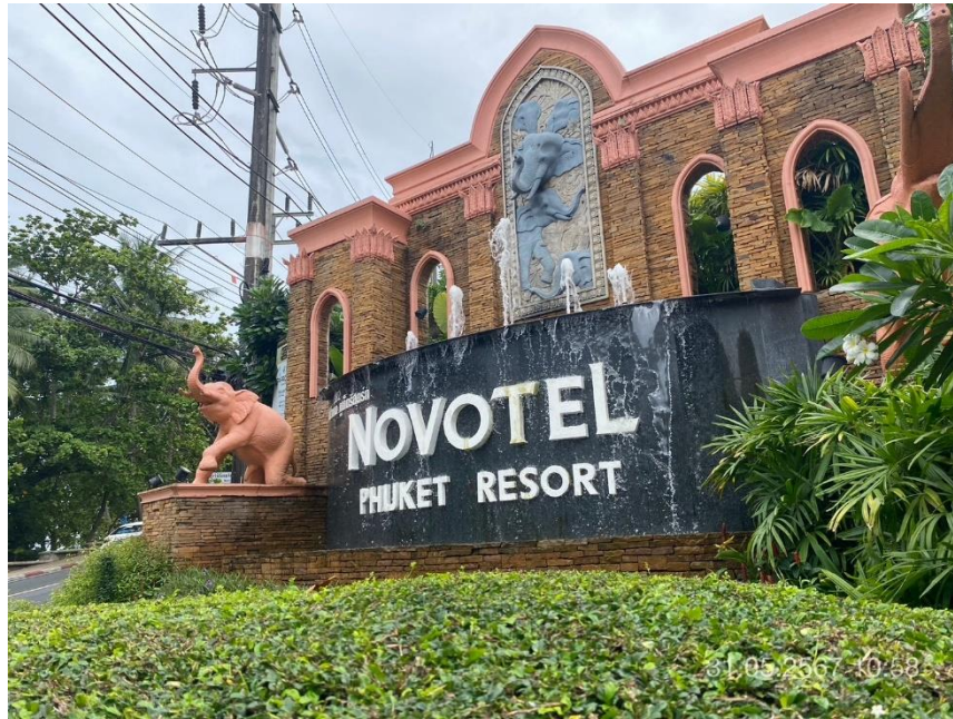
ภาพที่ 1 แสดงป้ายชื่อโครงการ