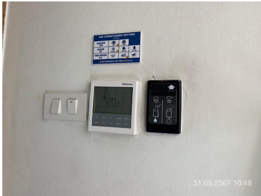
ภาพที่ 33 แสดงระบบควบคุมเครื่องปรับอากาศด้วย Key Card