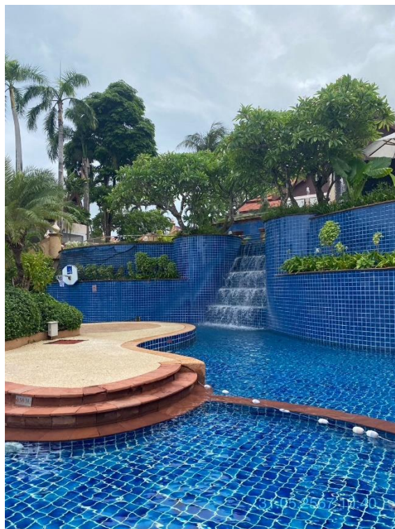
ภาพที่ 18 แสดงต้นไม้ทางทิศตะวันตก (บริเวณรอบสระว่ายน้ำ)