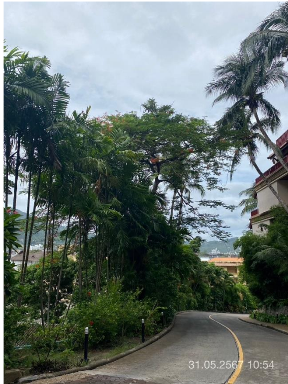
ภาพที่ 11 แสดงต้นไม้ทางทิศใต้