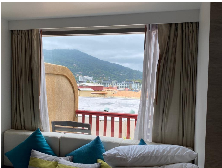
ภาพที่ 38 แสดงหน้าต่างและม่านกันแสงภายในห้องพัก