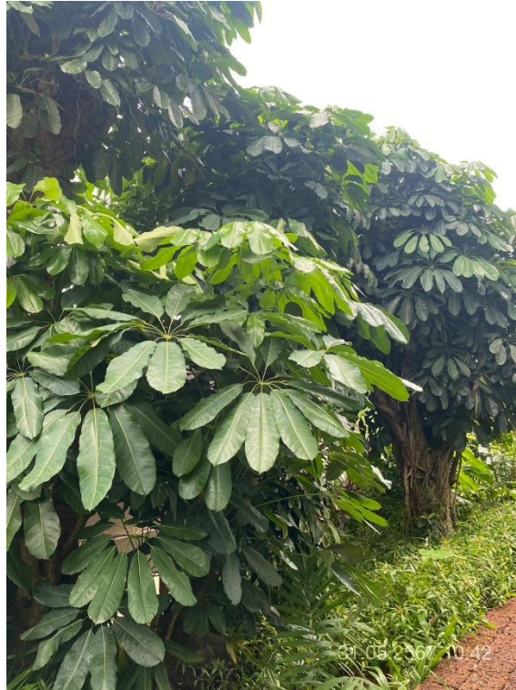
ภาพที่ 23 แสดงต้นไม้ทางทิศตะวันตก (บริเวณอาคาร C และ D)