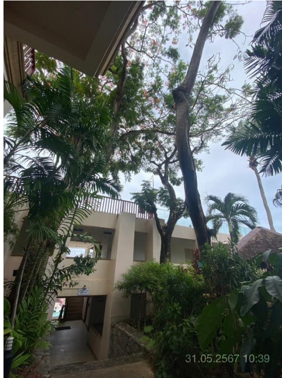
ภาพที่ 15 แสดงต้นไม้ทางทิศตะวันตก (บริเวณอาคาร A และ B)