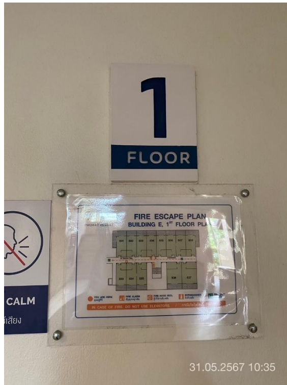
ภาพที่ 5 แสดงผังทางหนีไฟ