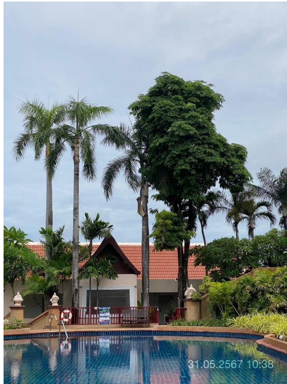
ภาพที่ 17 แสดงต้นไม้ทางทิศตะวันตก (บริเวณรอบสระว่ายน้ำ)