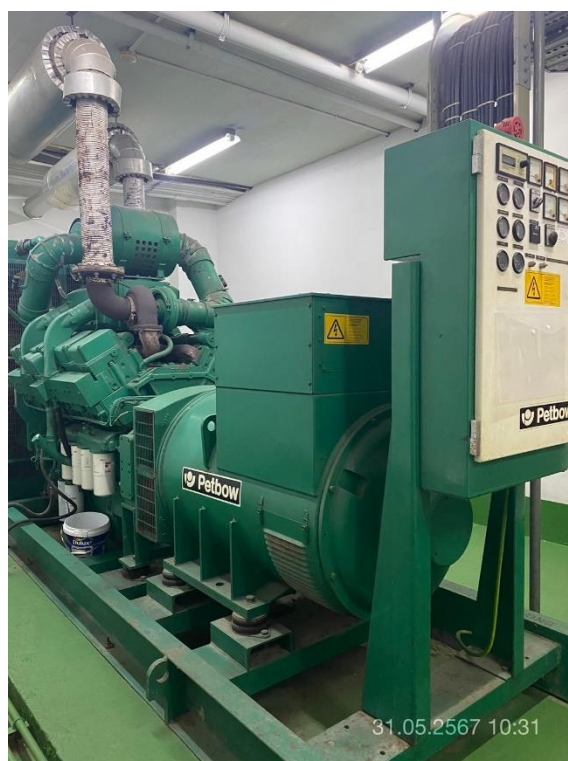
ภาพที่ 32 แสดงเครื่องกำเนิดไฟฟ้า