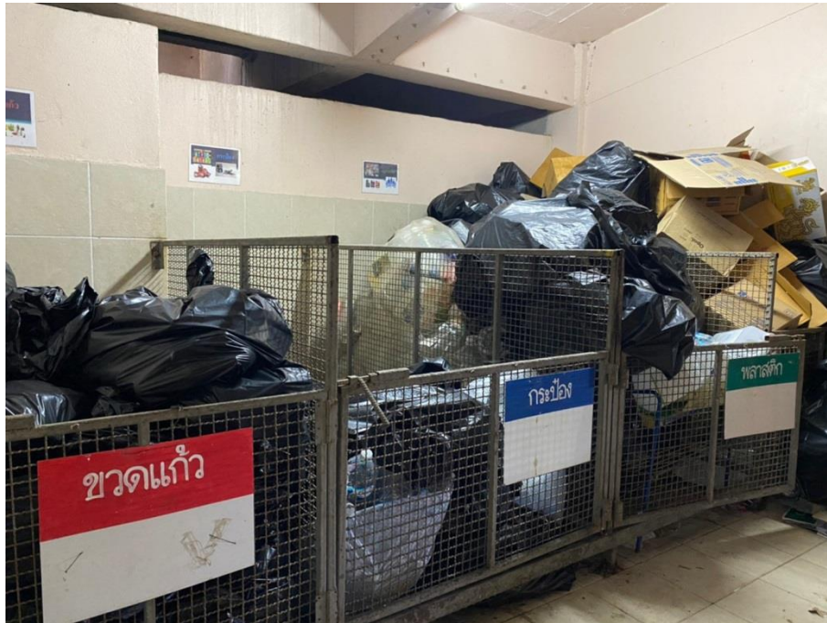
ภาพที่ 37 แสดงห้องพักขยะรีไซเคิล