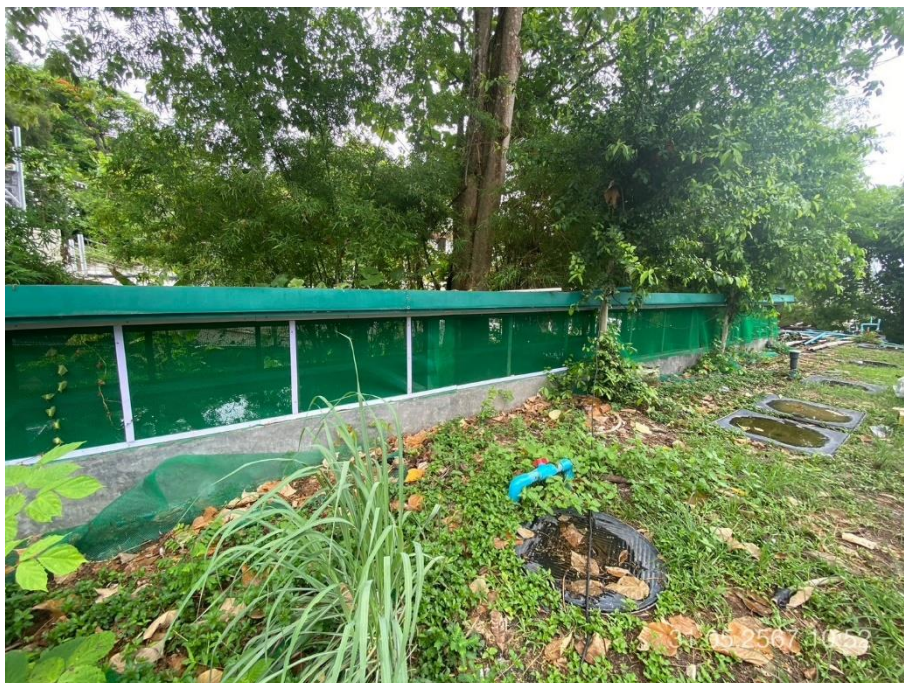
ภาพที่ 30 แสดงระบบบำบัดน้ำเสียของโครงการ 150 ลบ.ม.