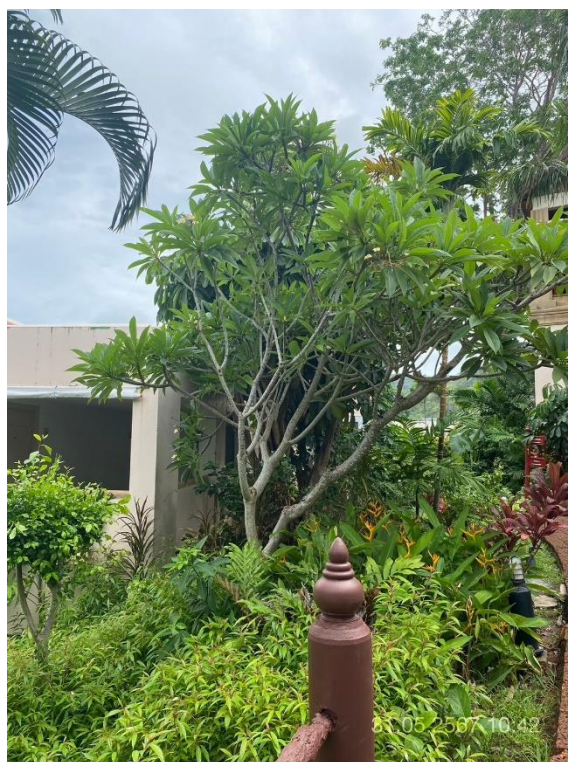
ภาพที่ 22 แสดงต้นไม้ทางทิศตะวันตก (บริเวณอาคาร C และ D)