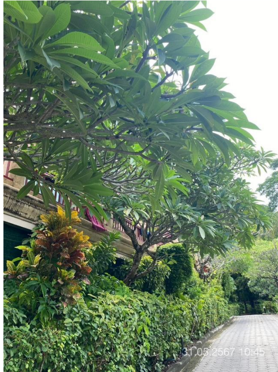
ภาพที่ 27 แสดงต้นไม้ทางทิศตะวันตก (บริเวณรอบอาคาร H และ I)