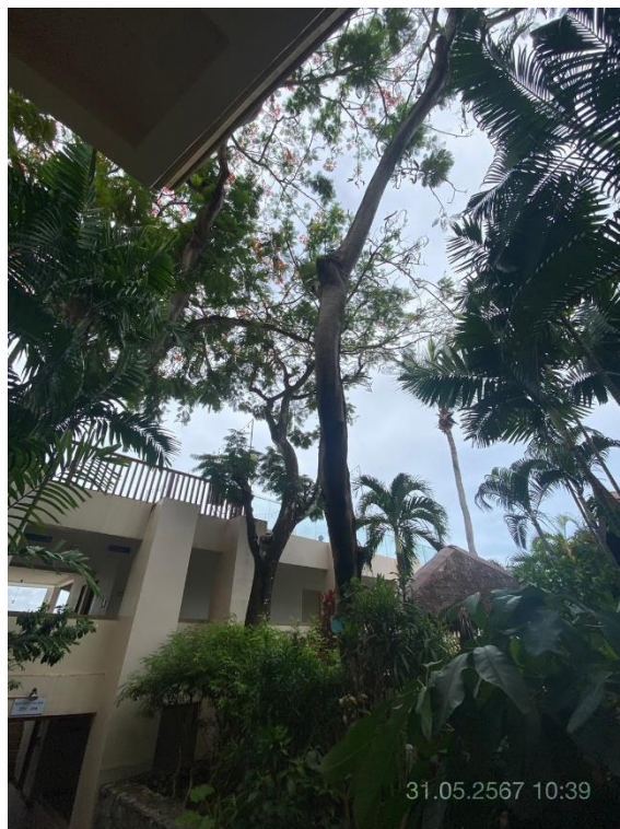
ภาพที่ 14 แสดงต้นไม้ทางทิศตะวันตก (บริเวณอาคาร A และ B)