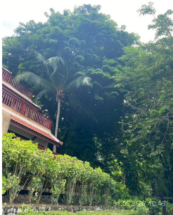
ภาพที่ 28 แสดงต้นไม้ทางทิศตะวันตก (บริเวณรอบอาคาร H และ I)