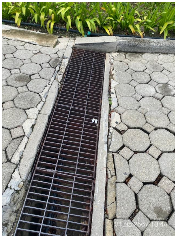
ภาพที่ 6 แสดงรางระบายน้ำภายนอกอาคารและตะแกรงดักขยะ