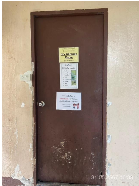
ภาพที่ 7 แสดงห้องพักขยะแห้ง