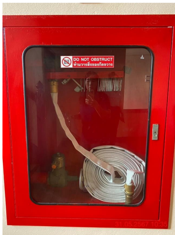
ภาพที่ 34 แสดงตู้เก็บสายน้ำดับเพลิง