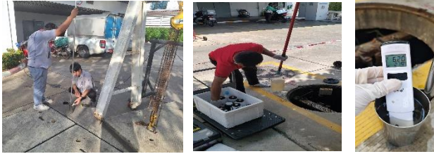
เก็บวิเคราะห์ตัวอย่างน้ำเสียโดยเจ้าหน้าที่ โรงพยาบาลและหน่วยงานภายนอก