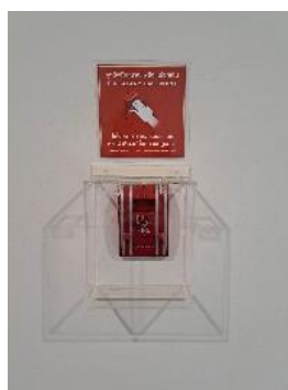
สัญญาณแจ้งเหตุเพลิงไหม้