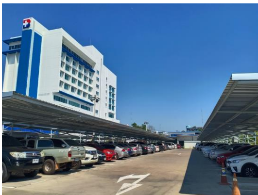
ลานจอดรถยนต์