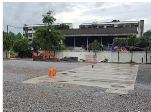
บ่อหนองน้ำ