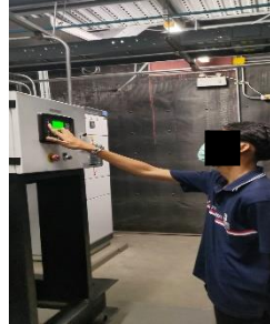
MNเครื่องกำเนิดไฟฟ้าสำรอง