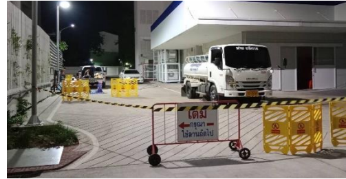
ขุดลอกท่อระบายน้ำภายในโรงพยาบาล และถนนรอบนอก ร่วมกับเทศบาลเมืองจันทบุรี