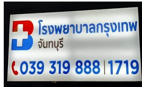
ป้ายโรงพยาบาลกรุงเทพจันทบุรี