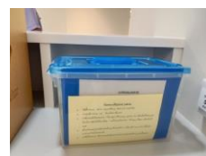
อบรม /ประชาสัมพันธ์การจัดเก็บสารเคมีและวิธีการปฐมพยาบาลที่ถูกต้อง