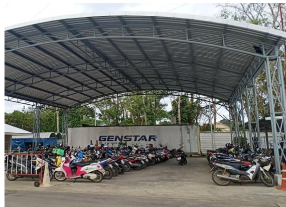
ลานจอดรถจักรยานยนต์