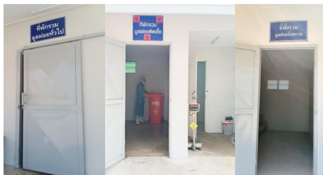
ห้องพักขยะ