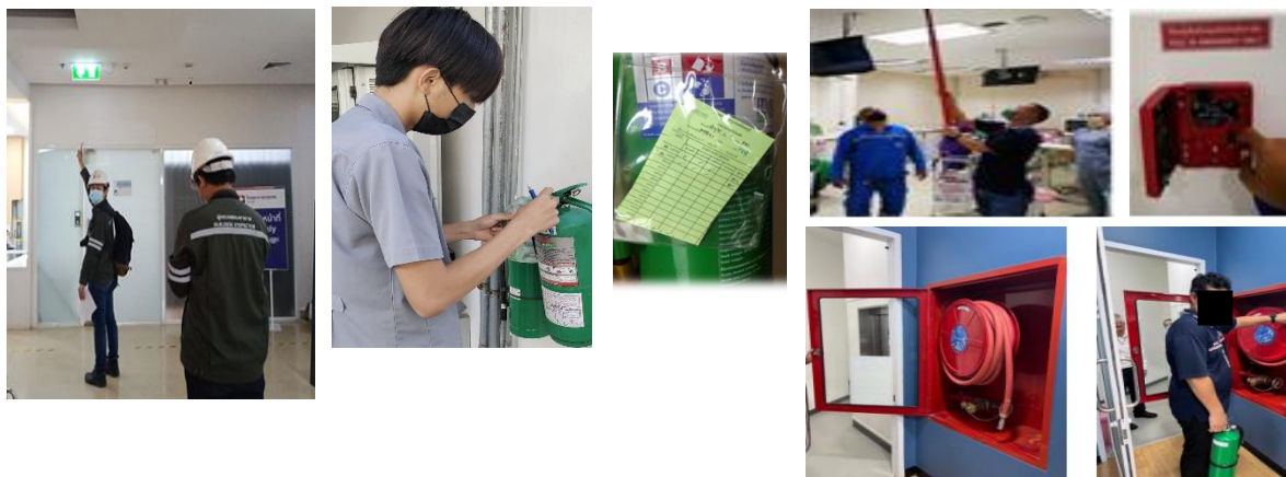
ตรวจสอบป้ายทางหนีไฟ / บำรุงรักษาอุปกรณ์-สัญญาณแจ้งเหตุเพลิงไหม้