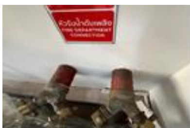
หัวรับน้ำดับเพลิง