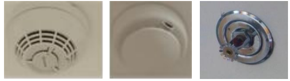
เครื่องตรวจจับควัน / ความร้อน และหัวกระจายน้ำดับเพลิง