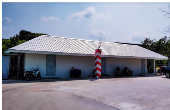
โรงพักขยะ

สื่อสารประชาสัมพันธ์การคัดแยกขยะในโรงพยาบาล