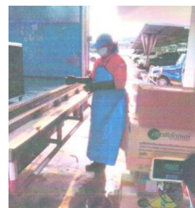
การขนส่งขยะอันตราย