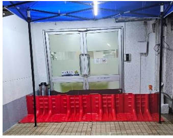
จัดเตรียมอุปกรณ์ป้องกันน้ำท่วม และทีมเจ้าหน้าที่ดูแลรับผิดชอบ