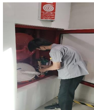
ตู้เก็บสายน้ำดับเพลิง