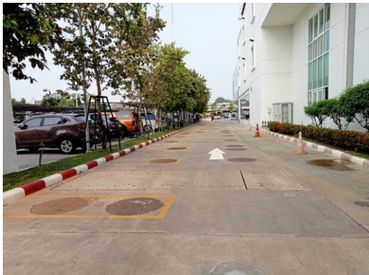
บ่อบำบัดน้ำเสีย