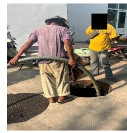
ดูแล ตรวจสอบระบบบำบัดน้ำเสีย โดยตัดไขมัน และสับกากตะกอนจากบ่อบำบัดน้ำเสียเป็นประจำสม่ำเสมอ