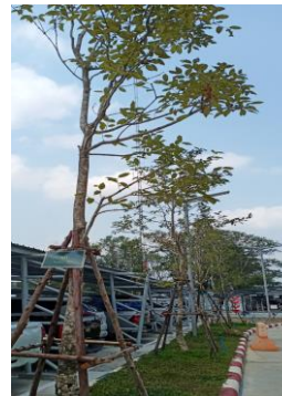
ตรวจสอบดูแลพื้นที่สีเขียวให้อยู่ในสภาพที่ดีอยู่เสมอ