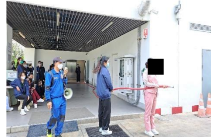
จัดอบรมและฝึกซ้อมการป้องกันอัคคีภัยของโรงพยาบาลประจำปี