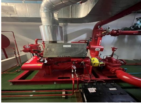
เครื่องปั้มน้ำสำรองดับเพลิง