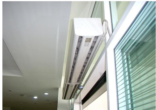
ม่านตัดอากาศ