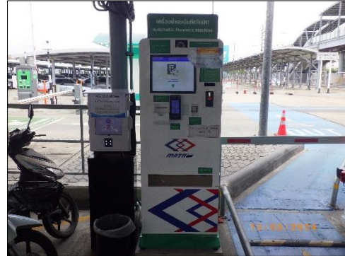
ตู้จ่ายบัตรจอดรถ (Ticket Booth) (ต่อ)