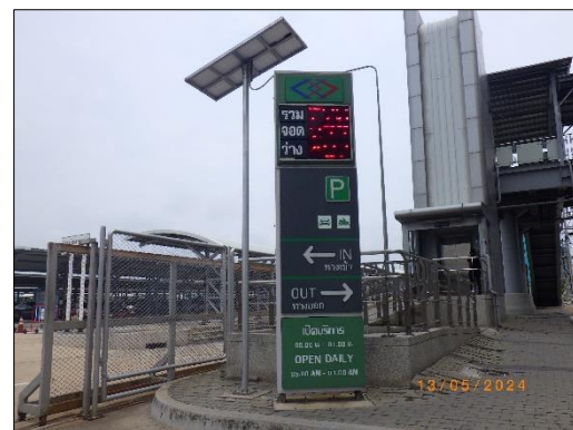
รูปที่ 1-3 ลานจอดรถของโครงการ