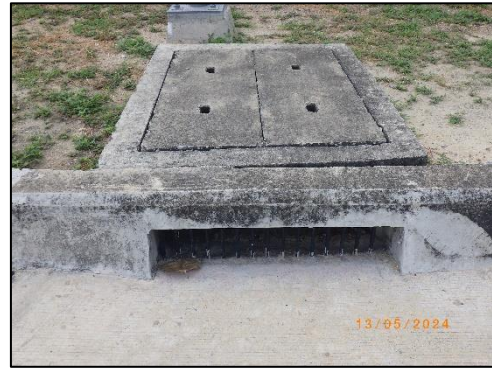
ระบบระบายน้ำรอบลานจอดรถ