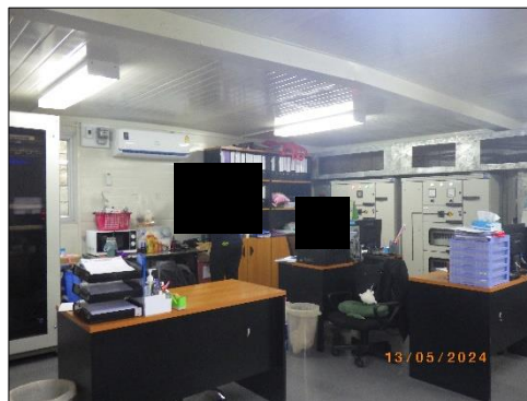
สำนักงาน Mobile Office Container และสำนักงาน Mobile Rescue Office Container