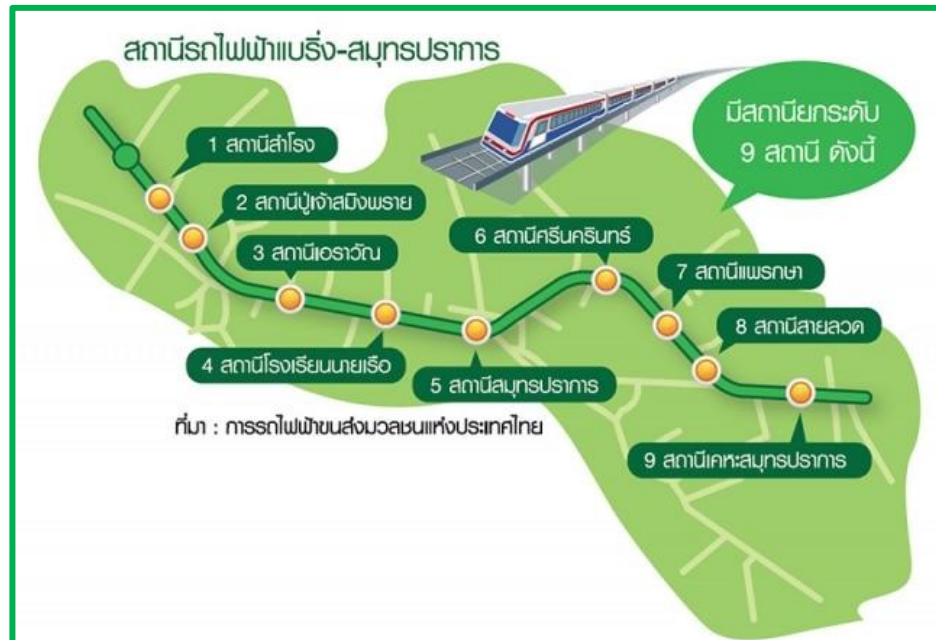
รูปที่ 1-1 สถานีรถไฟฟ้าสายสีเขียว ช่วงแบริ่ง-สมุทรปราการ

พื้นที่โครงการรถไฟฟ้าสายสีเขียว ช่วงแบริ่ง-สมุทรปราการ จะต่อจากแนวโครงการระบบขนส่งมวลชนกรุงเทพมหานคร สายสุขุมวิทช่วงอ่อนนุช-แบริ่ง พื้นที่โครงการอยู่ในพื้นที่ของจังหวัดสมุทรปราการ มีสถานีรถไฟฟ้ายกระดับ จำนวน 9 สถานี ได้แก่ สถานีสำโรง สถานีปู่เจ้าสมิงพราย สถานีอโศก สถานีโรงเรียนนายเรือ สถานีสมุทรปราการ สถานีศรีนครินทร์ สถานีแพรกษา สถานีสายลวด และสถานีเคหะสมุทรปราการ รวมทั้งมีลานจอดรถ จำนวน 1 แห่ง บริเวณสถานีเคหะสมุทรปราการ