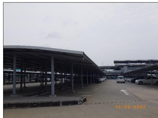
บริเวณพื้นที่จอดรถยนต์