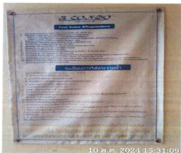
ภาคผนวกที่ 3.39 บ้ายแสดงกฎข้อปฏิบัติสำหรับผู้ใช้ สระว่ายน้ำ