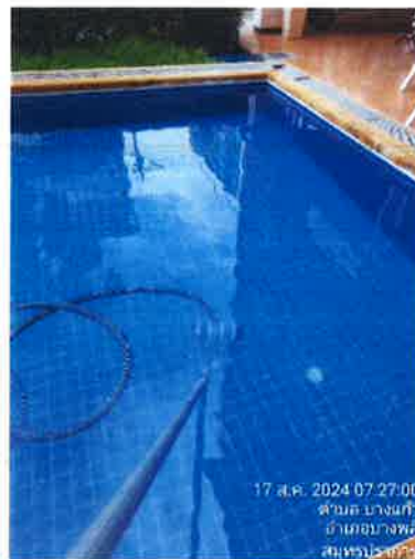
ภาคผนวกที่ 3.42 จัดให้มีเจ้าหน้าที่ตรวจสอบระบบและทำความสะอาดสระว่ายน้ำ