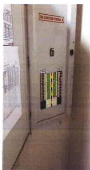
ภาคผนวกที่ 3.47 จัดให้มีการซ่อมบำรุงรักษา อุปกรณ์ ไฟฟ้า