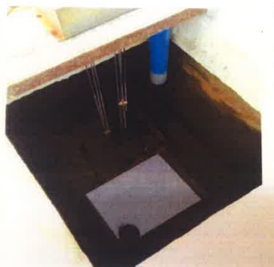
ภาคผนวกที่ 3.44 ตรวจสอบปริมาณตะกอนในถัง