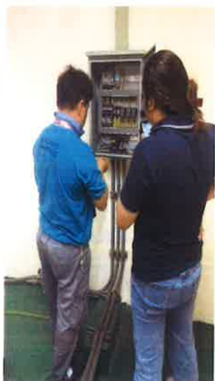
ภาคผนวกที่ 3.43 ซ่อมบำรุงรักษาเครื่องสูบน้ำเป็นประจำ