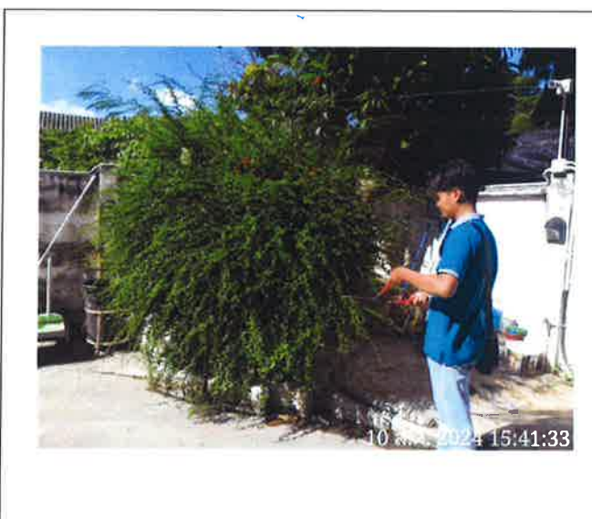
ภาคผนวกที่ 3.3 งานดูแลพื้นที่สีเขียวภายในโครงการ