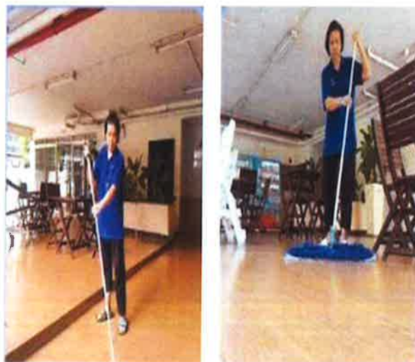
ภาคผนวกที่ 3.40 จัดให้มีพนักงานทำความสะอาด บริเวณสระว่ายน้ำเป็นประจำ