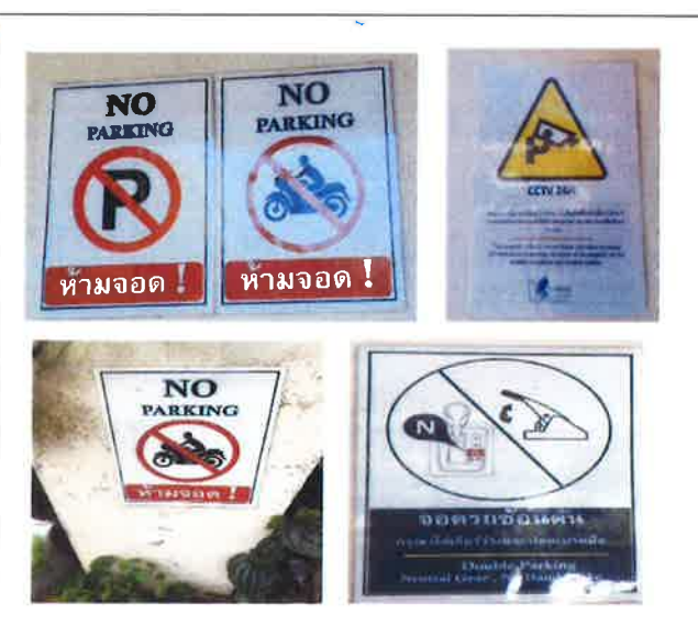
ภาคผนวกที่ 3.4 งานป้ายสัญลักษณ์ต่างๆ