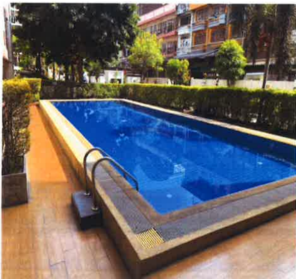
ภาคผนวกที่ 3.11 ตรวจสอบสภาพสระว่ายน้ำ