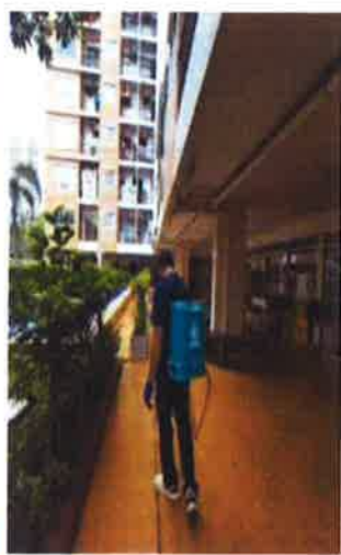
ภาคผนวกที่ 3.45 จัดให้มีพนักงานจัดเก็บขยะมูลฝอย และกำจัดแมลง