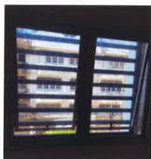
ภาคผนวกที่ 3.53 ตรวจสอบสภาพช่องระบายอากาศ ต่างๆภายในโครงการ