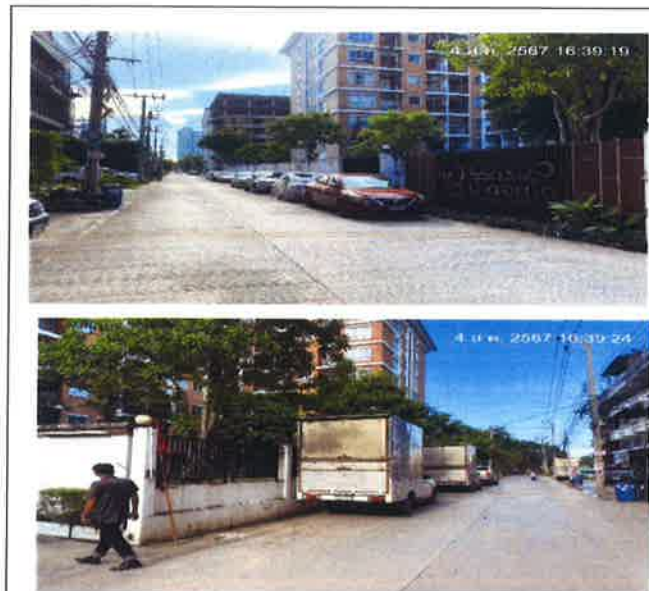
ภาคผนวกที่ 3.1 สภาพรั้วบริเวณโครงการ