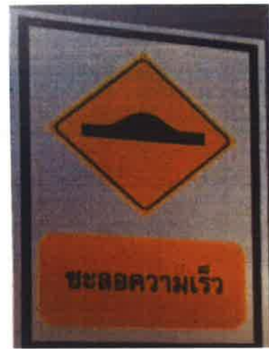
ภาคผนวกที่ 3.6 ป้ายจำกัดความเร็ว