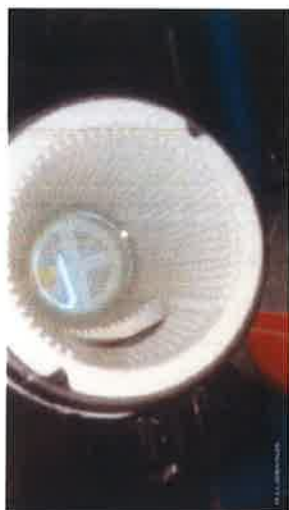
ภาคผนวกที่ 3.41 จัดให้มีเจ้าหน้าที่ตรวจสอบระบบและทำความสะอาดกรองสระว่ายน้ำ