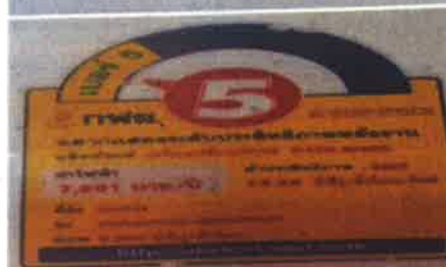
ภาคผนวกที่ 3.18 ตรวจสอบเครื่องหมายแสดงประสิทธิภาพการ ประหยัดพลังงาน