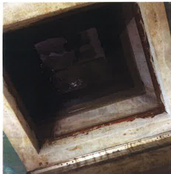
ภาคผนวกที่ 3.8 ตรวจสอบความสะอาดถังเก็บน้ำใช้