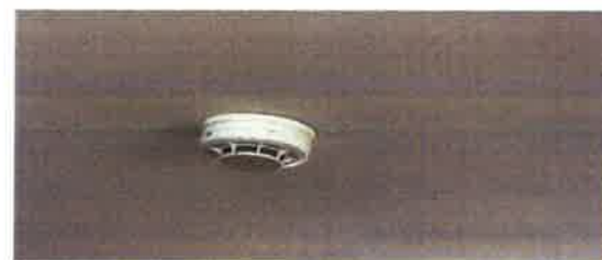
ภาคผนวกที่ 3.48 จัดให้มีการซ่อมบำรุงรักษา อุปกรณ์ป้องกันและสัญญาณเตือนอัคคีภัย