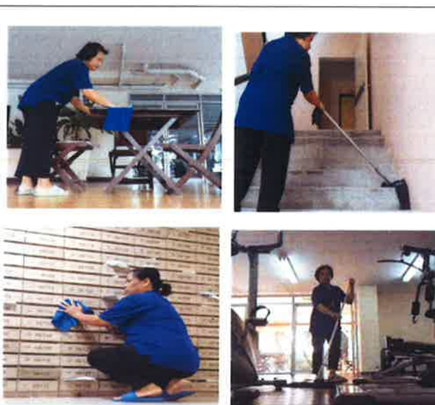
ภาคผนวกที่ 3.2 งานทำความสะอาดภายในโครงการ