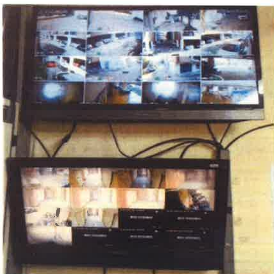
ภาคผนวกที่ 3.56 ตรวจสอบการทำงานของ ระบบ CCVT