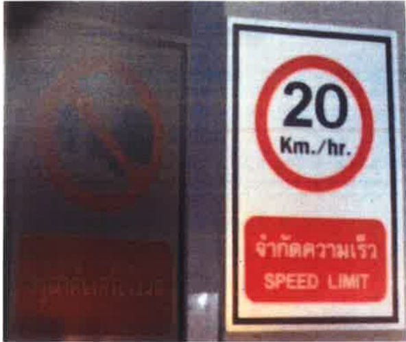
ภาคผนวกที่ 3.5 ป้ายห้ามติดเครื่องยนต์ ป้ายจำกัดความเร็ว