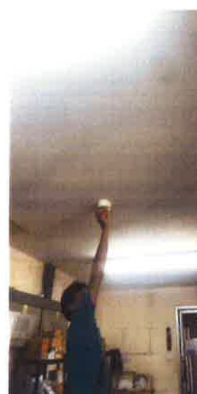
ภาคผนวกที่ 3.20 ตรวจสอบสภาพอุปกรณ์ระบบสัญญาณเตือนอัคคีภัย