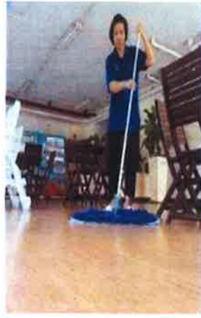
ภาคผนวกที่ 3.9 ทำความสะอาดบริเวณทางเดินสระ ว่ายน้ำ