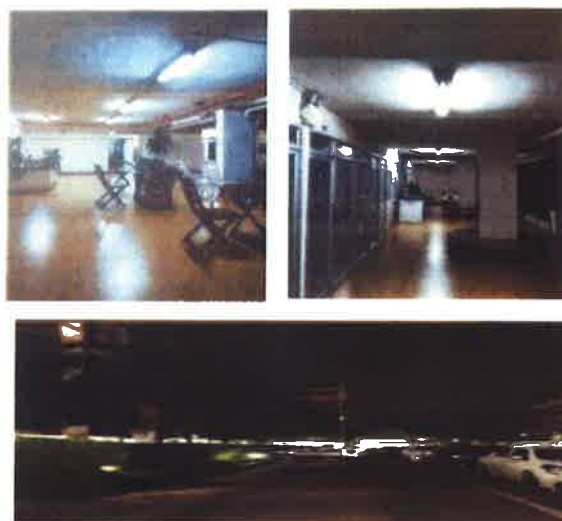
ภาคผนวกที่ 3.38 ตรวจสอบระบบไฟส่องสว่าง ภายในอาคาร