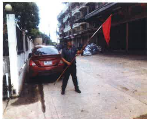
ภาคผนวกที่ 3.54 จัดให้มีพนักงานรักษาความ ปลอดภัยคอยอำนวยความสะดวกการจราจรทั้ง ภายในและด้านหน้าโครงการ