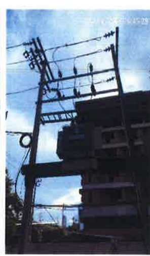
ภาคผนวกที่ 3.46 จัดให้มีพนักงานคอยตรวจสอบ บริเวณที่ติดตั้งหม้อแปลง