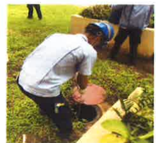
ภาคผนวกที่ 3.12 ตรวจสอบคุณภาพน้ำ