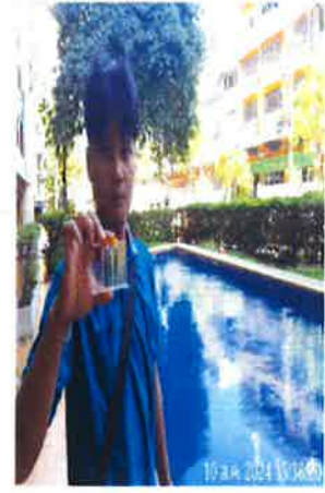
ภาคผนวกที่ 3.10 การตรวจสอบวัดค่าความเป็นกรด ด่าง (PH) และปริมาณคลอรีน