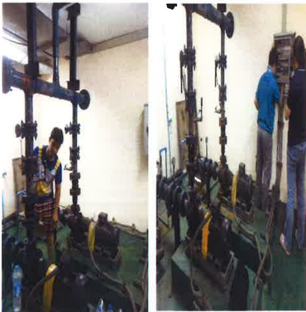
ภาคผนวกที่ 3.7 ตรวจสอบเครื่องสูบน้ำและวาล์วต่าง ๆ