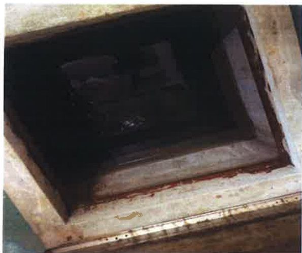
ภาคผนวกที่ 3.37 ตรวจสอบความสะอาดของถังเก็บน้ำ