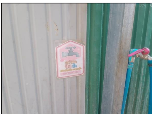
ภาพที่ 27 ป้ายรณรงค์ประหยัดน้ำ