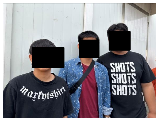
ภาพที่ 38 หัวหน้าคนงาน