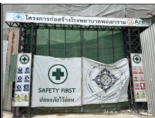
ภาพที่ 29 ป้ายเตือนอันตราย