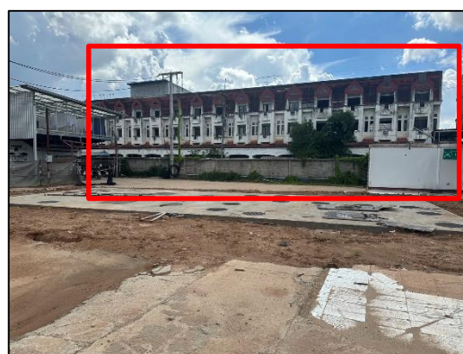
ภาพที่ 40 บ้านพักคนงาน