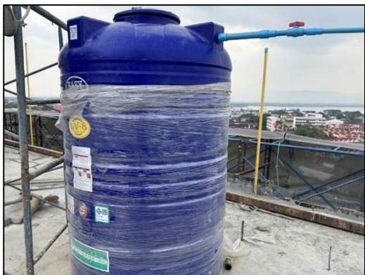
ภาพที่ 13 ถังสำรองน้ำใช้