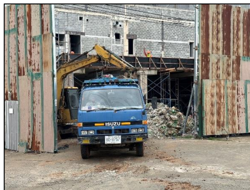
ภาพที่ 63 เก็บขนเศษวัสดุก่อสร้าง