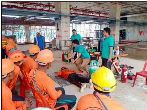
ภาพที่ 59 ซ้อมอพยพหนีไฟ