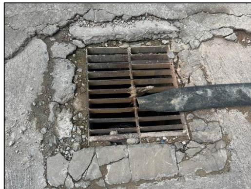
ภาพที่ 60 บ่อดักตะกอนดิน