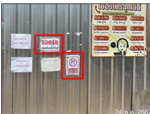
ภาพที่ 11 ป้ายดับเครื่องยนต์ และป้ายจำกัดความเร็ว