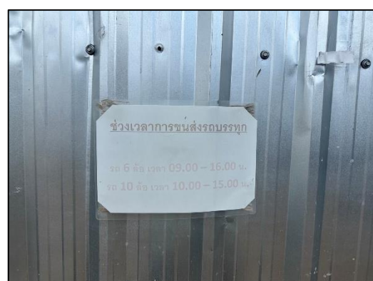
ภาพที่ 12 ป้ายกำหนดช่วงเวลาการขนส่ง