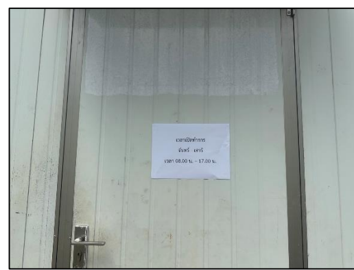
ภาพที่ 16 ป้ายกำหนดช่วงเวลาการทำงาน