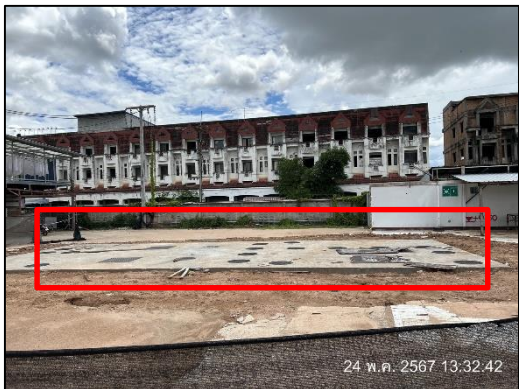
ภาพที่ 25 ถังระบบบำบัดน้ำเสียแบบเดิมอากาศ