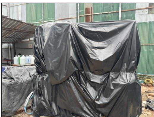
ภาพที่ 15 พื้นที่กองเก็บถุงปูนซีเมนต์