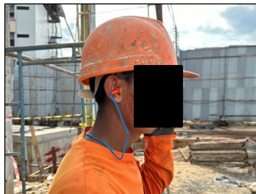
ภาพที่ 36 ปลั๊กลดเสียง