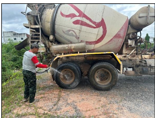
ภาพที่ 17 พื้นที่ล้างล้อ และกิจกรรมล้างล้อรถบรรทุก