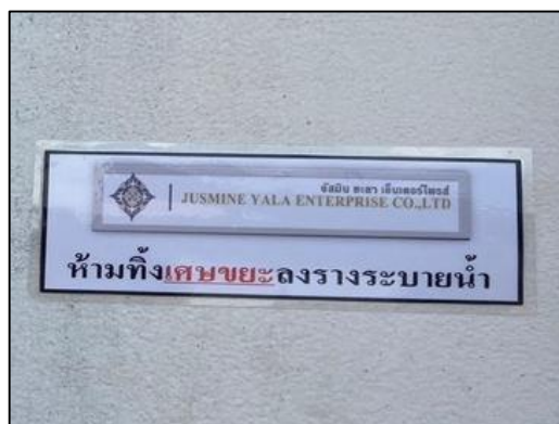
ภาพที่ 28 ป้ายห้ามทิ้งเศษขยะลงรางระบายน้ำ