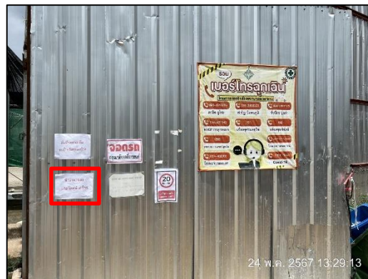
ภาพที่ 14 ป้ายห้ามเผาขยะ