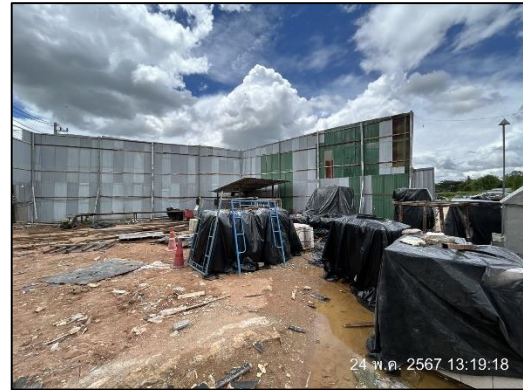
ภาพที่ 8 พื้นที่กองเก็บวัสดุก่อสร้าง