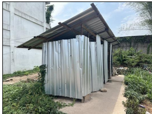
ภาพที่ 26 ห้องน้ำคนงาน