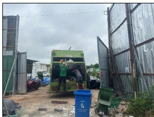
ภาพที่ 62 เก็บขนขยะมูลฝอย