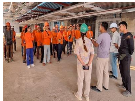
ภาพที่ 10 กิจกรรม Safety Talk