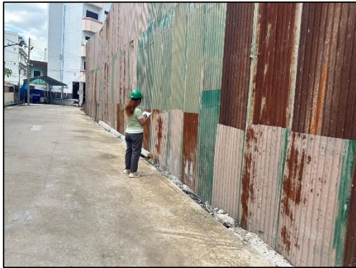
ภาพที่ 7 เจ้าหน้าที่คอยดูแล และตรวจสอบแนวรั้วชั่วคราว