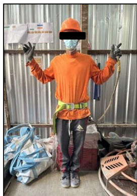
ภาพที่ 35 คนงานสวมใส่อุปกรณ์ป้องกันภัยส่วนบุคคล