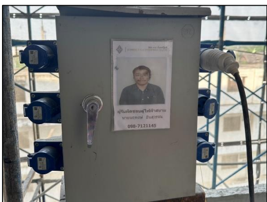
ภาพที่ 61 ตู้ไฟฟ้าสนาม และผู้รับผิดชอบ (ช่างเทคนิคไฟฟ้า)