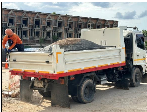
ภาพที่ 9 ผ้าใบปิดคลุมท้ายรถบรรทุก