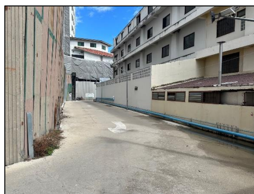
ภาพที่ 18 สภาพถนนบริเวณพื้นที่ก่อสร้าง