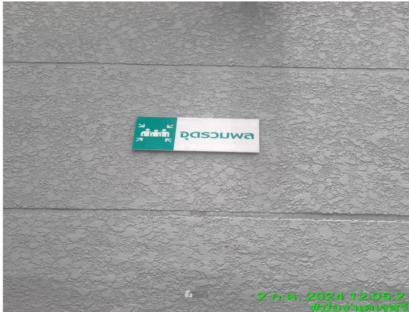
รูปที่ 25 จุดรวมพล