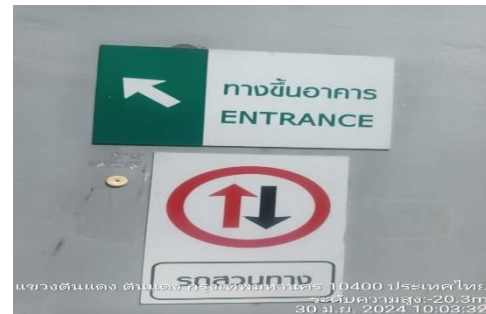
รูปที่ 4 ป้ายบอกรถสวนทาง