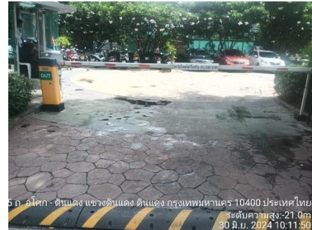
รูปที่ 11 ไม้อัดอัตโนมัติ และบริเวณรับแลกบัตร