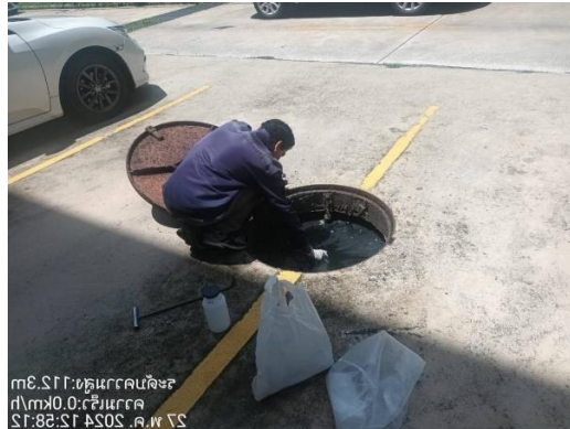
รูปที่ 6 เจ้าหน้าที่ตรวจสอบคุณภาพน้ำ