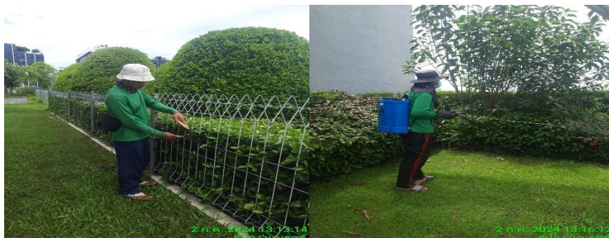
รูปที่ 31 เจ้าหน้าที่ดูแลพื้นที่สีเขียว 2 รูป