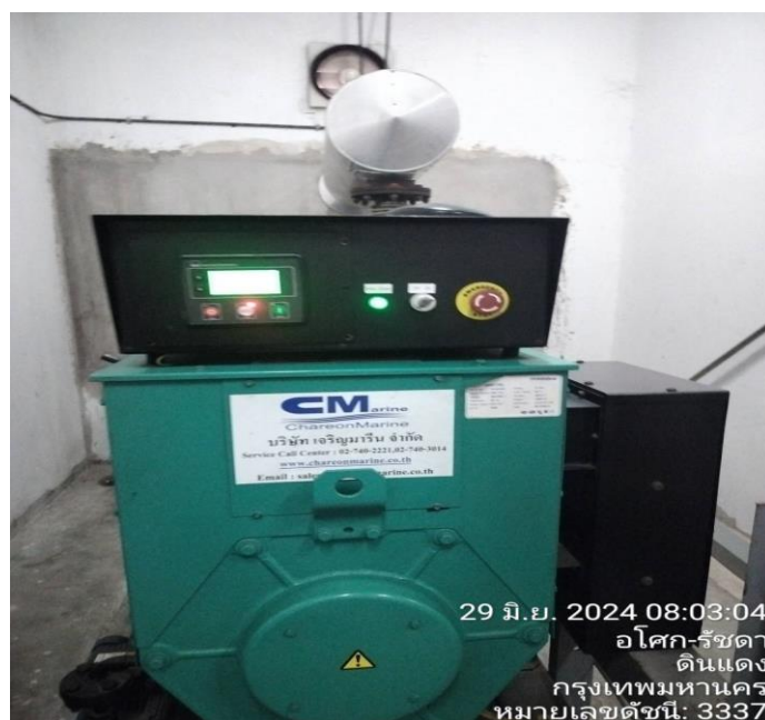
รูปที่ 14 เครื่องกำเนิดไฟฟ้าสำรอง