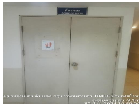
รูปที่ 17 ห้องพัสดุฟอนประจำชั้น