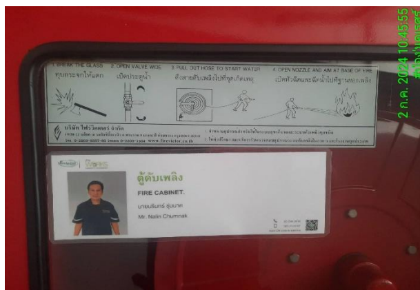
รูปที่ 19 วิธีการใช้อุปกรณ์ดับเพลิง