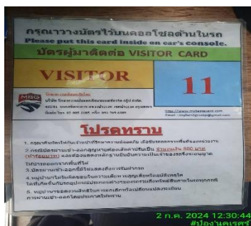
รูปที่ 30 บัตรอนุญาตสำหรับผ่านเข้า-ออกสำหรับผู้ มาติดต่องานกับโครงการ