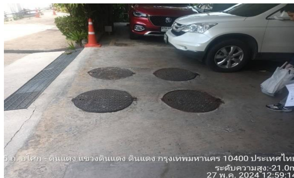
รูปที่ 5 ระบบบำบัดน้ำเสีย