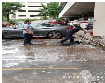
รูปที่ 32 เจ้าหน้าที่ทำความสะอาดภายในโครงการ