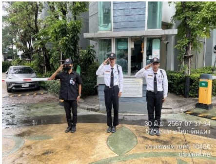
รูปที่ 3 เจ้าหน้าที่รักษาความปลอดภัย