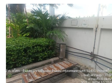
รูปที่ 1 พื้นที่สีเขียว