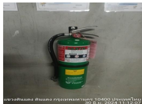
รูปที่ 23 ระบบป้องกันอัคคีภัย