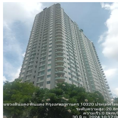
รูปที่ 27 สีอาคาร