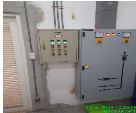
รูปที่ 29 ตู้ไฟฟ้าแรงต่ำ