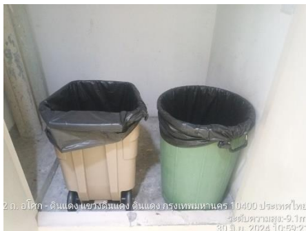
รูปที่ 16 ถังขยะ