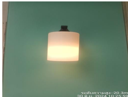
รูปที่ 13 หลอดไฟฟ้า