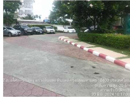
รูปที่ 2 ถนนภายในพื้นที่โครงการ