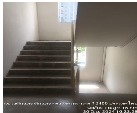
รูปที่ 21 บันไดหนีไฟ