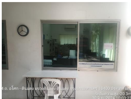
รูปที่ 8 ห้องนิติบุคคล