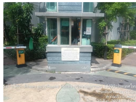
รูป 9 ทางเข้า-ออกโครงการ