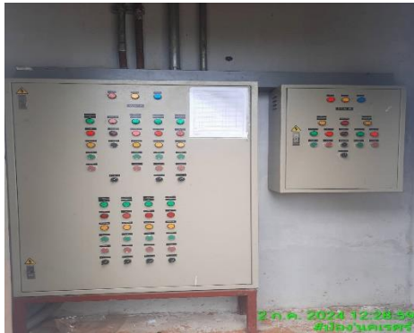
รูปที่ 28 ตู้ควบคุมระบบบำบัดน้ำเสีย