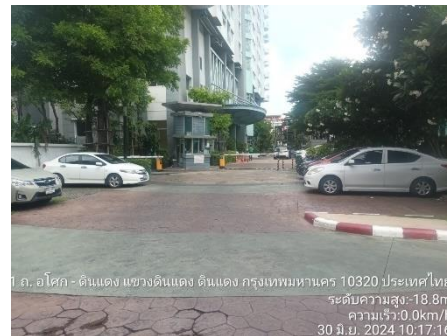
รูปที่ 7 ระยะห่างถอยร่นรอบอาคาร โครงการ