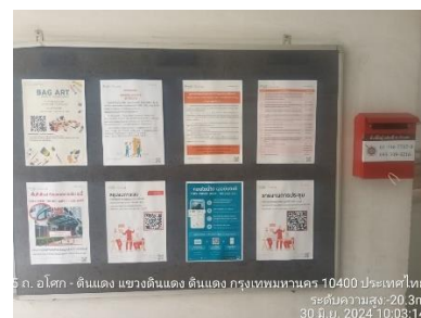
รูปที่ 31 บอร์ดประชาสัมพันธ์