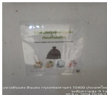
รูปที่ 22 ป้ายรณรงค์การแยกขยะ