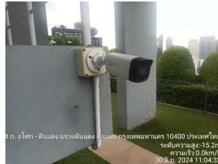
รูปที่ 20 ระบบรักษาความปลอดภัย และกล้องวงจรปิด