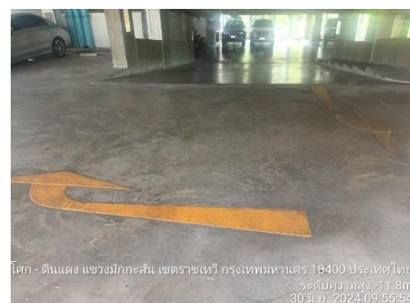
รูปที่ 10 ป้ายบอกเส้นทางจราจรภายในโครงการ