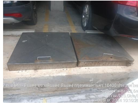
รูปที่ 15 ถังน้ำสำรองชั้นคาเฟ่และชั้นใต้ดิน