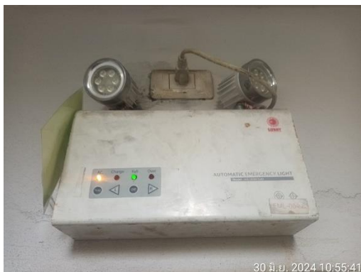
รูปที่ 26 ไฟฉุกเฉิน