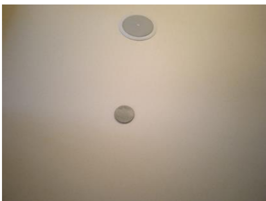
ภาพที่ 15 เครื่องตรวจจับควัน