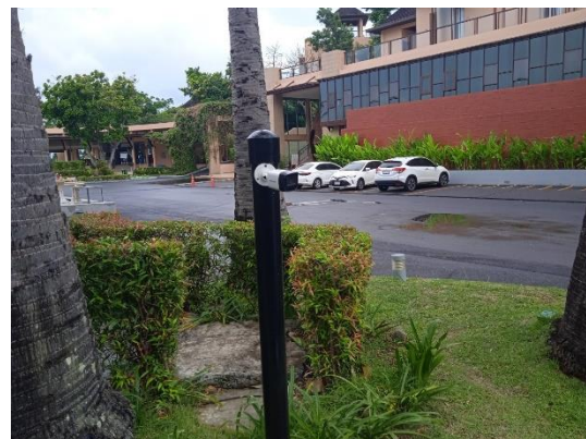
ภาพที่ 22 กล้องวงจรปิด