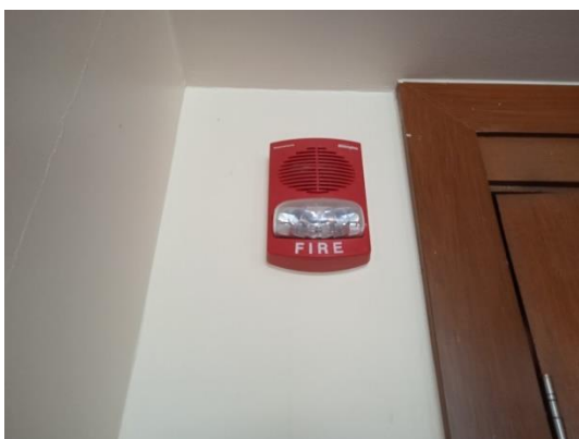
ภาพที่ 17 สัญญาณไฟฉุกเฉิน