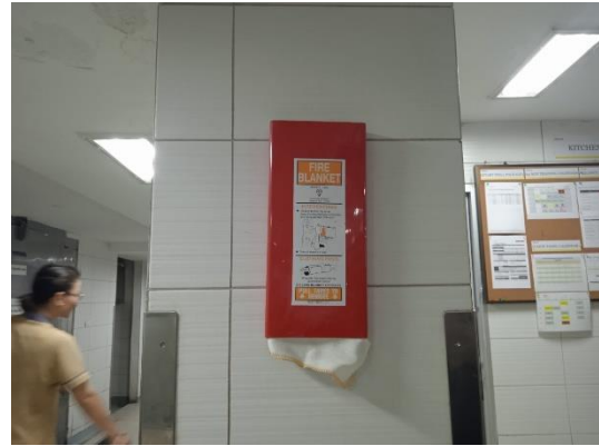
ภาพที่ 20 ผ้าห่มกันไฟ