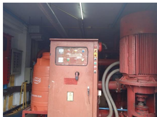
ภาพที่ 24 ปั้มน้ำดับเพลิง