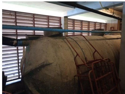
ภาพที่ 8 ระบบบำบัดน้ำเสีย