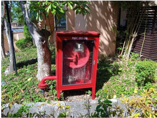
ภาพที่ 19 ตู้เก็บอุปกรณ์ดับเพลิง

รายงานผลการปฏิบัติตามมาตรการป้องกันและแก้ไขผลกระทบสิ่งแวดล้อม และมาตรการติดตามตรวจสอบคุณภาพสิ่งแวดล้อม (ระยะดำเนินการ) โรงแรม เดอะ เวสทิน ลีโพรเบย์ รีสอร์ท แอนด์ สปา ภูเก็ต ประจำเดือน มกราคม-มิถุนายน พ.ศ. 2567