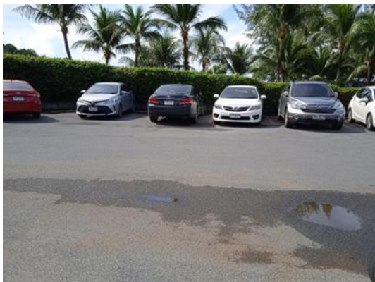
ภาพที่ 7 ลานจอดรถ

รายงานผลการปฏิบัติตามมาตรการป้องกันและแก้ไขผลกระทบสิ่งแวดล้อม และมาตรการติดตามตรวจสอบคุณภาพสิ่งแวดล้อม (ระยะดำเนินการ) โรงแรม เดอะ เวสทิน ลิโهرเบย์ รีสอร์ท แอนด์ สปา ภูเก็ต ประจำเดือน มกราคม-มิถุนายน พ.ศ. 2567