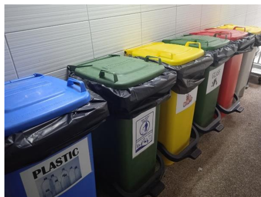
ภาพที่ 10 ถังขยะบริเวณห้องครัว