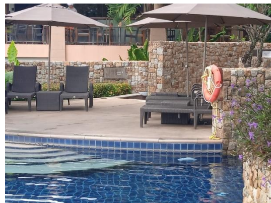
ภาพที่ 28 ท่วงยางชูชีพ