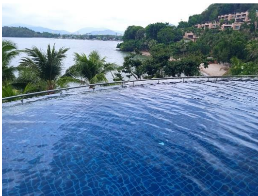
ภาพที่ 27 สระว่ายน้ำน้ำ