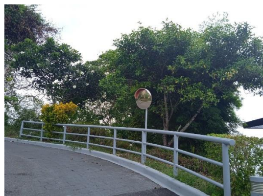
ภาพที่ 6 กระจกนูน