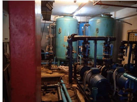
ภาพที่ 26 ระบบปรับปรุงคุณภาพน้ำใช้