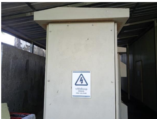
ภาพที่ 3 หม้อแปลงไฟฟ้า