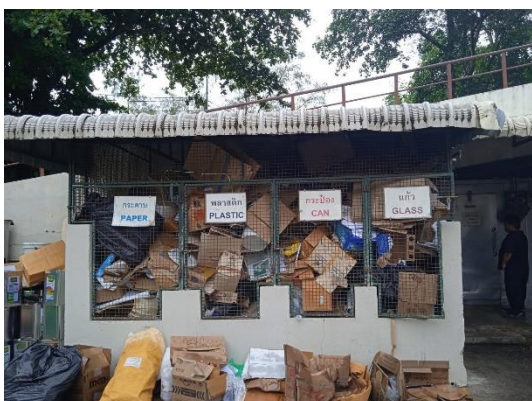
ภาพที่ 11 ที่พักขยะรีไซเคิล