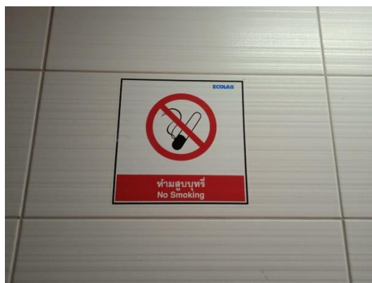
ภาพที่ 18 ป้ายเตือนห้ามสูบบุหรี่