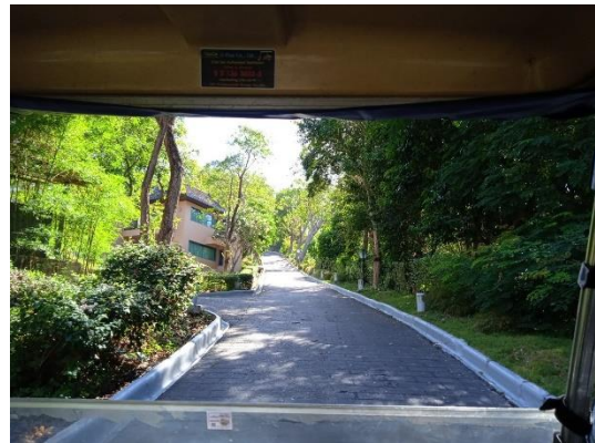
ภาพที่ 2 เส้นทางสัญจรในโครงการ