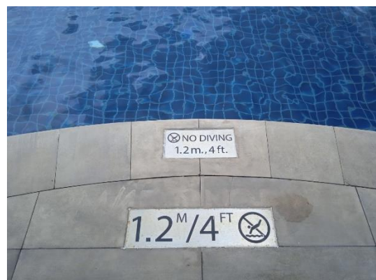
ภาพที่ 30 ป้ายบอกระดับความลึกสระว่ายน้ำ