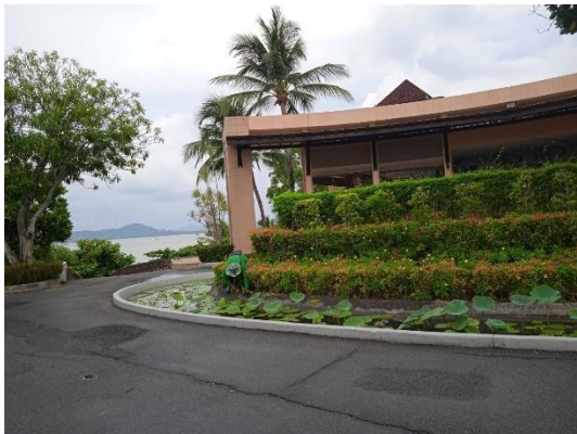
ภาพที่ 1 พื้นที่สีเขียวภายในโครงการ

รายงานผลการปฏิบัติตามมาตรการป้องกันและแก้ไขผลกระทบสิ่งแวดล้อม และมาตรการติดตามตรวจสอบคุณภาพสิ่งแวดล้อม (ระยะดำเนินการ) โรงแรม เดอะ เวสทิน ลิโพรเบย์ รีสอร์ท แอนด์ สปา ภูเก็ต ประจำเดือน มกราคม-มิถุนายน พ.ศ. 2567