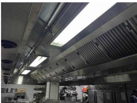
ภาพที่ 29 เครื่องดูดควันและกลิ่นในห้องครัว