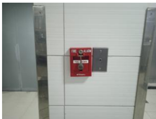
ภาพที่ 16 อุปกรณ์แจ้งเหตุฉุกเฉิน