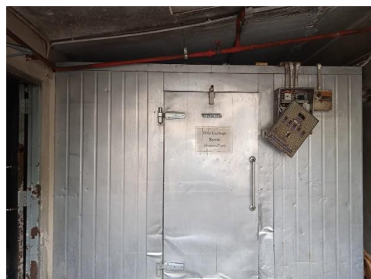
ภาพที่ 12 ที่พักขยะเปียก