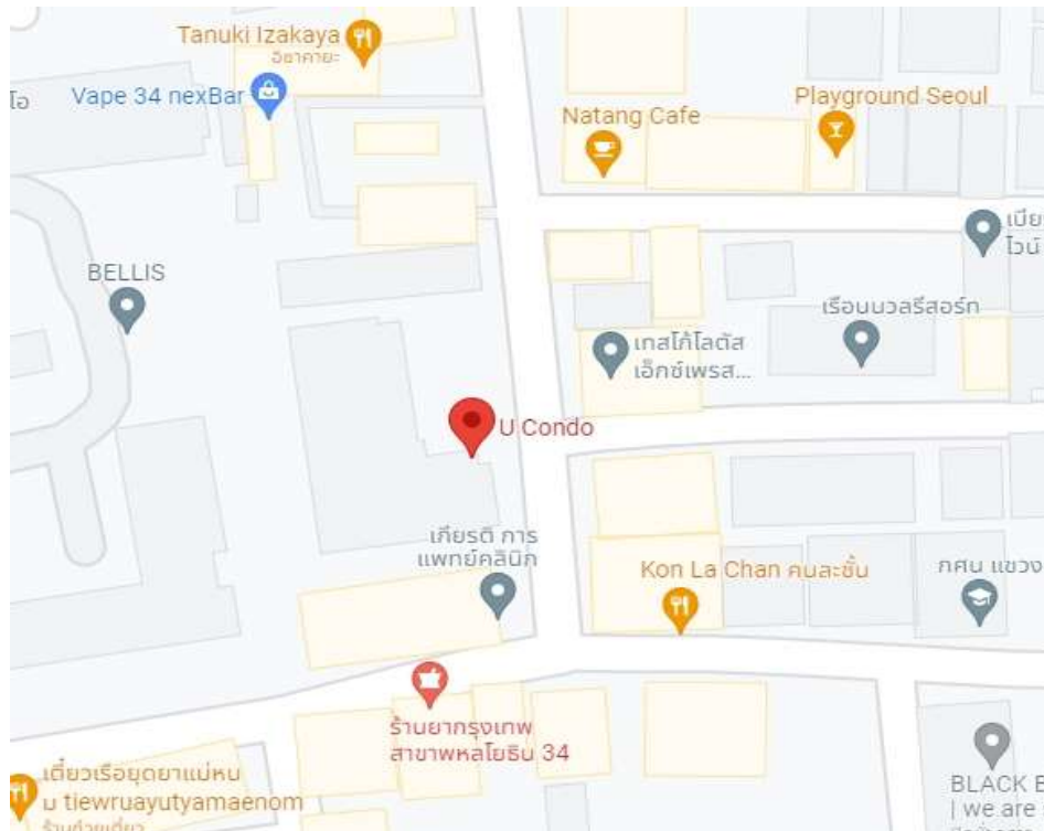
รูปภาพสถานที่ตั้งโครงการ