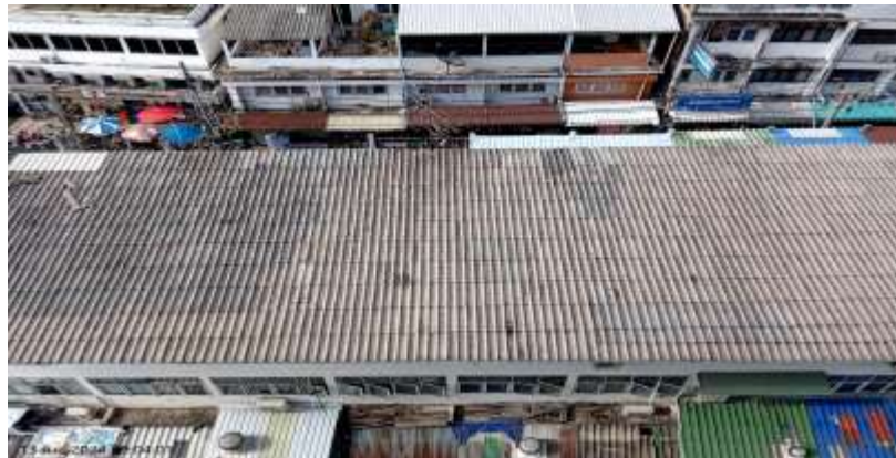
ทิศใต้ ติดกับ อาคารพาณิชย์ขนาดความสูง 3 ชั้น