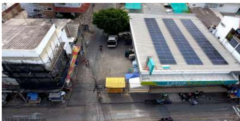
ทิศตะวันออก ติดกับ อาคารพาณิชย์ขนาดความสูง 3 ชั้น จำนวน 4 คูหา และ LOTUS'S GO FRESH