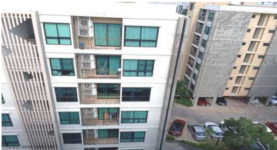
ทิศตะวันตก ติดกับ คอนโด สุภาลัย คิวท์ รัชโยธิน-พหลโยธิน 34