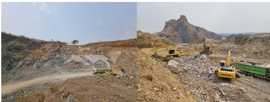
รูปที่ 1-1 สภาพพื้นที่หน้าเหมืองของโครงการ

โครงการเหมืองแร่หินอุตสาหกรรมชนิดหินปูนเพื่ออุตสาหกรรมก่อสร้าง ประทานบัตรที่ 31107/15407 ร่วมแผนผังการทำเหมืองเดียวกันกับประทานบัตรที่ 31125/16017 บริษัท พิสิษฐ์ธุรกิจ จำกัด มีอายุประทานบัตร 30 ปี นับตั้งแต่วันที่ 17 ตุลาคม 2548 สิ้นอายุวันที่ 19 ตุลาคม 2579 ตั้งอยู่ที่ ตำบลแม่กา และตำบลจำปาหวาย อำเภอเมือง จังหวัดพะเยา ปฏิบัติตามมาตรการป้องกันและแก้ไขผลกระทบสิ่งแวดล้อม และมาตรการติดตามตรวจสอบคุณภาพสิ่งแวดล้อมที่กำหนดโดยสำนักงานนโยบายและแผนทรัพยากรธรรมชาติและสิ่งแวดล้อม ปัจจุบันเปิดการทำเหมืองเปิดตามที่แผนผังโครงการทำเหมืองกำหนด