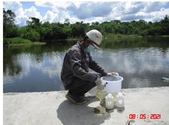
ฝายน้ำล้นห้วยท่าเคยล่าง