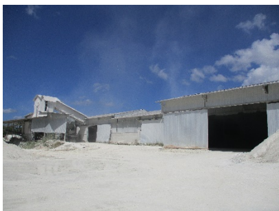
พื้นที่โรงแต่งแร่ของโครงการ