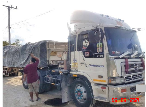
การปิดคลุมผ้าใบรถบรรทุก