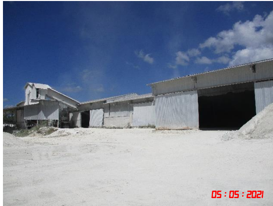
อาคารปิดคลุมโรงแต่งแร่