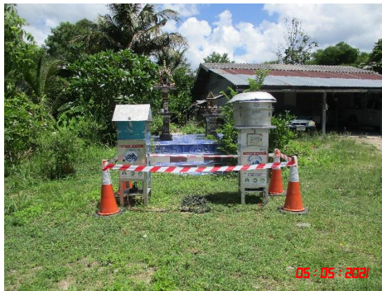
บ้านห้วยสวนพลู