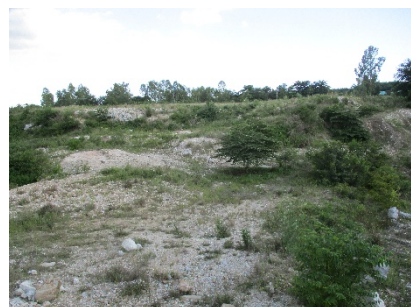
แนวเวนพื้นที่ทำเหมือง