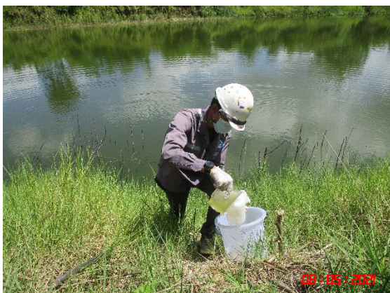
สระหลวงบ้านร่องเจริญ