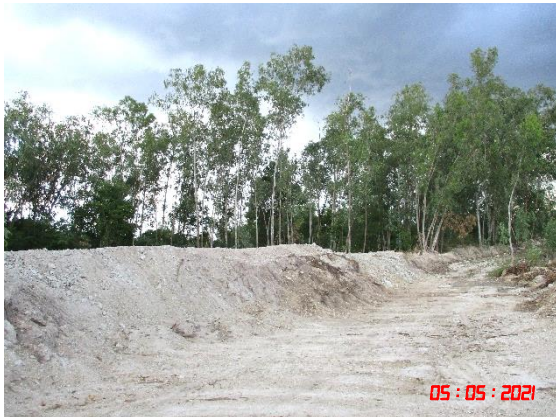
คันทำนบดิน