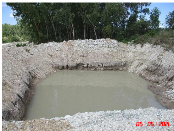
บ่อดักตะกอน