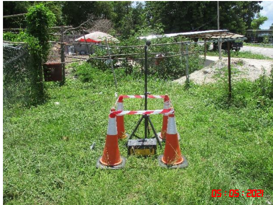
บ้านห้วยสวนพลู