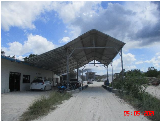
จุดชั่งน้ำหนักรถบรรทุก