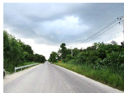
ทางหลวงหมายเลข 3313