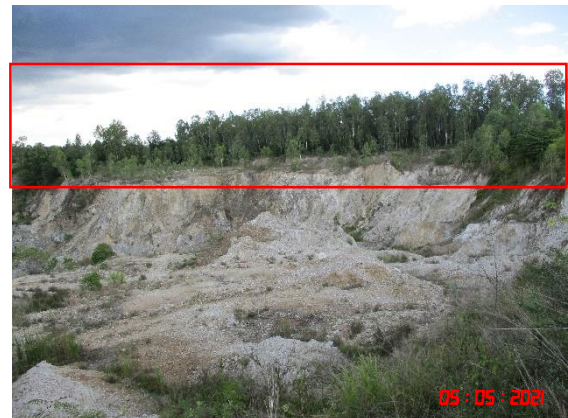
แนวเวนพื้นที่ทำเหมือง