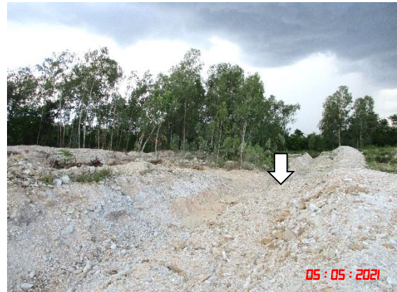
คูระบายน้ำ