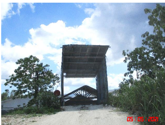
อาคารปิดคลุมยังรับแร่