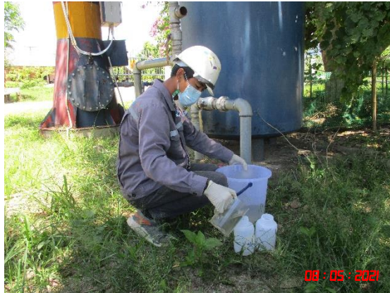
น้ำบาดาลบ้านร่องเจริญ