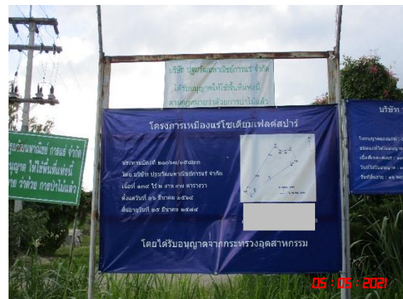
ป้ายแสดงขอบเขตพื้นที่โครงการ