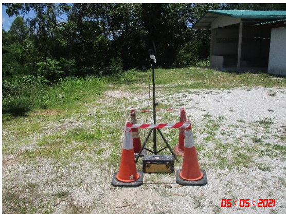
บ้านร่องเจริญ