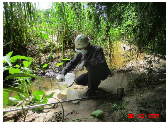
ห้วยไม่มีชื่อทางด้านทิศตะวันตก