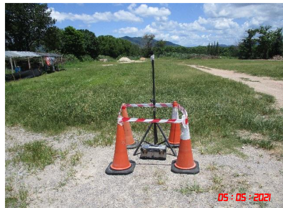
บ้านโป่งกระทิงล่าง