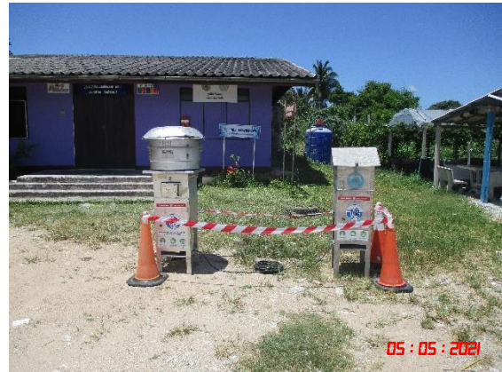
บ้านโป่งกระทิงล่าง