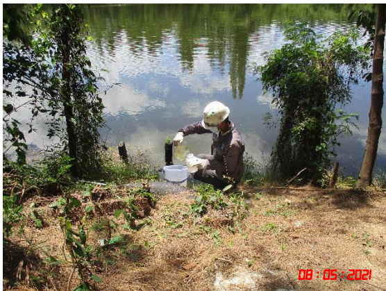
สระน้ำบ้านห้วยสวนพลู