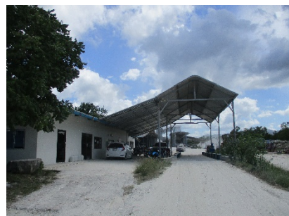
อาคารสำนักงาน