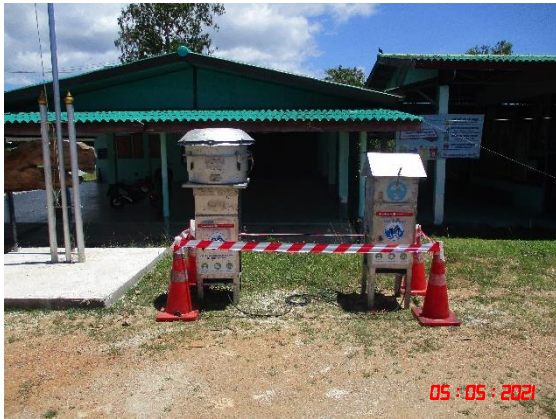
บ้านร่องเจริญ