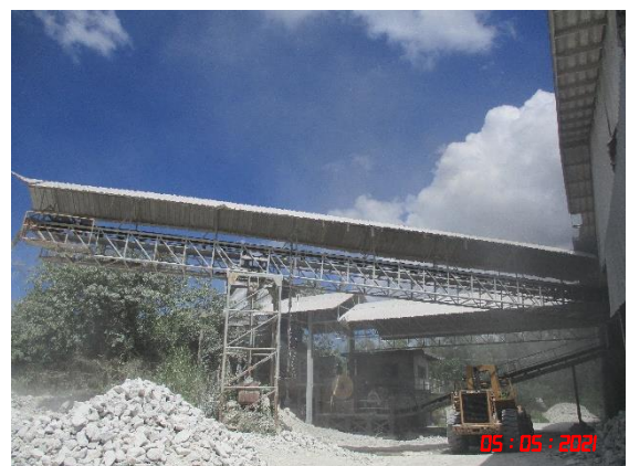
หลังคาปิดคลุมสายพานลำเลียง