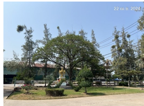
ภาพที่ 1.5-1 สภาพการดำเนินโครงการฯ ในเดือนเมษายน 2567