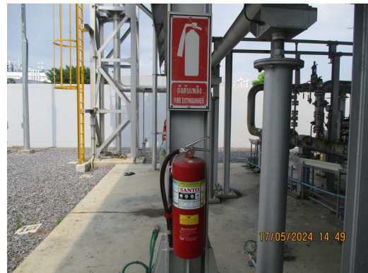
ภาพที่ 2-5 ถังดับเพลิงแบบผงเคมีแห้ง