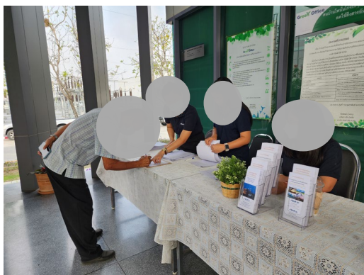
ภาพที่ 2-2 ศูนย์รับเรื่องร้องเรียน