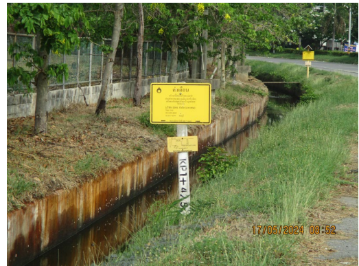
ภาพที่ 2-1 ป้ายแสดงตำแหน่งแนวท่อส่งก๊าซธรรมชาติ