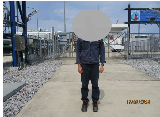
ภาพที่ 2-8 พนักงานสวมใส่อุปกรณ์คุ้มครองความปลอดภัยส่วนบุคคล