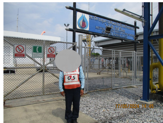
ภาพที่ 2-7 เจ้าหน้าที่รักษาความปลอดภัย บริเวณสถานีควบคุมความดันและวัดปริมาณก๊าซธรรมชาติ (MRS)