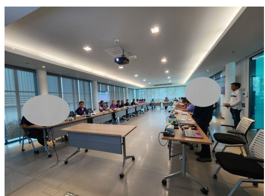
ภาพที่ 2-3 การประชาสัมพันธ์เรื่องการระงับเหตุฉุกเฉิน