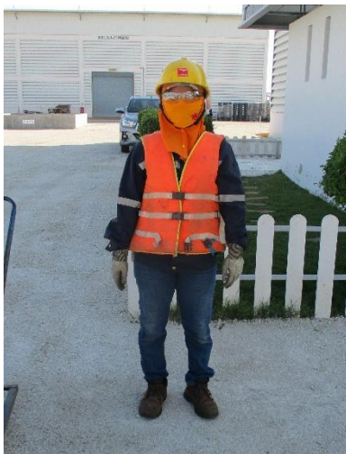
รูปที่ 3-11 พนักงานสวมใส่อุปกรณ์คุ้มครองความปลอดภัยส่วนบุคคล