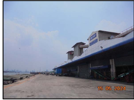
รูปที่ 10 ระบบไฟส่องสว่างภายนอกอาคาร