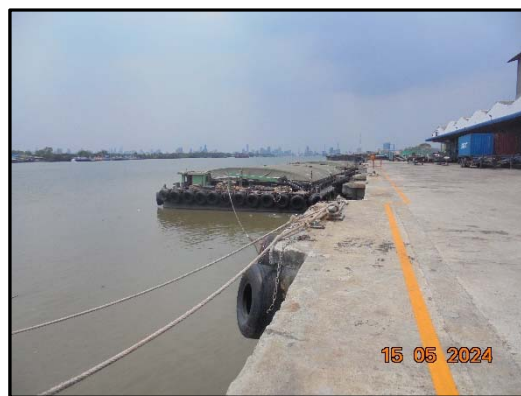
รูปที่ 5 ขอบคอนกรีต บริเวณท่าเทียบเรือ โดยรอบ และเทพื้นด้วยคอนกรีตเสริมเหล็ก