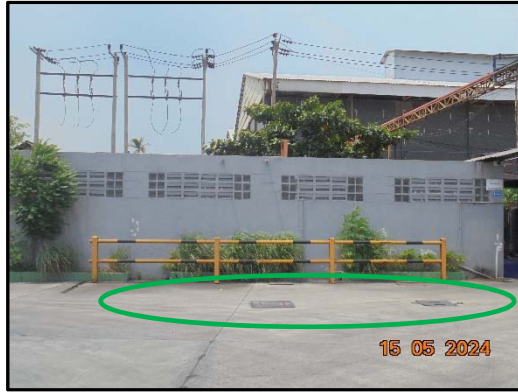
รูปที่ 1 ระบบบำบัดน้ำเสียสำเร็จรูปเพื่อทำการบำบัดน้ำทิ้งจากอาคารสำนักงาน