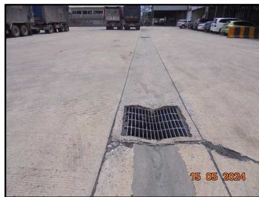
รูปที่ 3 รางระบายน้ำแบบมีตะแกรงดักขยะภายในพื้นที่โครงการ