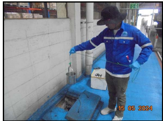
รูปที่ 2 บ่อพักน้ำภายในพื้นที่โครงการ