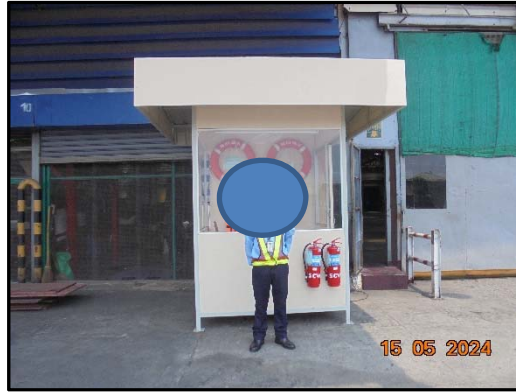
รูปที่ 8 เจ้าหน้าที่รักษาความปลอดภัยประจำโครงการ