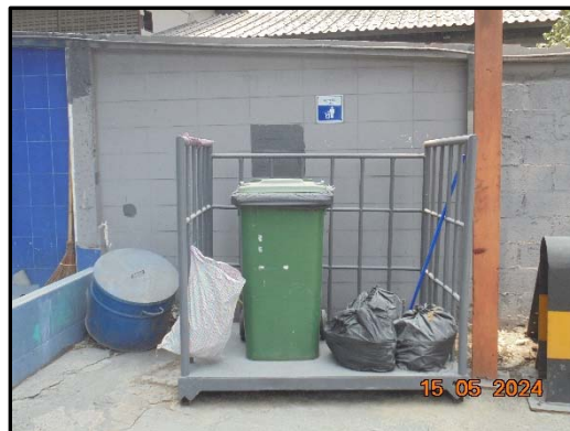
รูปที่ 9 ถังขยะภายในพื้นที่โครงการ