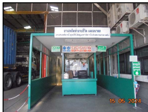
รูปที่ 12 ป้ายเตือนอันตรายภายในพื้นที่โครงการ