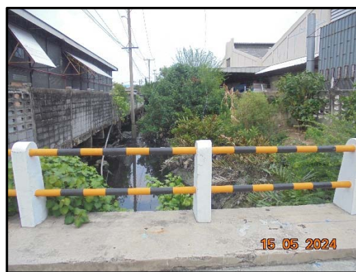
รูปที่ 4 คลองบางบัว