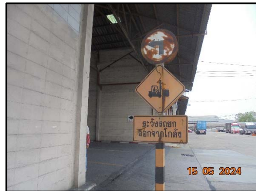
รูปที่ 7 ป้ายจราจรภายในพื้นที่โครงการ