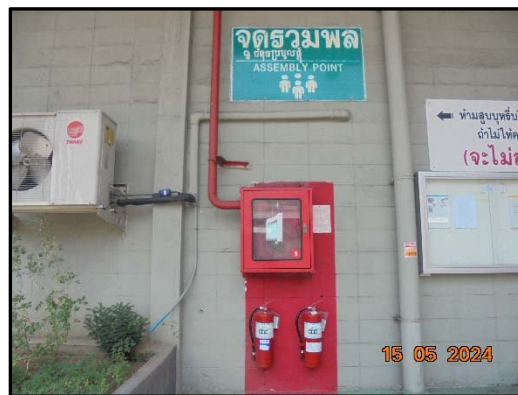
รูปที่ 6 ถังเคมีดับเพลิงแบบมือถือ