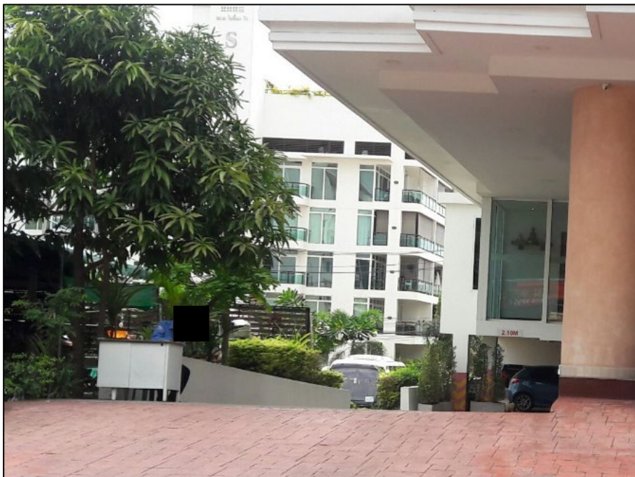
รูปที่ 2-2 ยามรักษาความปลอดภัยควบคุมการเข้า-ออก พื้นที่ก่อสร้าง ปรับปรุงอาคาร