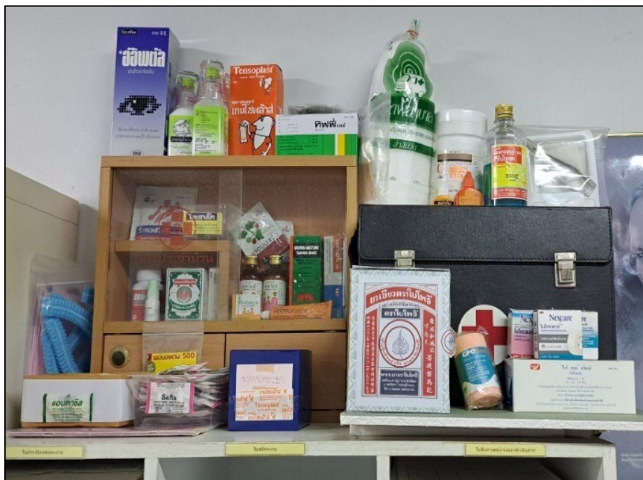
รูปที่ 2-8 อุปกรณ์ปฐมพยาบาล