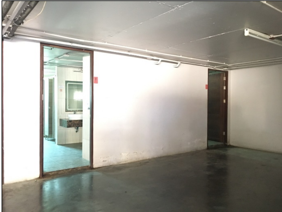
รูปที่ 2-5 ห้องน้ำ-ห้องส้วม สำหรับคนงาน