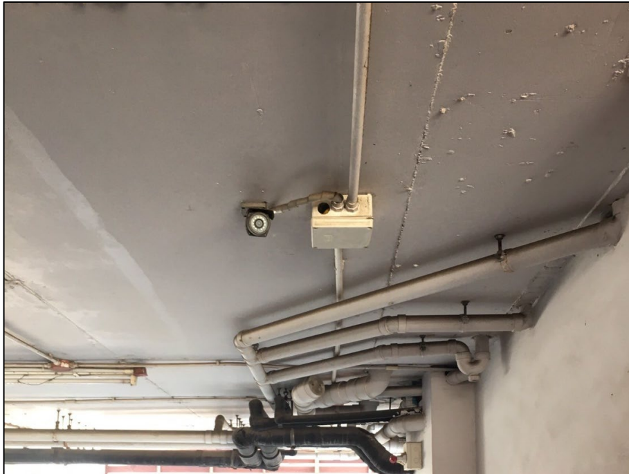
รูปที่ 2-7 กล้องวงจรปิด