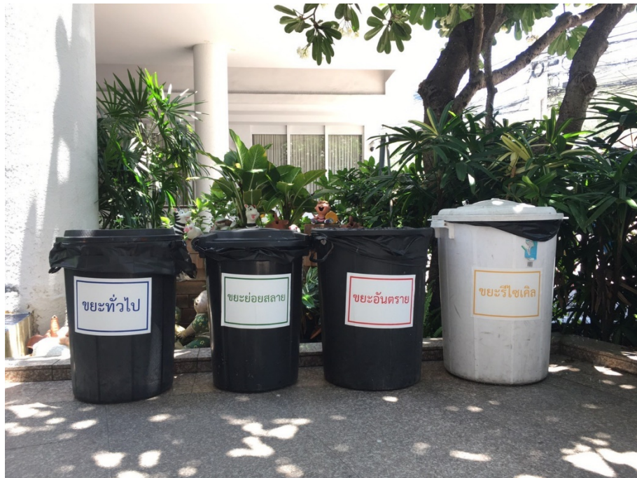
รูปที่ 2-6 ถังรองรับมูลฝอย