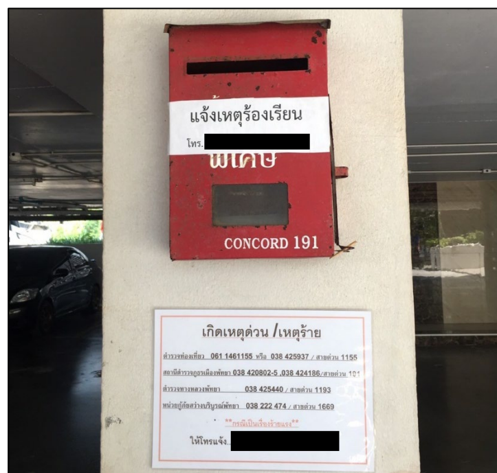
รูปที่ 2-4 กล่องรับความคิดเห็น