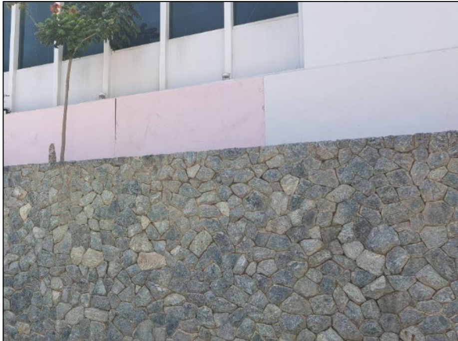
รูปที่ 2-1 ผนังไม้อัดโดยรอบพื้นที่ที่มีการก่อสร้าง