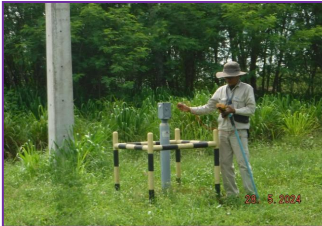
พนักงานสวมใส่ชุด PPE