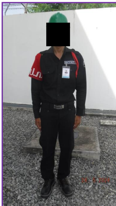
เจ้าหน้าที่รักษาความปลอดภัย