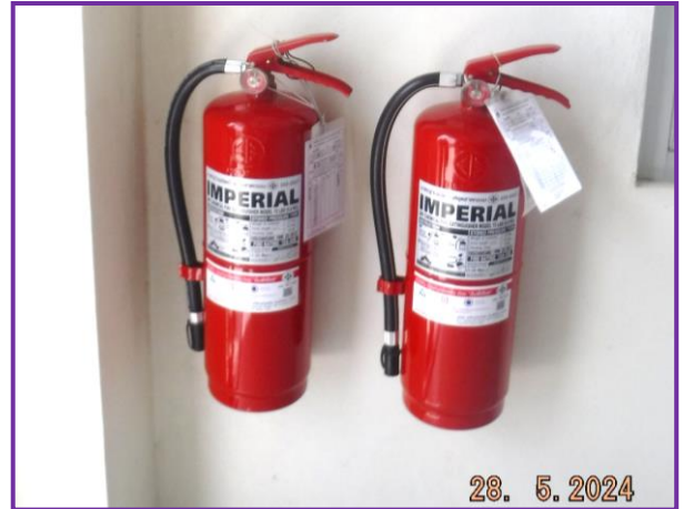
ถังดับเพลิงบริเวณท่อส่งก๊าซฯ