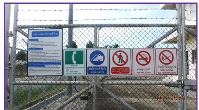
ป้ายเตือนต่าง ๆ บริเวณสถานีควบคุมความดันก๊าซ (MRS)