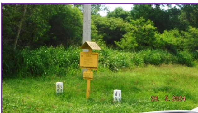
ป้ายเตือนแนวทอส่งก๊าซฯ บริเวณโรงงาน