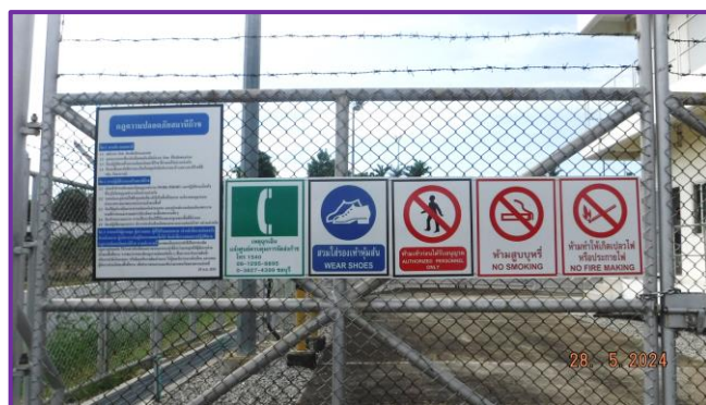
ป้ายเตือนแนวท่อส่งก๊าซฯ บริเวณท่อส่งก๊าซธรรมชาติ