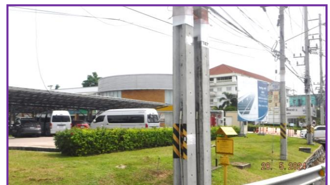
ป้ายเตือนแนวทอส่งก๊าซฯ บริเวณโรงงาน

ภาพที่ 3.2-16 ภาพถ่ายระบบรักษาความปลอดภัยตามแนวทอส่งก๊าซฯ และบริเวณสถานีก๊าซฯ ของโครงการทอส่งก๊าซธรรมชาติไปยังโรงไฟฟ้าตาสีกร์ 2 โรงไฟฟ้าตาสีกร์ 1 และโรงไฟฟ้าวังตาพิน