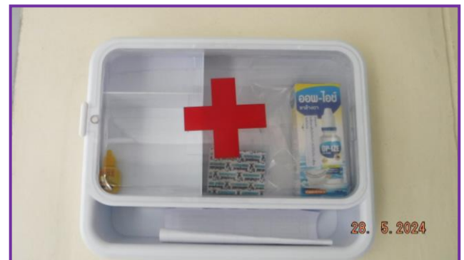
อุปกรณ์ปฐมพยาบาล