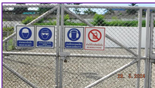
ป้ายเตือนต่าง ๆ บริเวณสถานีควบคุมความดันก๊าซ (MRS)