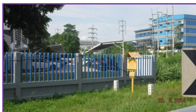
ป้ายเตือนต่าง ๆ บริเวณ (MRS)

ภาพที่ 2.1-16 สภาพปัจจุบันตามแนวท่อส่งก๊าซฯ ของโครงการท่อส่งก๊าซธรรมชาติ ไปยังโรงไฟฟ้าตาสิทธิ์ 2 โรงไฟฟ้าตาสิทธิ์ 1 และโรงไฟฟ้าวังตาฉิน