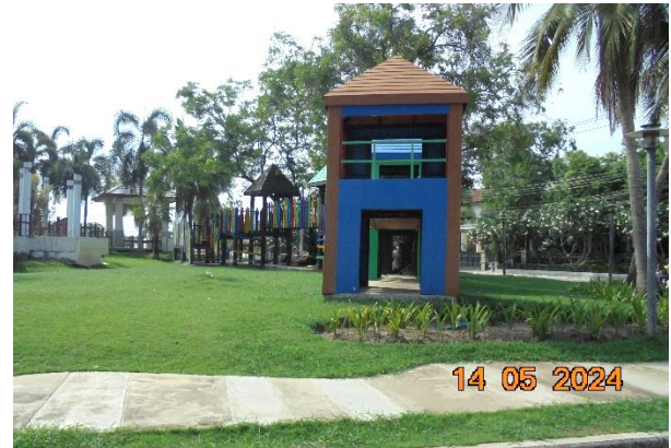
รูปที่ ก-6 การดูแลและบำรุงรักษาสวนสาธารณะ ภายในพื้นที่โครงการอย่างสม่ำเสมอ