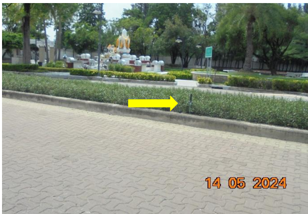
รูปที่ ก-3 นำน้ำทิ้งที่ผ่านการบำบัดแล้วมารดต้นไม้ และสนามหญ้าในสวนสาธารณะภายในพื้นที่โครงการ