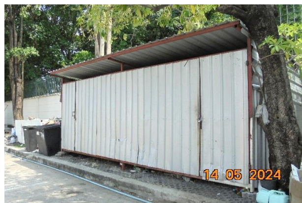
รูปที่ ก-9 พื้นที่พักขยะมูลฝอยรวม