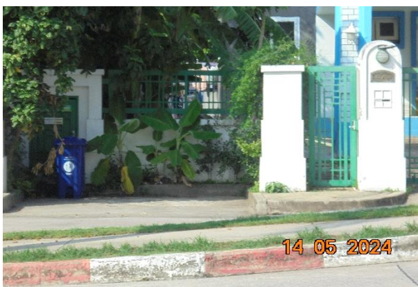
รูปที่ ก-8 จัดให้มีที่กักเก็บรถไว้เป็นระยะๆ ตามถนนซอยย่อยต่างๆ