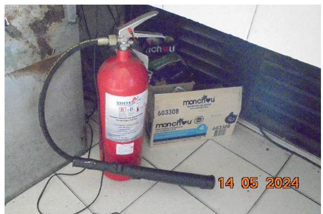
รูปที่ ก-16 ตรวจสอบประสิทธิภาพของระบบดับเพลิงในส่วนต่างๆ ของโครงการอย่างสม่ำเสมอ