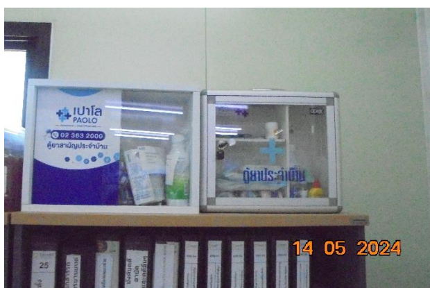
รูปที่ ก-17 อุปกรณ์ปฐมพยาบาลเบื้องต้น ภายในพื้นที่โครงการ