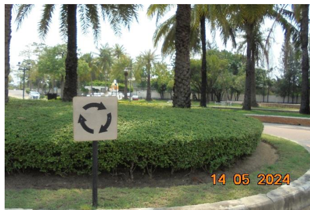
รูปที่ ก-7 ป้ายสัญญาณจราจรและกระจกเงาในบริเวณทางแยกต่างๆ ของพื้นที่โครงการ