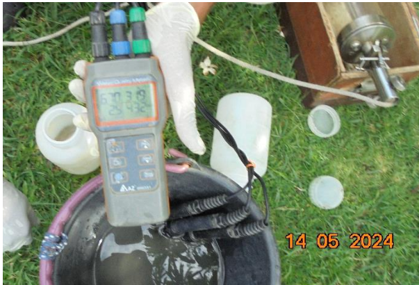
รูปที่ ก-5 การเก็บและวิเคราะห์ตัวอย่างน้ำทิ้ง