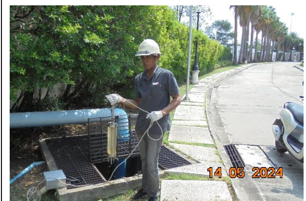
รูปที่ ก-18 ตรวจสอบประสิทธิภาพของระบบสุขาภิบาล ในส่วนต่างๆ ของพื้นที่โครงการอย่างสม่ำเสมอ