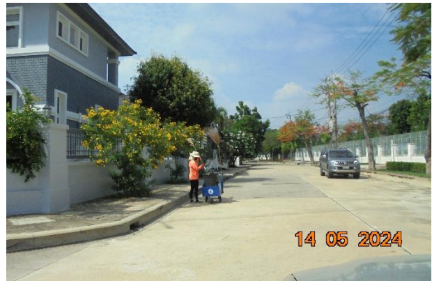
รูปที่ ก-1 ภาพขณะรองรับขยะมูลฝอย และพนักงานเก็บกวาดและจัดเก็บรวบรวมขยะมูลฝอยอย่างเพียงพอ