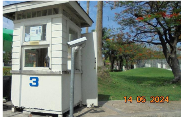
รูปที่ ก-15 ตรวจสอบประสิทธิภาพของยาม และวัสดุอุปกรณ์ที่ใช้ในการดำเนินการรักษาความปลอดภัยต่างๆ อย่างสม่ำเสมอ