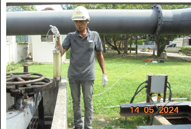
รูปที่ ก-4 ตรวจสอบสภาพการทำงานของระบบบำบัดน้ำเสีย ให้มีประสิทธิภาพดีอยู่เสมอ