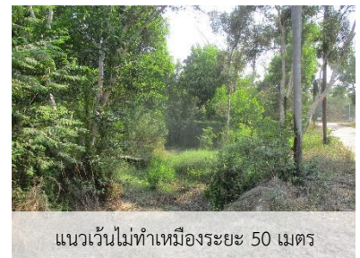
แนวเวนไม่ทำเหมืองระยะ 50 เมตร