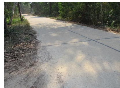
เส้นทางเข้าสู่พื้นที่โครงการ