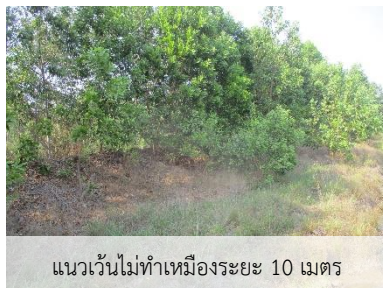
แนวเวนไม่ทำเหมืองระยะ 10 เมตร