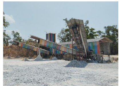
โรงแต่งแร่ของโครงการ