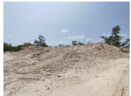
พื้นที่เก็บกองเปลือกดิน