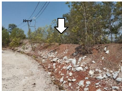
คันทำนบดิน