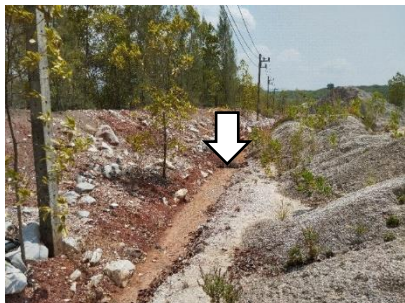
คูระบายน้ำ