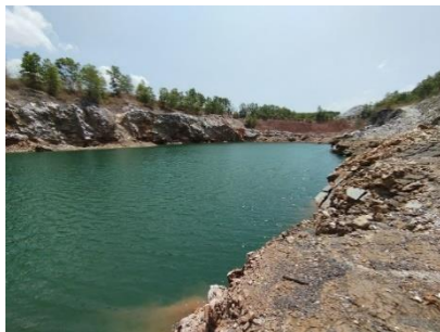
พื้นที่หน้าเหมือง