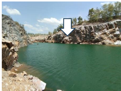
บ่อขุดเหมือง