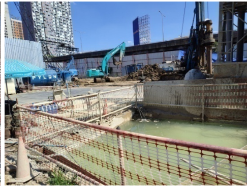
5-ป้อล้างล้อก่อนที่รถจะออกสู่ภายนอกโครงการ