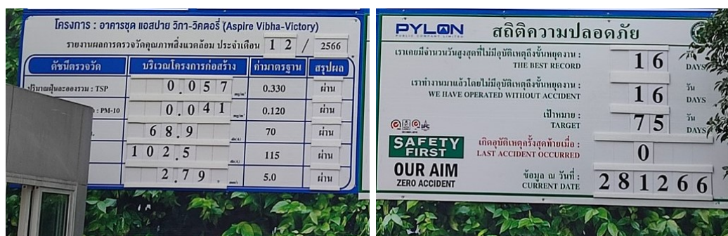
5-3 ป้ายผลการตรวจวัดคุณภาพสิ่งแวดล้อมช่วงเสาเข็มฐานราก และป้ายสถิติความปลอดภัย

ภาพที่ 5 การปฏิบัติตามมาตรการป้องกันและแก้ไขผลกระทบสิ่งแวดล้อมระยะก่อสร้าง