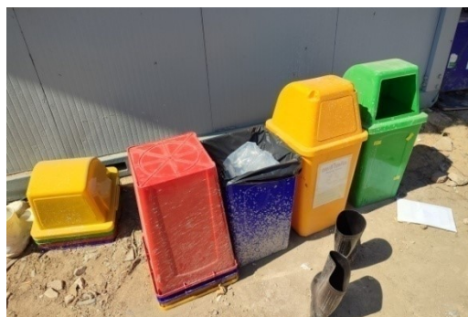
5-14 ถังรองรับมูลฝอยคัดแยกมูลฝอย