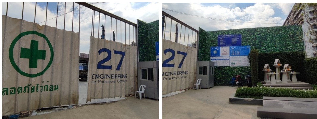
5-5 ป้อมยามรักษาความปลอดภัยด้านหน้าทางเข้าโครงการและประตูเข้าออกด้านหน้าโครงการ