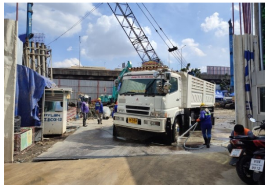
5-10 ล้างทำความสะอาดล้อรถบรรทุกก่อนออกสู่ภายนอกโครงการ