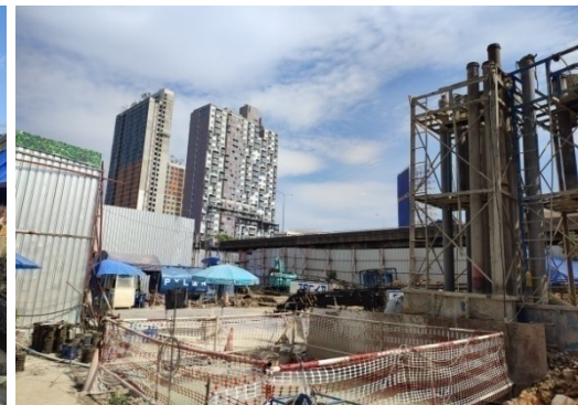
5-12 ทำเสาเข็มแบบเจาะ ชนิดเบี่ยง