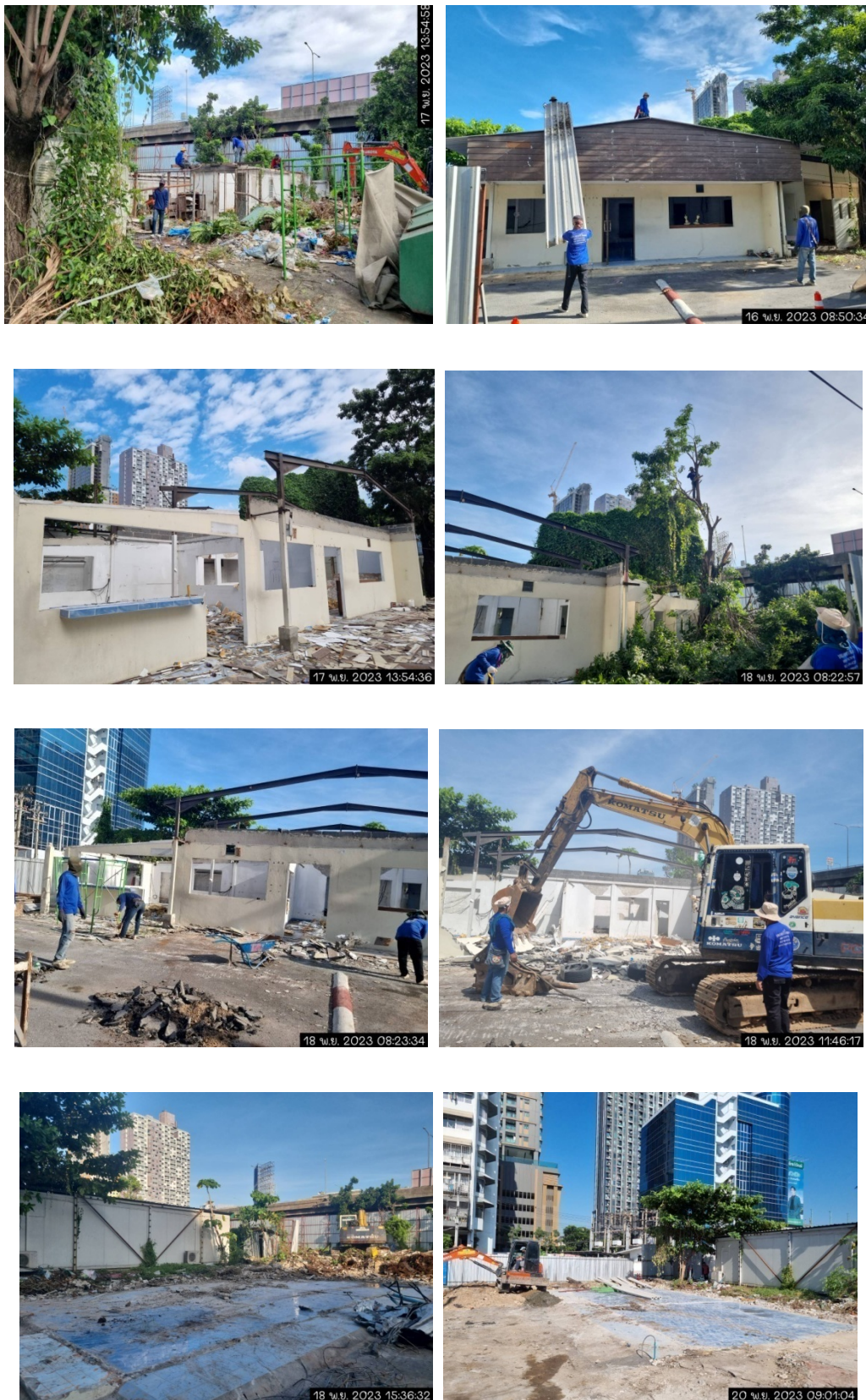
5-7 ขณะทำการรื้อถอนอาคารเดิม