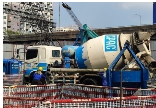
5-11 จอctrถผสมปูนไว้ภายในโครงการเท่านั้น