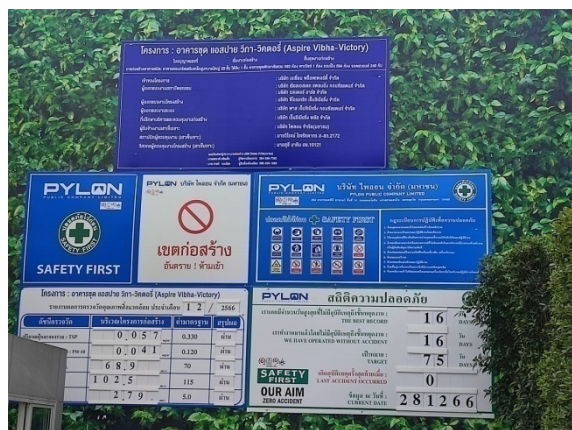
5-1 ป้ายรายละเอียดโครงการ

รายงานผลการปฏิบัติตามมาตรการป้องกันแก้ไขผลกระทบสิ่งแวดล้อมและมาตรการติดตามตรวจสอบคุณภาพสิ่งแวดล้อม โครงการ อาคารชุด แอสปาย วิภา-วิคตอรี ที่ถนนดินแดง แขวงดินแดง เขตดินแดง กรุงเทพมหานคร