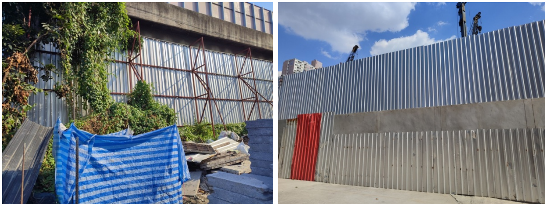
5-4 รั้วชั่วคราวสูง 6 เมตร