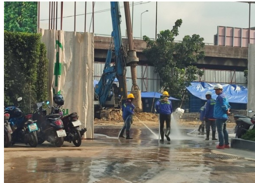
5-9 ล้างทำความสะอาดถนนด้านหน้าโครงการ