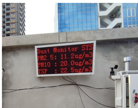
5-2 จอแสดงค่าฝุ่นละอองในพื้นที่โครงการ