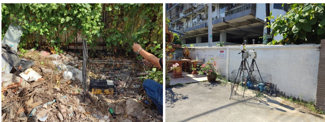
เครื่องวัดความสั่นสะเทือนที่ติดตั้ง และ ติดตั้งเครื่องตรวจวัดฝุ่นละออง เครื่องตรวจวัดเสียง ที่โรงเรียน นิธิบริบูรณ์