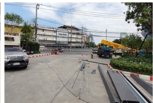
5-15 ทางเข้าออกโครงการติดตั้งกรวยที่ปากทางเข้าออก