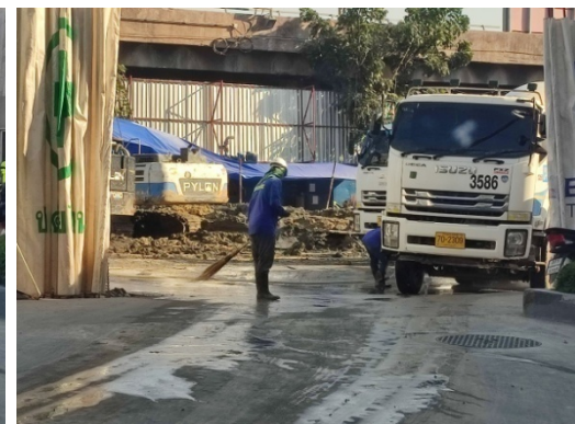
5-13 กวาดทำความสะอาดเศษดินบริเวณประตูทางเข้าออกโครงการ