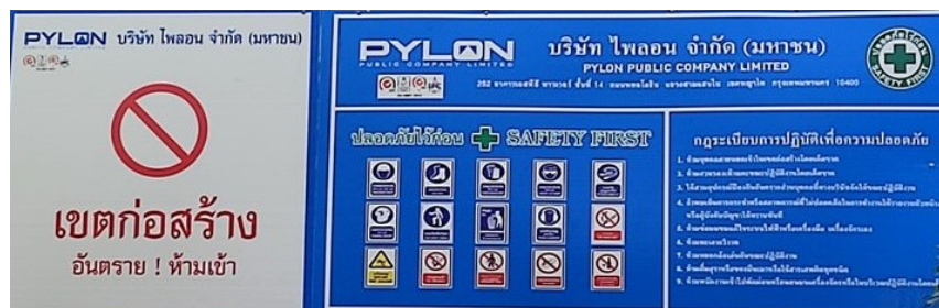
5-6 ป้ายอันตราย เขตการก่อสร้าง