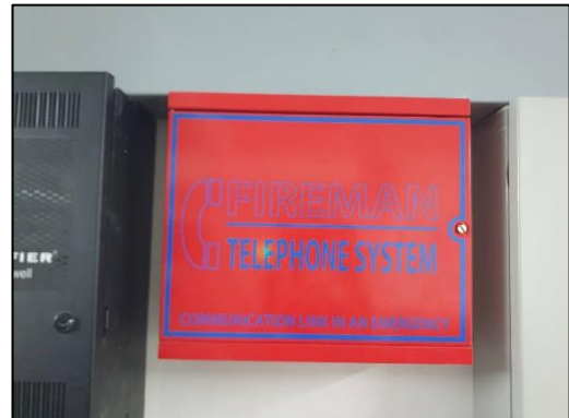
ภาพที่ 56 โทรศัพท์ฉุกเฉิน