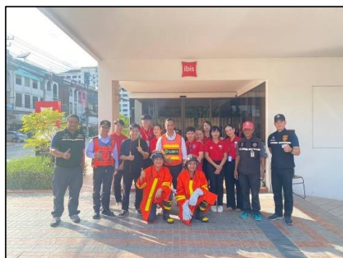
ภาพที่ 59 กิจกรรมซ้อมอพยพหนีไฟ