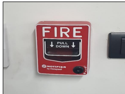
ภาพที่ 58 อุปกรณ์เตือนภัยแบบใช้มือดึง