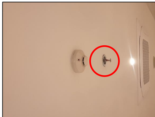
ภาพที่ 57 Sprinkler