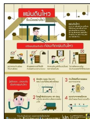
ภาพที่ 60 บอร์ดให้ความรู้เมื่อเกิดแผ่นดินไหว