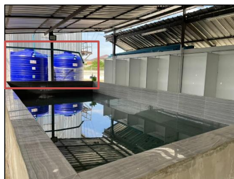
ภาพที่ 22 ถังสำรองน้ำ