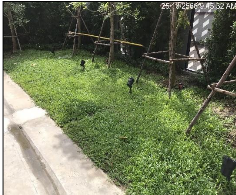
ภาพที่ 34 ปลูหญ้า