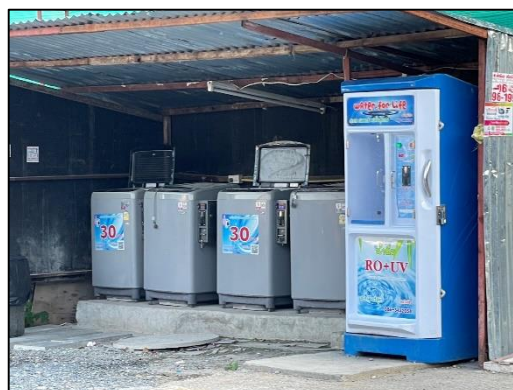
ภาพที่ 18 น้ำดื่มสะอาดบ้านพักคนงาน