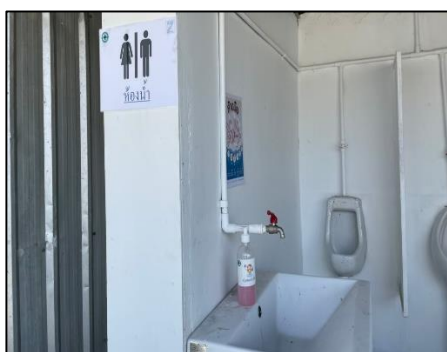
ภาพที่ 19 ห้องน้ำคนงาน