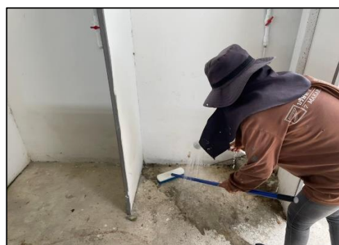
ภาพที่ 20 กิจกรรมล้างห้องน้ำ