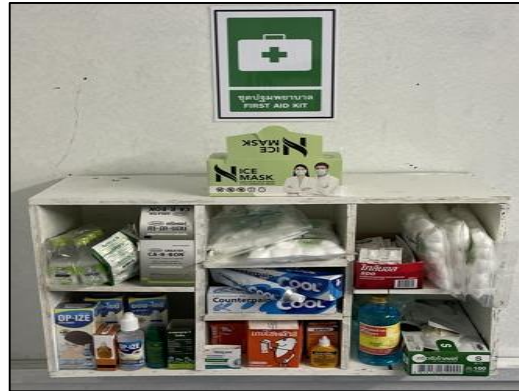
ภาพที่ 35 อุปกรณ์ปฐมพยาบาล