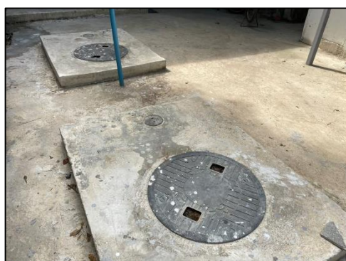
ภาพที่ 21 ระบบบำบัดน้ำเสีย