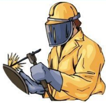
งานประกายไฟ