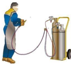
ถังแรงดัน (ถังลมถังแก๊ส)