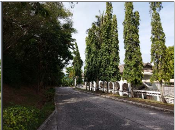
รูปที่ 1.1(2) จัดให้มีพื้นที่สีเขียว มีการปลูก ต้นไม้และหญ้าคลุมดินในบริเวณพื้นที่ว่าง