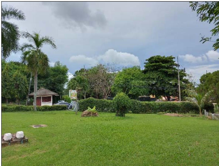
รูปที่ 3.4(2) ทัดนียภาพและสุนทรียภาพ การจัด และตกแต่งพื้นที่สีเขียว