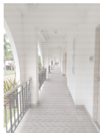
รูปที่ 3.2(6) ตรวจสอบชุดไฟฉุกเฉิน