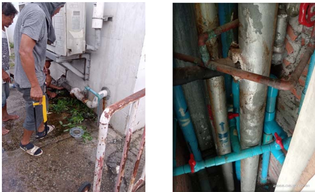
รูปที่ 2.1 ตรวจสอบรอยแตก/ชำรุดของระบบจ่ายน้ำ และระบบเส้นท่อประปาให้อยู่ในสภาพดีอยู่เสมอ