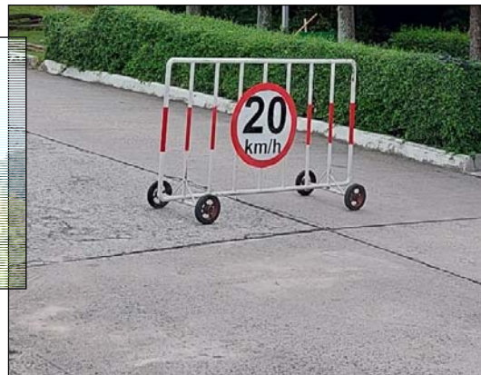
รูปที่ 1.4(1) มีการติดตั้งป้ายจำกัดความเร็ว