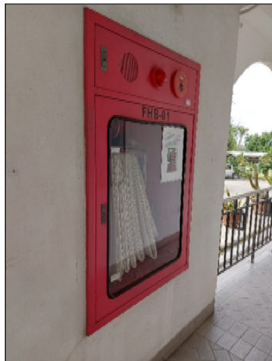
รูปที่ 3.2(4) ตู้สายฉีดน้ำดับเพลิง (Fire Hose Cabinet) ติดตั้งไว้ในอาคาร