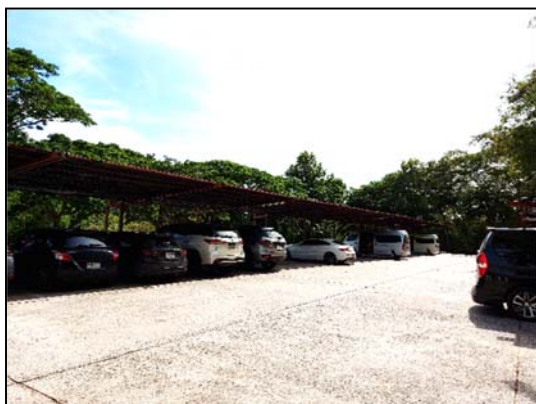
รูปที่ 2.5(1) ลานจอดรถ บริเวณหน้าอาคาร คลับเฮ้าส์