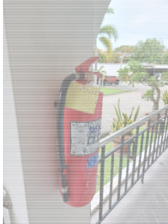
รูปที่ 3.2(2) จัดให้มีถังดับเพลิงชนิดมือถือ ชนิด Dry Chemical ขนาด 10 ปอนด์