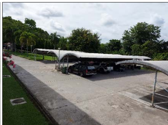
รูปที่ 2.5(2) ลานจอดรถ บริเวณ หน้าอาคารโรงแรมส่วนขยาย