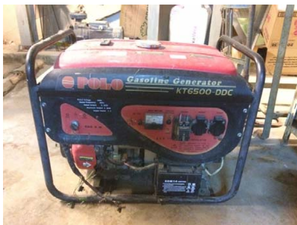
รูปที่ 3.2(5) เครื่องปั่นไฟขนาด 5KW