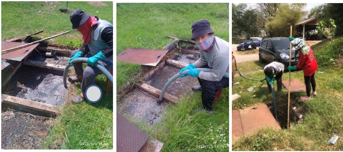
รูปที่ 1.6 การสูบล้างตะกอนออกจากระบบบำบัดไปกำจัด