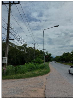
รูปที่ 1.1(1) จัดทำรั้วโดยรอบพื้นที่โครงการ