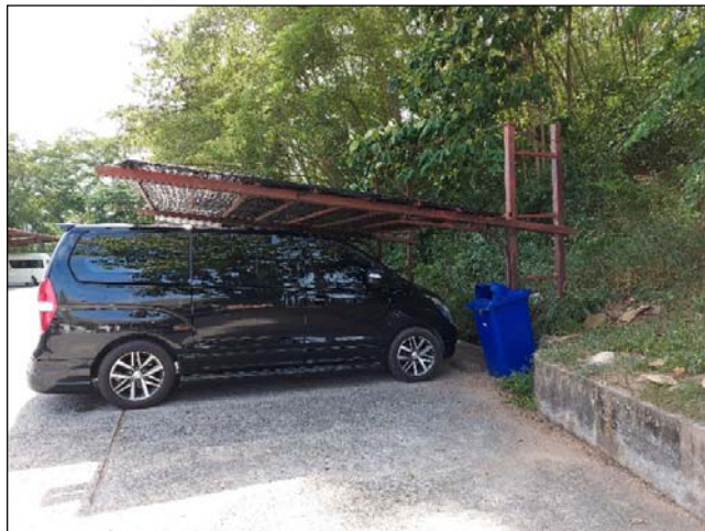
รูปที่ 3.3(2) จัดให้มีภาชนะรองรับขยะ ที่มีฝาปิด มิดชิด ตามจุดต่างๆ ของโครงการ