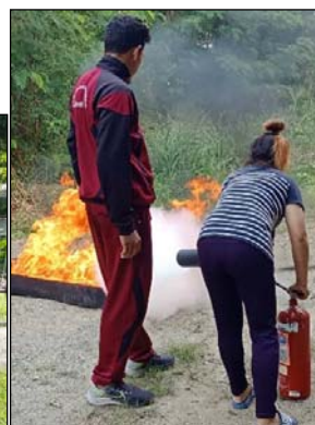
รูปที่ 3.2(1) จัดให้มีการอบรม และฝึกซ้อมการดับเพลิง และอพยพหนีไฟ