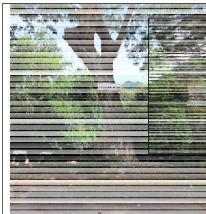
รูป 1.2 (2) ติดตั้งป้ายบริเวณลานจอดรถ “โปรดดับเครื่องยนต์ขณะจอดรถ”