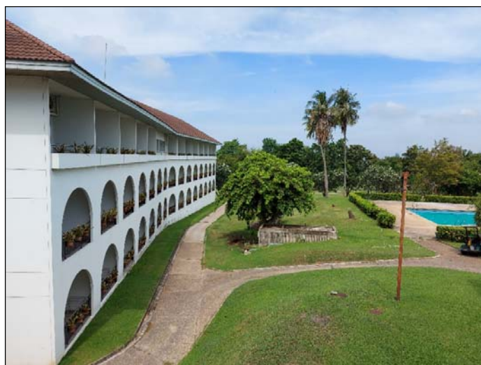
รูปที่ 3. 4(3) ทัดนียภาพและสุนทรียภาพ อาคารของ โครงการฯ ได้มีการออกแบบตาม สภาพภูมิประเทศ