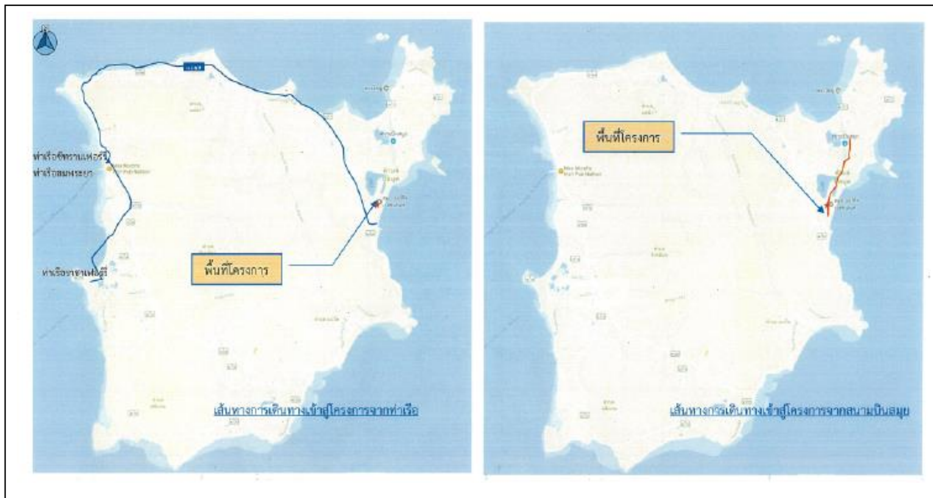
รูปที่ 1.2-1 ที่ตั้งโครงการ