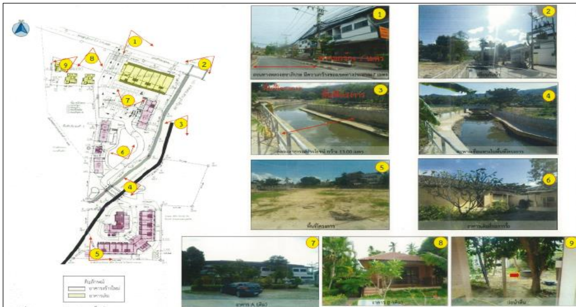
รูปที่ 1.2-4 สภาพพื้นที่ปัจจุบันของโครงการ ที่มา : บริษัท กรีน เอ็นไว เอ็นจิเนียริง จำกัด 2566