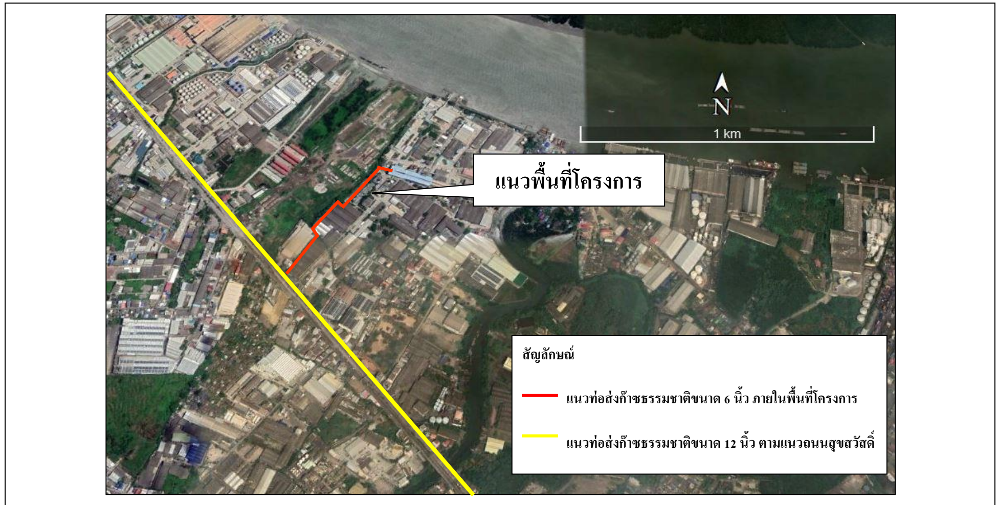
รูปที่ 2.1-1 ที่ตั้งโครงการ