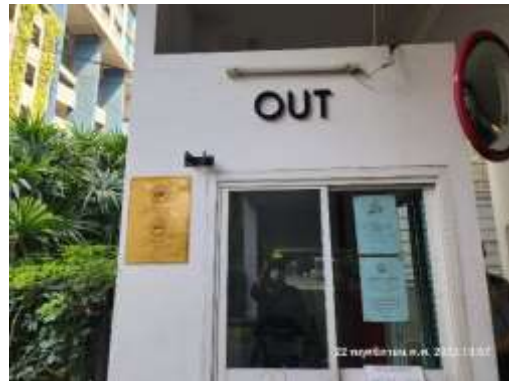
รูปที่ 30 ป้ายแสดงทางเข้า-ออก