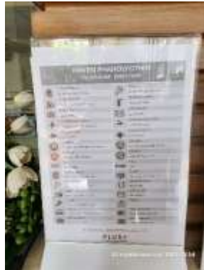
รูปที่ 35 เบอร์ดติดต่อสาธารณะ กรณีอุบัติเหตุ หรือกระแสไฟฟ้าขัดข้อง