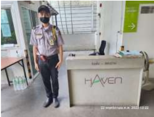
รูปที่ 37 เจ้าหน้าที่รักษาความปลอดภัย