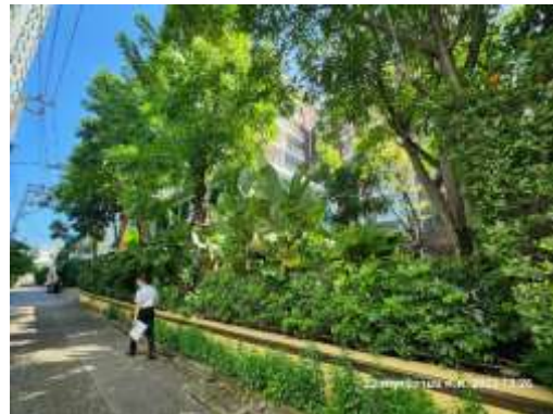
รูปที่ 3 พื้นที่สีเขียวภายในโครงการ