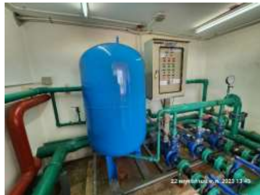
รูปที่ 40 ถังเก็บน้ำใช้ภายในโครงการ