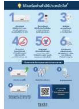
รูปที่ 34 ป้ายประชาสัมพันธ์ให้ถึงการประหยัดไฟ