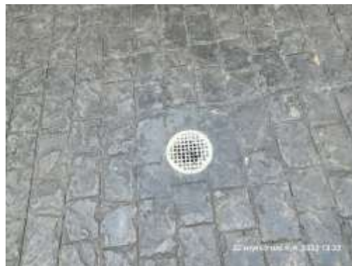
รูปที่ 4 ตะแกรงดักขยะ