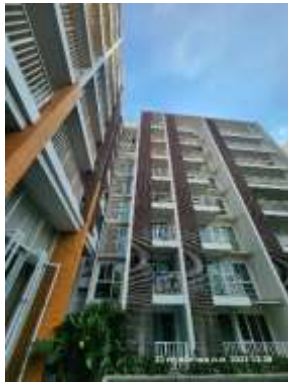
รูปที่ 5 แบบอาคารของโครงการเป็นไปตามกฎหมาย