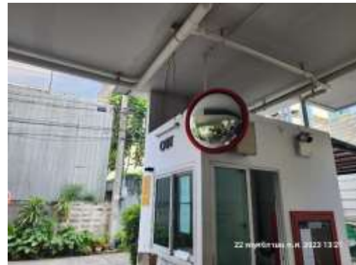
รูปที่ 12 กระจกโค้ง บริเวณทางเข้า-ออกโครงการ