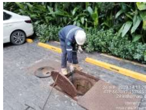
รูปที่ 36 ระบบบำบัดน้ำเสีย