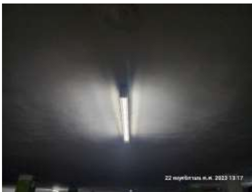
รูปที่ 13 ไฟแสงสว่างบริเวณพื้นที่จอดรถ