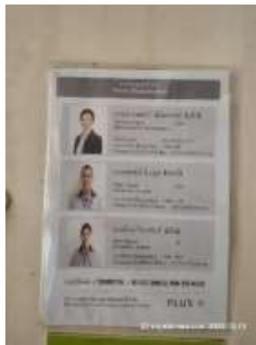
รูปที่ 42 เจ้าหน้าที่ดูแลระบบบำบัดน้ำเสีย