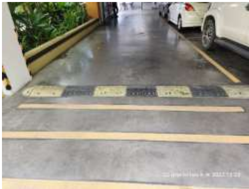
รูปที่ 11 สันนูน