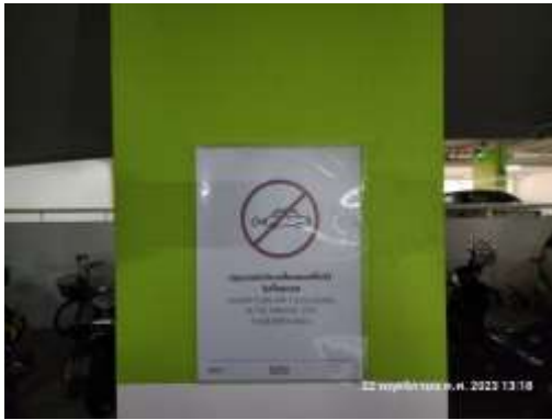
รูปที่ 28 ป้าย “ห้ามติดเครื่องขณะจอดรถ”