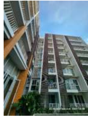
รูปที่ 16 วัสดุบุหลังคาและอาคารถ่ายเทความร้อน