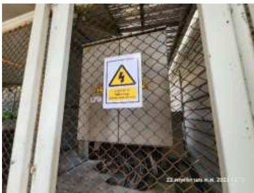
รูปที่ 26 หม้อแปลงไฟฟ้า