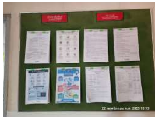
รูปที่ 32 ป้ายประชาสัมพันธ์ด้านจราจร