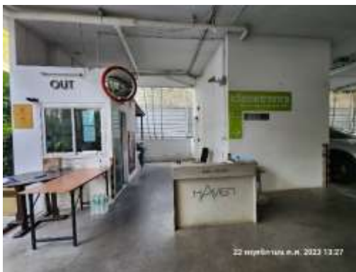
รูปที่ 8 ป้อมยามประจำพื้นที่บริเวณทางเข้า-ออก