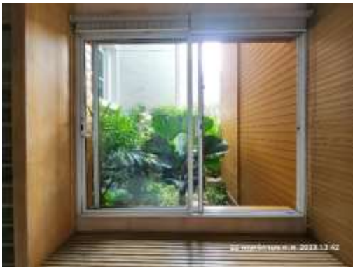
รูปที่ 17 ใช้กระจกดูดซับความร้อนต่ำ