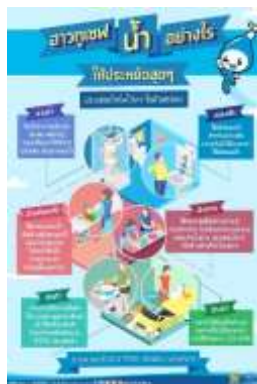
รูปที่ 31 ป้ายประชาสัมพันธ์ประหยัดน้ำ