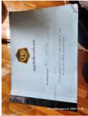
รูปที่ 7 ลงทะเบียนควบคุมยานพาหนะ