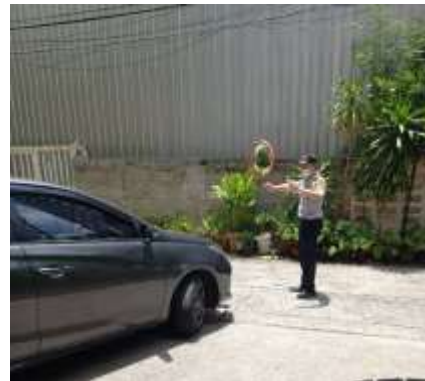
รูปที่ 2 ระบบการจราจรภายในโครงการ