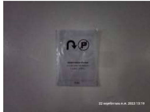
รูปที่ 10 ป้ายแสดงทิศทางการจราจร