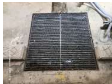
รูปที่ 23 บ่อหน่วงน้ำ