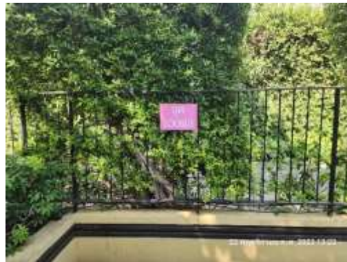
รูปที่ 25 จุดรวมพล