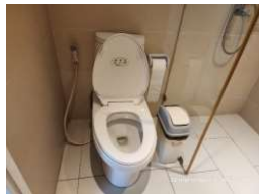
รูปที่ 14 สุขภัณฑ์ประหยัdnน้ำ