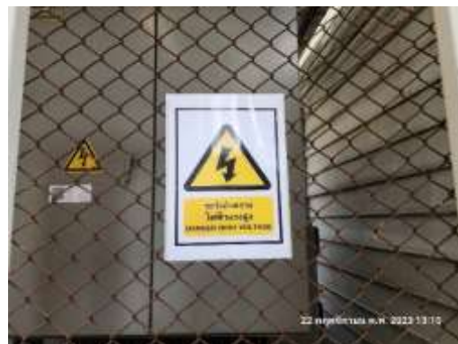
รูปที่ 27 ป้ายระอันตรายจากไฟฟ้า