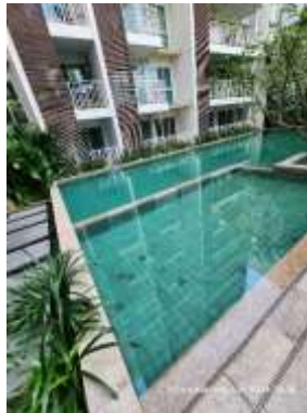
รูปที่ 39 น้ำสระว่ายน้ำ