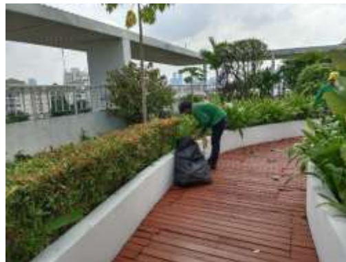
รูปที่ 44 เจ้าหน้าที่ดูแลพื้นที่สีเขียวภายในโครงการ