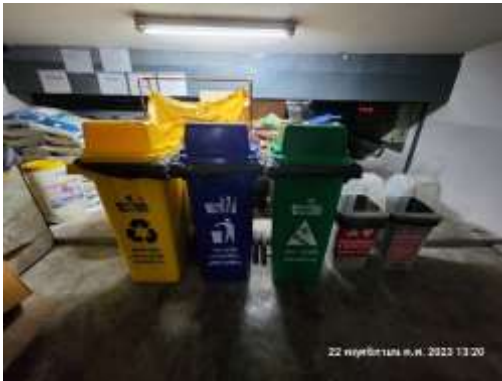
รูปที่ 19 ภาชนะรองรับมูลฝอย