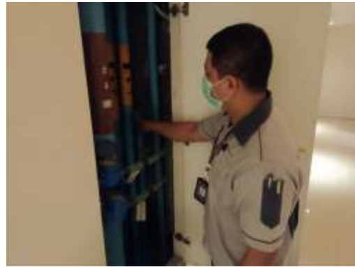
รูปที่ 15 ตรวจสอบรอยรั่วของท่อจ่ายน้ำ