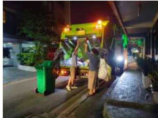
รูปที่ 21 พนักงานจัดเก็บมูลฝอย