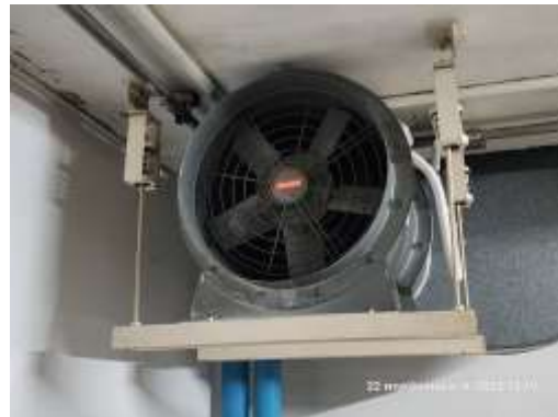
รูปที่ 1 การระบายอากาศในพื้นที่จอดรถ