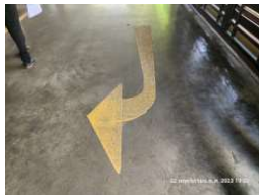
รูปที่ 9 ลูกศรแสดงทิศทางการจราจร