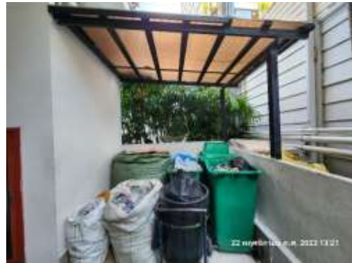
รูปที่ 20 ห้องพักมูลฝอยรวม