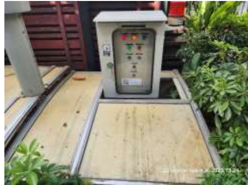
รูปที่ 38 ตัวควบคุมระบบบำบัดน้ำเสีย