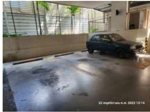
รูปที่ 6 พื้นที่จอดรถ