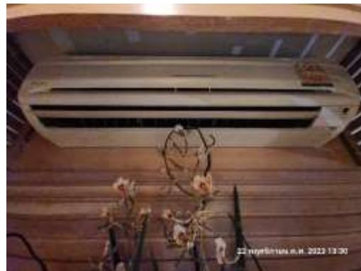
รูปที่ 18 อุปกรณ์หรือเครื่องใช้ไฟฟ้าประหยัดพลังงาน