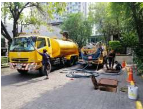
รูปที่ 22 สูบล้าง/สูบล้างท่อ