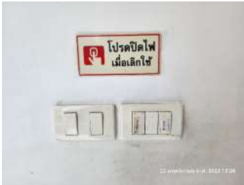
รูปที่ 33 ป้ายประหยัดไฟ