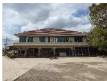
สำนักงานโครงการ