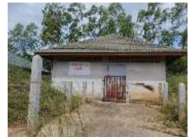
อาคารเก็บวัสดุระเบิด