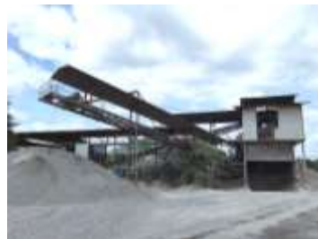
โรงโม่หินของโครงการ