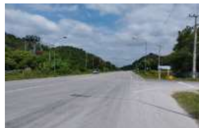
ทางหลวงหมายเลข 1