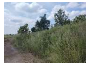
พื้นที่เว้นการทำเหมือง