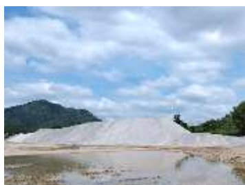
ลานกองแร่