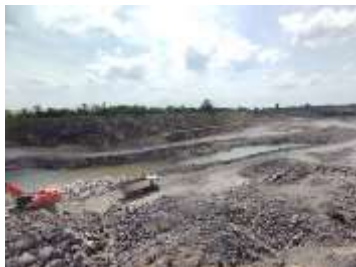
พื้นที่หน้าเหมือง