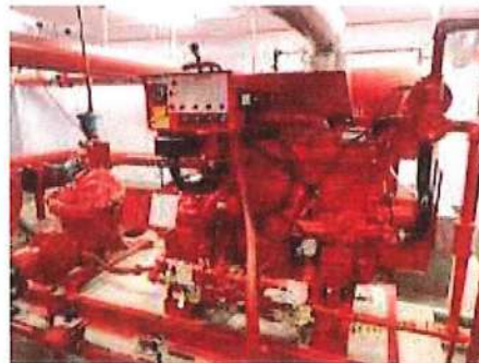
รูปที่ 1.8-1 เครื่องสูบน้ำดับเพลิง (Fire Pump)