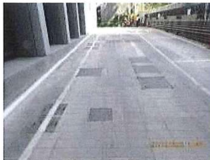
รูปที่ 1.4.1 ระบบบำบัดน้ำเสีย