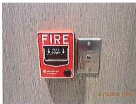
เครื่องแจ้งเหตุโดยใช้มือดึง