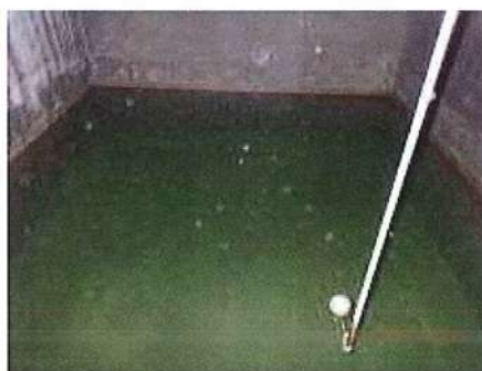
ถังเก็บน้ำใต้ดิน และถังเก็บน้ำชั้นดาดฟ้า