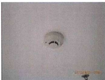
เครื่องตรวจจับควัน