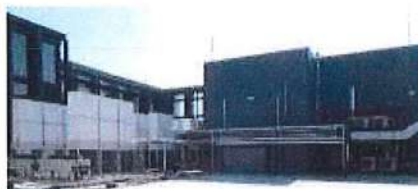
พื้นที่หนีทางอากาศ