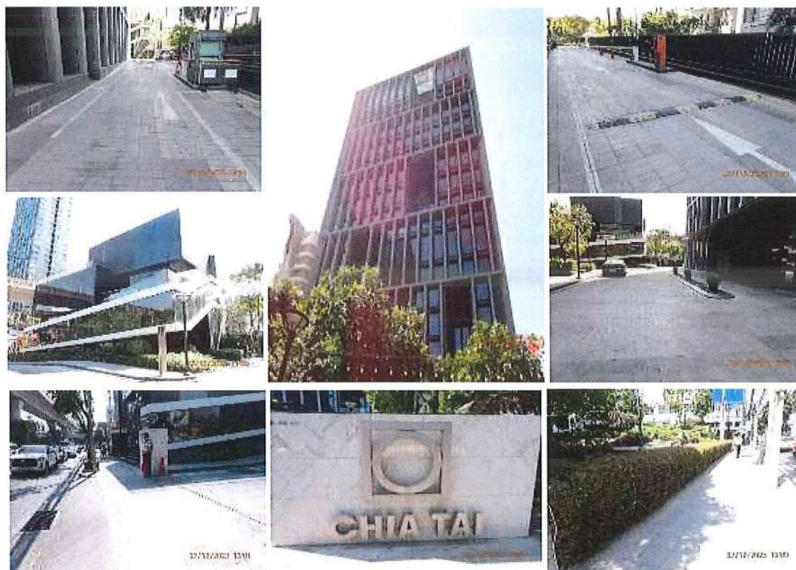
รูปที่ 1.1-1 สภาพพื้นที่โครงการปัจจุบันเมื่อวันที่ 27 ธันวาคม 2566