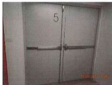
รูปที่ 1.8-5 ลิฟต์ดับเพลิง