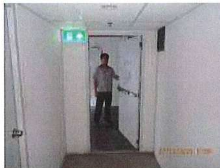
บันไดหนีไฟ ST1,ST-2