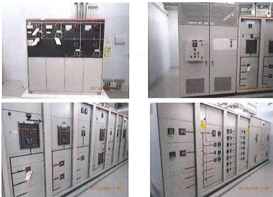
รูปที่ 1.7-1 ห้องหม้อแปลง และระบบไฟฟ้าหลัก

อนึ่งโครงการจะเลือกใช้หลอดไฟแบบ Light Emitting Diode (LED) เพื่อประหยัดพลังงานภายในอาคาร