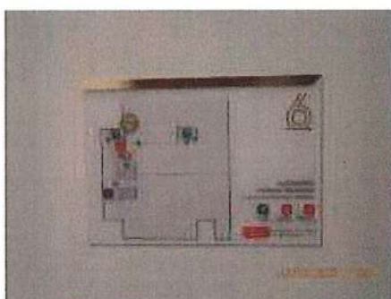
แผนผังเส้นทางหนี