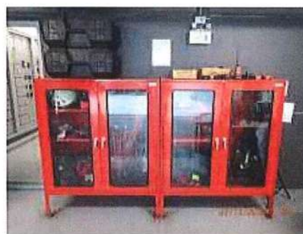
รูปที่ 1.8-4 ตู้เก็บสายฉีดน้ำดับเพลิงพร้อมอุปกรณ์