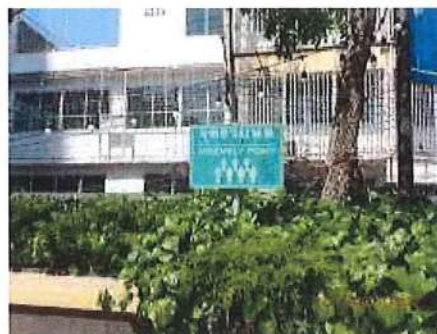
จุดรวมพล