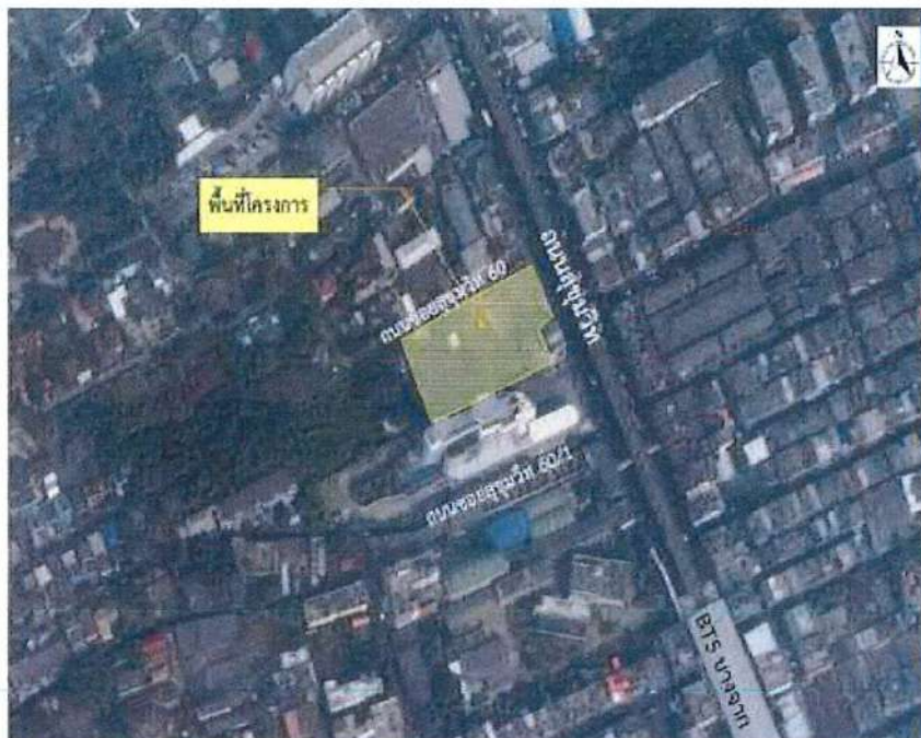
รูปที่ 1.3-1 ตำแหน่งที่ตั้งโครงการ