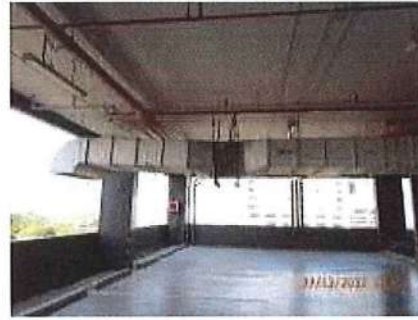
รูปที่ 1.9-1 ระบบปรับอากาศ ระบบระบายอากาศ และพื้นที่เปิดโล่ง