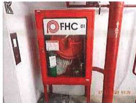
รูปที่ 1.8-2 ระบบท่อยืน (Stand Pipe)

(3) หัวรับน้ำดับเพลิงภายนอกอาคาร (Fire Department Connector : FDC) โครงการจะติดตั้งหัวรับน้ำดับเพลิงภายนอกอาคาร (FDC) ขนาด 6 \times 2\frac{1}{2} \times 2\frac{1}{2} นิ้ว พร้อม Check Valve จำนวน 1 ชุด เพื่อรับน้ำดับเพลิงจากรถดับเพลิงของสถานีดับเพลิงพระโขนง สำหรับเติมน้ำไปยังถังเก็บน้ำดับเพลิงใต้ดิน จำนวน 1 ชุด และสำหรับจ่ายน้ำเข้าสู่ระบบท่อยืน