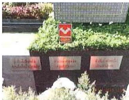
รูปที่ 1.8-3 หัวรับน้ำดับเพลิงภายนอกอาคาร