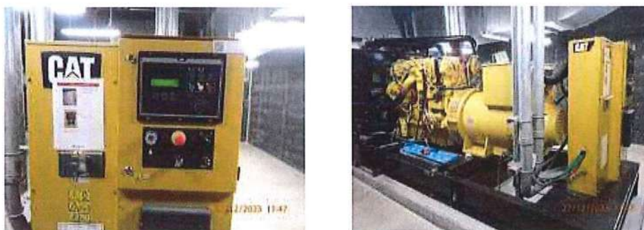
รูปที่ 1.7-2 ห้องเครื่องกำเนิดไฟฟ้าสำรอง (Generator)

2) ระบบไฟฟ้าฉุกเฉิน โครงการจะจัดให้มีการติดตั้งโคมไฟฉุกเฉินขนาด 12 V สามารถสำรองไฟได้นาน 2 ชั่วโมง และมีเครื่องกำเนิดไฟฟ้าสำรอง ขนาด 50KVA จำนวน 1 ชุด สามารถสำรองไฟได้นาน 2 ชั่วโมง อนึ่งกรมโยธา ธิการและผังเมือง กระทรวงมหาดไทย ได้กำหนดมาตรฐานการติดตั้งห้องหม้อแปลงไฟฟ้าดังนี้