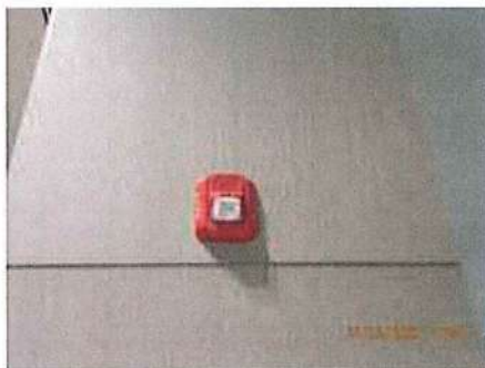
ลำโพงแจ้งสัญญาณเตือนอัคคีภัย