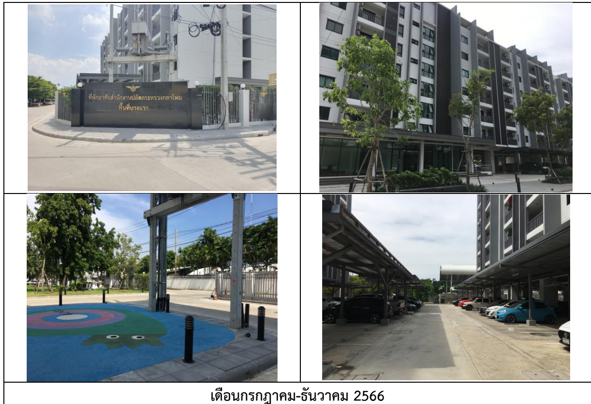
รูปที่ 1.3-1 สภาพปัจจุบันของโครงการ

การดำเนินงานปัจจุบัน (เดือนเดือนกรกฎาคม-ธันวาคม พ.ศ. 2566) โครงการก่อสร้างอาคารพักอาศัย พร้อมสิ่งอำนวยความสะดวกของ สำนักงานปลัดกระทรวงกลาโหม (พื้นที่บางจาก (พื้นที่ 1)) เป็นการดำเนินงานในระยะดำเนินการ เนื่องจากการก่อสร้างโครงการได้เสร็จสิ้นแล้วเมื่อเดือนกรกฎาคม-ธันวาคม พ.ศ. 2566 แสดงดังรูปที่ 1.3-1