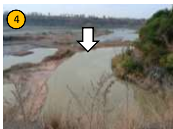
บ่อกักเก็บน้ำ