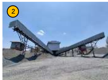
โรงโม่หิน