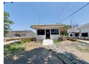
สำนักงานโครงการ