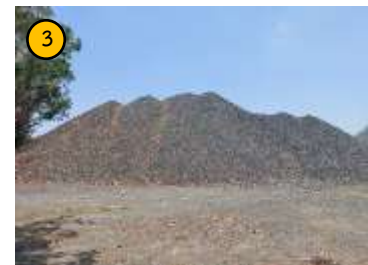
ลานเก็บกองแร่