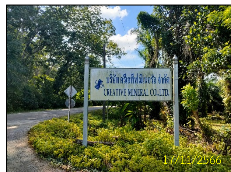
ถนนทางเข้าโครงการ รูปที่ 1-1 ตำแหน่งที่ตั้งโครงการ