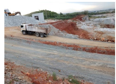
เส้นทางขนส่งแร่ระหว่างหน้าเหมือง-โรงโม่หิน