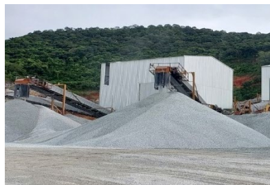
พื้นที่โรงโม่หินของโครงการ