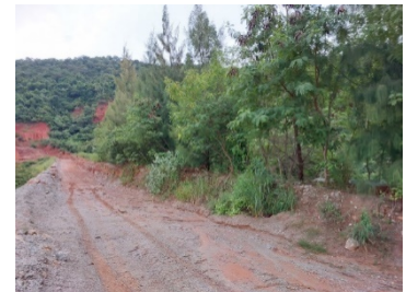
แนวเวนไม่ทำเหมือง