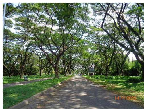
รูปที่ 1-2 แสดงสภาพแวดล้อมทั่วไปภายในพื้นที่โครงการ