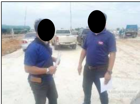
ผู้ใหญ่บ้านหมู่ที่ 8 ตำบลท่าสะอ้าน อำเภอบางปะกง จังหวัดฉะเชิงเทรา