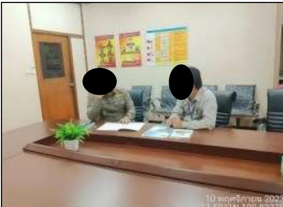
สถานีตำรวจภูธรบางเสาธง อำเภอบางเสาธง จังหวัดฉะเชิงเทรา