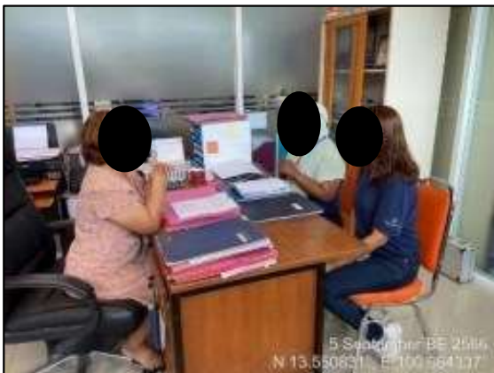
สำนักปลัดเทศบาลตำบลบางวัวฉนวนรักษ์ อำเภอบางปะกง จังหวัดฉะเชิงเทรา