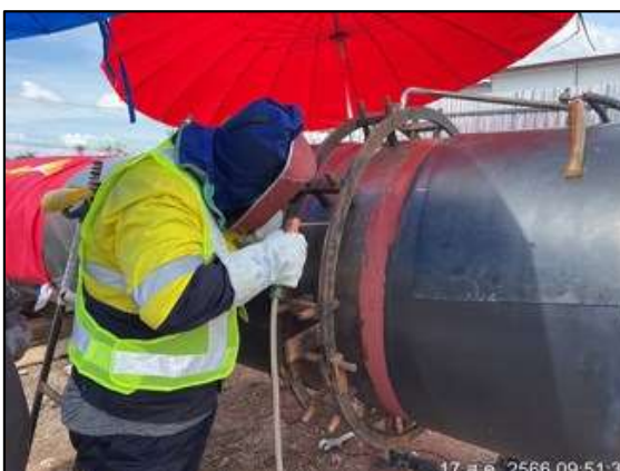
ต) การเชื่อมต่อในกิจกรรมการวางท่อ โดยวิธีการดันลวดระยะยาว (DP#21)