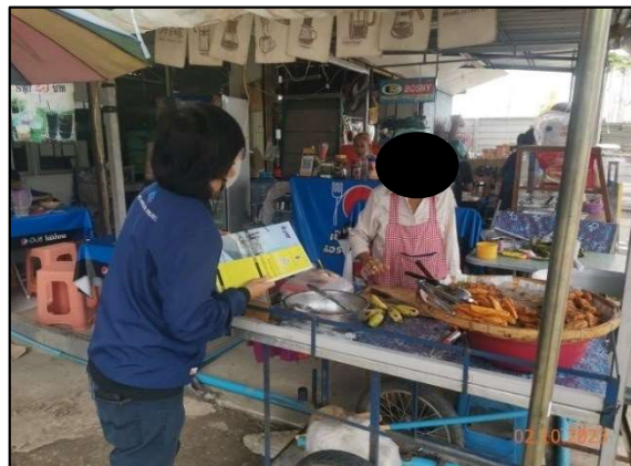
ประชาชนหมู่ที่ 3 ตำบลบางแก้ว อำเภอบางพลี จังหวัดสมุทรปราการ

ก) การประสานงานเข้าพบหน่วยงานที่เกี่ยวข้อง เพื่อชี้แจงรายละเอียด วิธีการก่อสร้าง แจ้งแผนการก่อสร้าง และมาตรการป้องกันผลกระทบสิ่งแวดล้อม