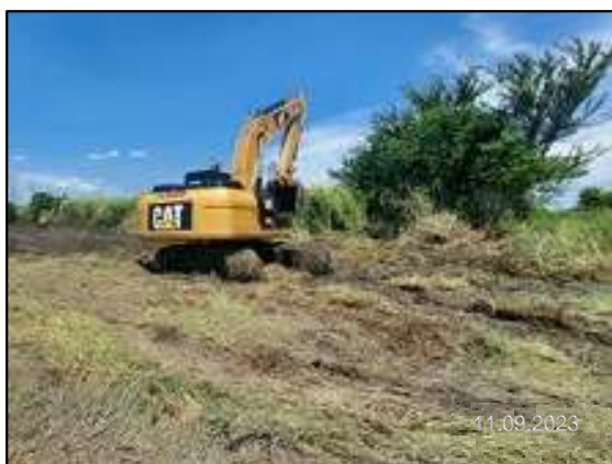
ข) การปรับสภาพพื้นที่เตรียมการก่อสร้าง (BS#6)

ก) การประสานงานเข้าพบหน่วยงานที่เกี่ยวข้อง เพื่อชี้แจงรายละเอียด วิธีการก่อสร้าง แจ้งแผนการก่อสร้าง และมาตรการป้องกันผลกระทบสิ่งแวดล้อม