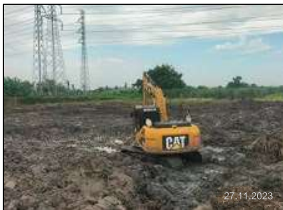
ข) การการปรับพื้นที่เตรียมการก่อสร้าง (BS#6)

ก) การประสานงานเข้าพบหน่วยงานที่เกี่ยวข้อง เพื่อชี้แจงรายละเอียด วิธีการก่อสร้าง แจ้างแผนการก่อสร้าง และมาตรการป้องกันผลกระทบสิ่งแวดล้อม