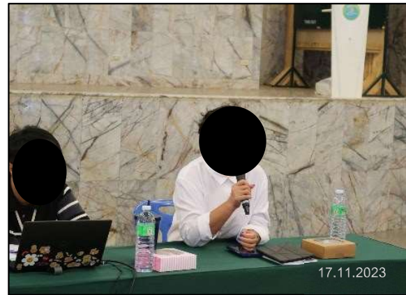
การประชุมรับฟังความคิดเห็นของประชาชนและผู้มีส่วนได้ส่วนเสียต่อการดำเนินการก่อสร้าง พื้นที่ตำบลบางปลา อำเภอบางพลี จังหวัดสมุทรปราการ