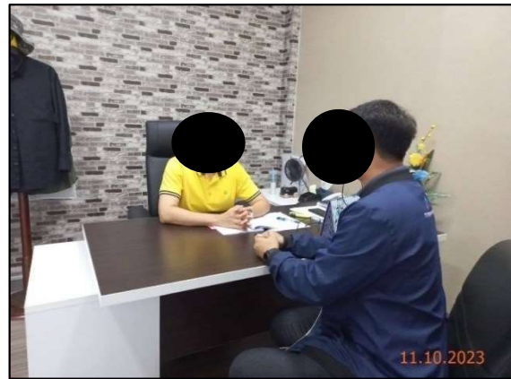
รองนายกองค์การบริหารส่วนตำบลบางโปรง อำเภอเมืองสมุทรปราการ จังหวัดสมุทรปราการ