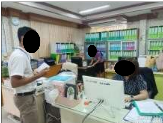
องค์การบริหารส่วนตำบลหอมศีล อำเภอบางปะกง จังหวัดฉะเชิงเทรา