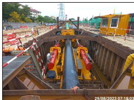
ค) การวางท่อโดยวิธีการดันลวดระยะยาว (DP#21)