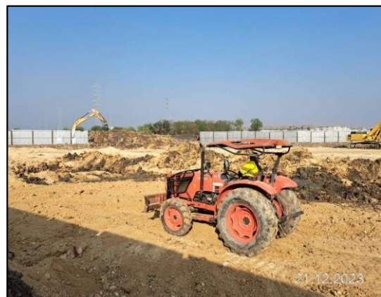
ง) การเตรียมพื้นที่ก่อสร้างสถานีควบคุมก๊าซ (BVS#1)