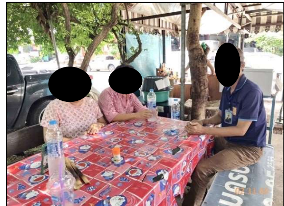
ประชาชนหมู่ที่ 11 ตำบลบางปลา อำเภอบางพลี จังหวัดสมุทรปราการ

ก) การประสานงานเข้าพบหน่วยงานที่เกี่ยวข้อง เพื่อชี้แจงรายละเอียด วิธีการก่อสร้าง แจ้างแผนการก่อสร้าง และมาตรการป้องกันผลกระทบสิ่งแวดล้อม