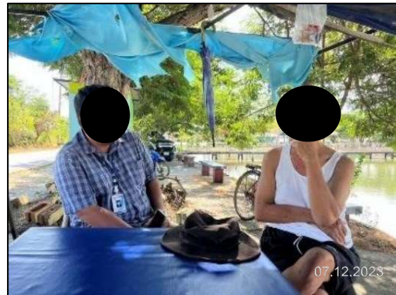
ประชาชนหมู่ที่ 5 ตำบลบางเกลือ อำเภอบางปะกง จังหวัดฉะเชิงเทรา