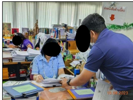
องค์การบริหารส่วนตำบลบางพลี อำเภอบางพลี จังหวัดสมุทรปราการ