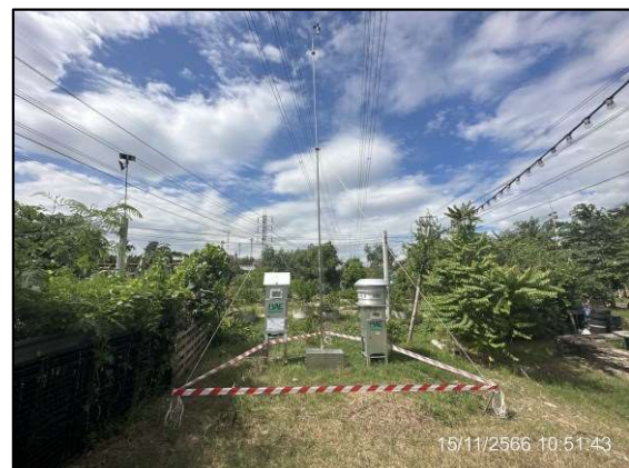
ค) การตรวจวัดคุณภาพสิ่งแวดล้อมบริเวณพื้นที่อ่อนไหว (ชุมชนซอยบางโปรง 11)

รูปที่ 1-6 กิจกรรมการดำเนินโครงการในเดือนพฤศจิกายน พ.ศ. 2566