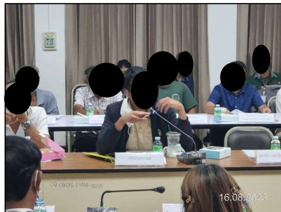
ก) การประชุมคณะกรรมการกำกับและติดตามการปฏิบัติตามมาตรการป้องกันและแก้ไขผลกระทบสิ่งแวดล้อม พื้นที่อำเภอบางพลี จังหวัดสมุทรปราการ