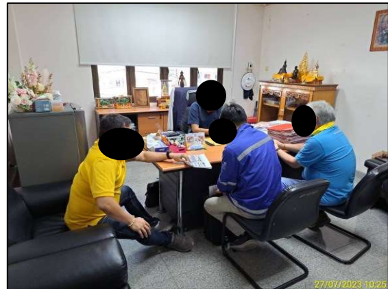
องค์การบริหารส่วนตำบลท่าข้าม อำเภอบางปะกง จังหวัดฉะเชิงเทรา