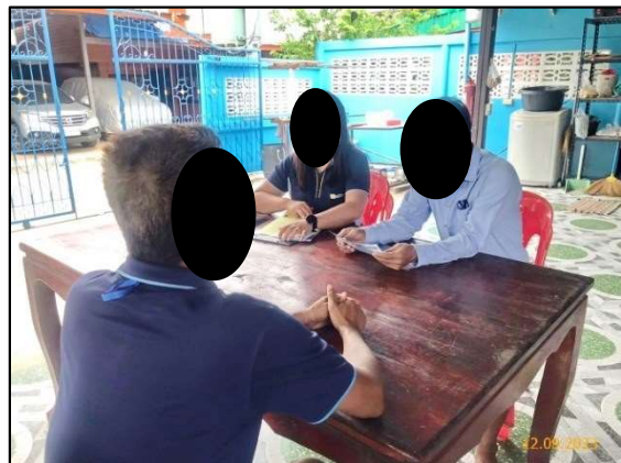
ผู้ใหญ่บ้านหมู่ที่ 2 ตำบลบางปลา อำเภอบางพลี จังหวัดสมุทรปราการ

ก) การประสานงานเข้าพบหน่วยงานที่เกี่ยวข้อง เพื่อชี้แจงรายละเอียด วิธีการก่อสร้าง แจ้งแผนการก่อสร้าง และมาตรการป้องกันผลกระทบสิ่งแวดล้อม