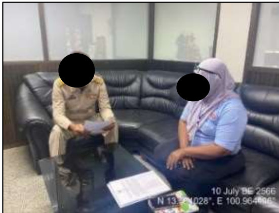
องค์การบริหารส่วนตำบลบางวัวควนารักษ์ อำเภอบางปะกง จังหวัดฉะเชิงเทรา