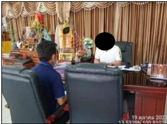
นายกองค์การบริหารส่วนตำบลบางเปรี้ยว ตำบลบางเปรี้ยว อำเภอบางบ่อ จังหวัดสมุทรปราการ