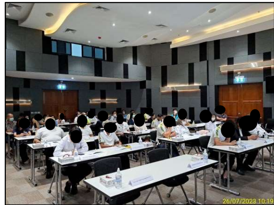
การประชุมรับฟังความคิดเห็นของประชาชนและผู้มีส่วนได้ส่วนเสียต่อการดำเนินการก่อสร้าง พื้นที่อำเภอเมืองสมุทรปราการ จังหวัดสมุทรปราการ