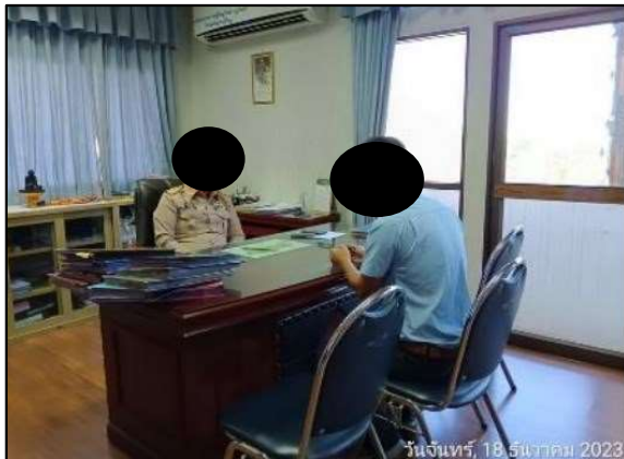
นายอำเภอบางเสาธง อำเภอบางเสาธง จังหวัดสมุทรปราการ