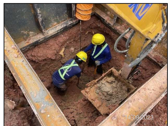
ค) การสำรวจระบบสาธารณูปโภคใกล้เคียงแนววางท่อ (KP0+210)

รูปที่ 1-4 กิจกรรมการดำเนินโครงการในเดือนกันยายน พ.ศ. 2566