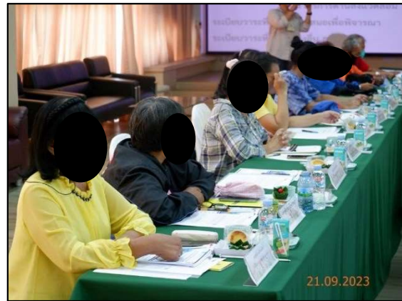
การประชุมรับฟังความคิดเห็นของประชาชนและผู้มีส่วนได้ส่วนเสียต่อการดำเนินการก่อสร้าง พื้นที่อำเภอพระประแดง จังหวัดสมุทรปราการ