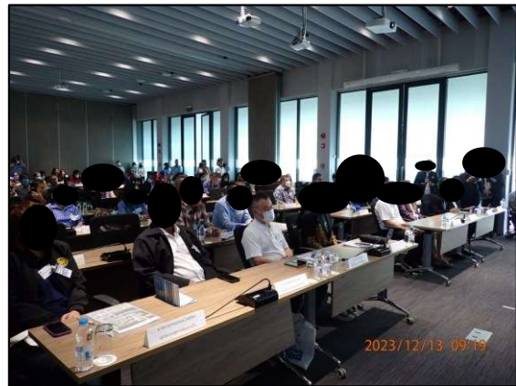
ก. การประชุมคณะกรรมการกำกับและติดตามการปฏิบัติตามมาตรการป้องกันและแก้ไขผลกระทบสิ่งแวดล้อม พื้นที่อำเภอบางปะกง จังหวัดฉะเชิงเทรา