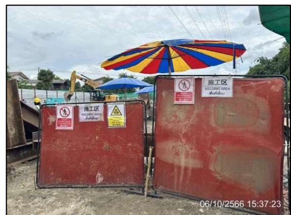
ค) การเชื่อมต่อในกิจกรรมการวางท่อ โดยวิธีการต้นลอดระยะยาว (DP#23)

รูปที่ 1-5 กิจกรรมการดำเนินโครงการในเดือนตุลาคม พ.ศ. 2566