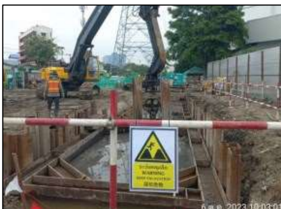
ข) การติดตั้ง Sheet pile เตรียมพื้นที่ป่อรับในกิจกรรม การวางท่อโดยวิธีการต้นลอดระยะยาว (DP#23)

ก) การประสานงานเข้าพบหน่วยงานที่เกี่ยวข้อง เพื่อชี้แจงรายละเอียด วิธีการก่อสร้าง แจ้งแผนการก่อสร้าง และมาตรการป้องกันผลกระทบสิ่งแวดล้อม