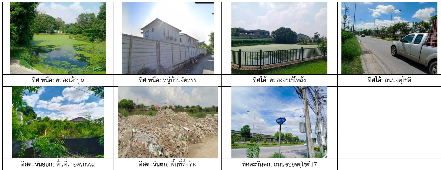
รูปที่ 1.2 แสดงการใช้ประโยชน์บริเวณพื้นที่โครงการและพื้นที่ใกล้เคียง