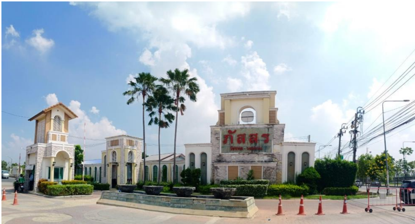
รูปที่ 1.3 สภาพโครงการในปัจจุบัน