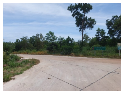
เส้นทางเข้าสู่พื้นที่โครงการ